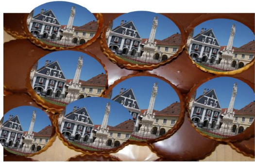
Slika 1: Bakini kolačići s otisnutim obilježjem grada