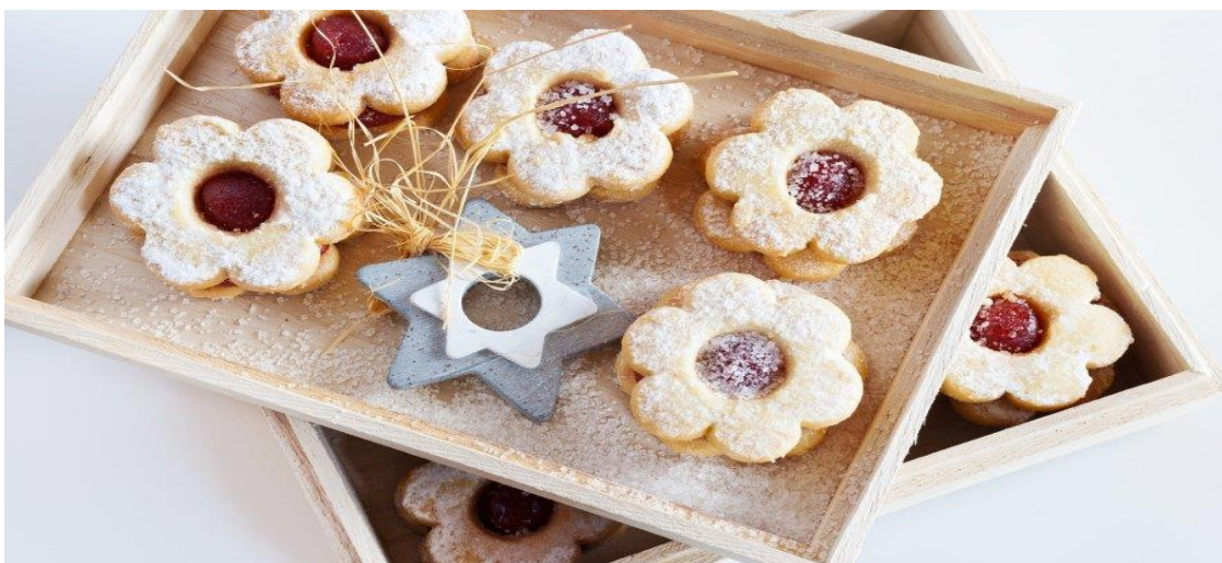
Slika 5: Pakiranje Bakinih kolačića u drvenim kutijama