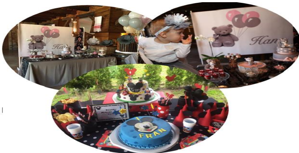
Slika 3. Dekoracije rođendana s tortama i kolačima