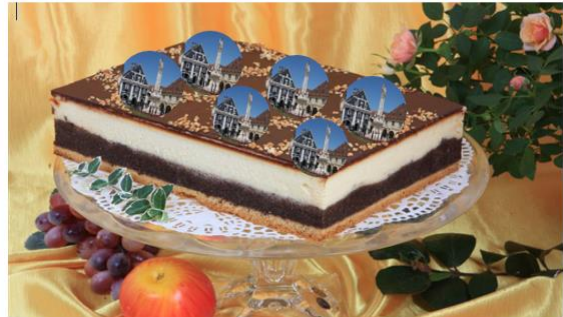
Slika 2: Bakini kolačići s otisnutim obilježjem grada