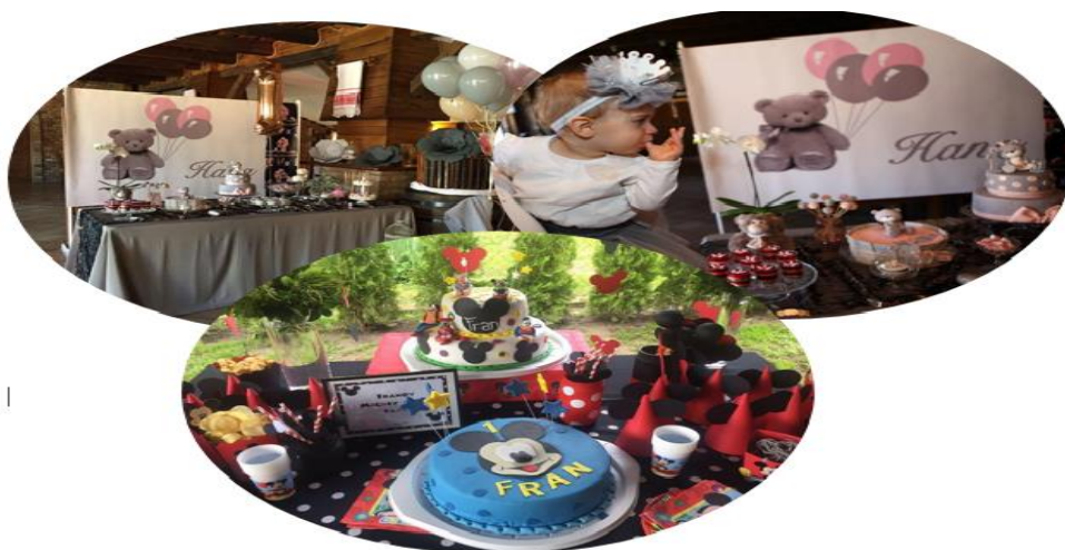
Slika 3. Dekoracije rođendana s tortama i kolačima