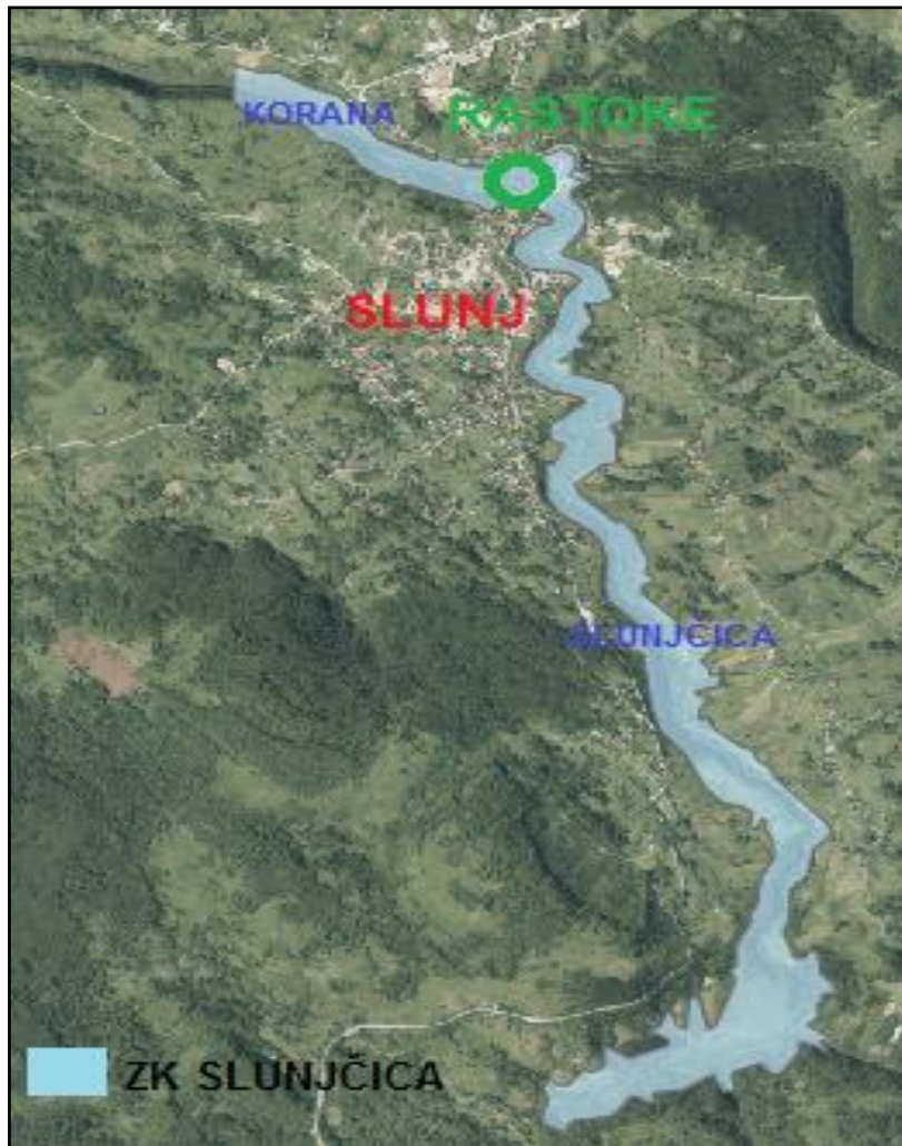
Slika br.1. Područje ZK Slunčica