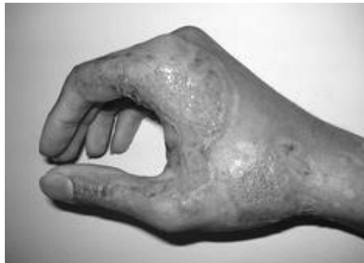
Slika 1. Opekline uzrokovana korozivnom tvari ( https://www.google.com/search?q=opekline+korozivnim+tvarima , 07.09.2018.)

Opseg i težina korozivnih oštećenja tkiva ovise o više čimbenika, među kojima su najznačajniji: osobine korozivne materije koncentracija i količina korozivne tvari i dužina trajanja kontakta sa tkivima. Za nastanak korozivnih lezija naročito su važne osobine korozivne tvari, kao što je njena sposobnost da rastvara određene organske sastojke i tako prodire u tkiva, pH, viskoznost. Kemijska konstanta koja označava sposobnost tvari da oslobodi vodikove ione - pH je jedan od osnovnih pokazatelja potencijalne korozivnosti. Postoje brojne klasifikacije korozivnih tvari. U kemijskom smislu, većina se može svrstati u kiseline i lužine. Kiseline disocijacijom oslobađaju ione vodika i imaju sposobnost dovesti do denaturacije u dodiru s tkivima i taloženje proteina. Prilikom disocijacije kiselina, osim vodikovih iona, nastaje i anion kiselinskog ostataka, koji također doprinosi oštećenju tkiva. Gutanje korozivnih materija dovodi prvenstveno do lokalnih oštećenja probavnog trakta, usne šupljine, mokraćnog mjehura, jednjaka, želuca, tankog crijeva.