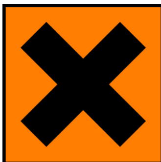
Slika 6. Prikaz simbola za štetnost

Znakom za štetnost (Xn) i simbolom označavaju se otrovi skupine III. Simbol je Andrijin križ crne boje na narančastoj podlozi. Pokraj znaka se stavlja natpis „Štetno“