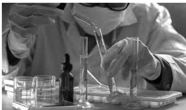
Slika 9. Rad u laboratoriju

Radnici koji su zaposleni u raznim laboratorijima i na poslovima čišćenja i održavanja najviše su izloženi djelovanju kiselina i lužina te je pri radu obvezna uporaba propisanih zaštitnih sredstava. Najčešće nezgode i oštećenja zdravlja su posljedica ljudske nepažnje, nepoznavanja svojstava tvari i sigurnih postupaka pri radu te neinformiranosti i nedostatne edukacije o obveznoj uporabi propisanih zaštitnih sredstava. Osim profesionalne izloženosti, kiseline i lužine mogu se naći i u većini kućanstava gdje se najčešće upotrebljavaju za čišćenje sanitarija.