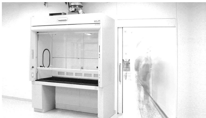
Slika 2. Digestor

Lužine su u užem smislu hidroksidi alkalijskih metala (najčešće se koriste natrijeva, kalijeva i litijeva lužina), a u širem smislu to su sve tvari koje u vodenoj otopini povećavaju koncentraciju OH- iona tj. povisuju pH vrijednost. Ipak, uobičajeno je da se takve tvari zovu baze a ako su to baze alkalijskih metala onda ih tradicionalno zovemo lužinama. Nagrizaju kožu te se njima treba vrlo oprezno rukovati. Najpoznatije jake lužine (baze) su natrij-hidroksid i kalij-hidroksid i najviše se upotrebljavaju u industriji sapuna i viskoze dok se kalcij-hidroksid upotrebljava u građevinarstvu i kemijskoj industriji. Kalcij-hidroksid sporije nagriza kožu, ali je za oči jednako opasan kao i jake lužine. Pri radu s lužinama moraju se nositi zaštitne naočale i rukavice. Amonij-hidroksid je slaba lužina, dobiva se otapanjem amonijaka u vodi, a čak i koncentrirane otopine slabo nagrizzaju kožu, ali su pare amonijaka jako štetne za oči i dišne organe te se pri radu s amonijakom obvezno treba raditi u digestoru