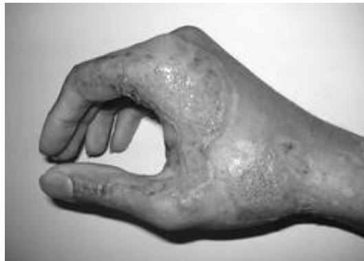
Slika 1. Opekline uzrokovana korozivnom tvari ( https://www.google.com/search?q=opekline+korozivnim+tvarima , 07.09.2018.)

Opseg i težina korozivnih oštećenja tkiva ovise o više čimbenika, među kojima su najznačajniji: osobine korozivne materije koncentracija i količina korozivne tvari i dužina trajanja kontakta sa tkivima. Za nastanak korozivnih lezija naročito su važne osobine korozivne tvari, kao što je njena sposobnost da rastvara određene organske sastojke i tako prodire u tkiva, pH, viskoznost. Kemijska konstanta koja označava sposobnost tvari da oslobodi vodikove ione - pH je jedan od osnovnih pokazatelja potencijalne korozivnosti. Postoje brojne klasifikacije korozivnih tvari. U kemijskom smislu, većina se može svrstati u kiseline i lužine. Kiseline disocijacijom oslobađaju ione vodika i imaju sposobnost dovesti do denaturacije u dodiru s tkivima i taloženje proteina. Prilikom disocijacije kiselina, osim vodikovih iona, nastaje i anion kiselinskog ostataka, koji također doprinosi oštećenju tkiva. Gutanje korozivnih materija dovodi prvenstveno do lokalnih oštećenja probavnog trakta, usne šupljine, mokraćnog mjehura, jednjaka, želuca, tankog crijeva.