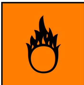
Slika 8. Prikaz simbola za oksidaciju ( https://www.google.com/search?q=oksidacija , 07.09.2018.)

Znakom za oksidirajuće djelovanje (O) i simbolom označavaju se otrovi koji u dodiru s drugom tvari daju jako egzotermne reakcije ( oslobađanje topline ). Simbol je crne boje na narančastoj podlozi.