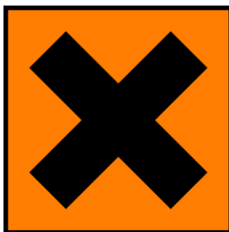
Slika 6. Prikaz simbola za štetnost

Znakom za štetnost (Xn) i simbolom označavaju se otrovi skupine III. Simbol je Andrijin križ crne boje na narančastoj podlozi. Pokraj znaka se stavlja natpis „Štetno“