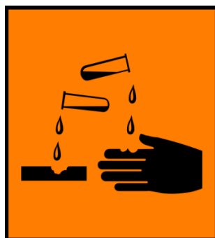
Slika 7. Prikaz simbola „koroziivnosti“ ( https://www.google.com/search?q=koroziivnost , 07.09.2018.)

Znakom za koroziivnost (C) i simbolom označavaju se otrovi koji u dodiru s organskim i anorganskim tvarima izazivaju njihova oštećenja. Simbol je crne boje na narančastoj podlozi.