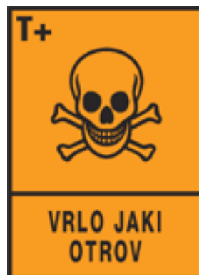
Slika 4. Prikaz simbola za vrlo jake otrove

Znakom za vrlo jaku otrovnost (T + ) i simbolom označavaju se otrovi iz Skupine I, simbol je prikaz mrtvačne crne glave na narančastoj podlozi. Pokraj znaka se stavlja natpis „vrlo jaki otrov“