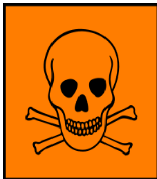
Slika 5. Prikaz simbola za otrov ( https://www.google.com/search?q=simbol+za+otrove , 07.09.2018. )

Znakom za otrovnost (T) i simbolom označavaju se otrovi iz Skupine II, simbol je prikaz mrtvačne crne glave na narančastoj podlozi. Pokraj znaka se stavlja natpis „otrov“