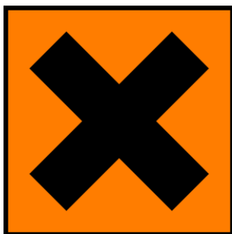
Slika 6. Prikaz simbola za štetnost

Znakom za štetnost (Xn) i simbolom označavaju se otrovi skupine III. Simbol je Andrijin križ crne boje na narančastoj podlozi. Pokraj znaka se stavlja natpis „Štetno“