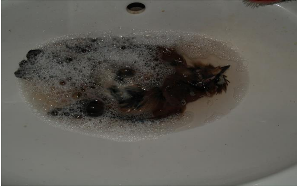
Slika 6. Pranje kože i perja