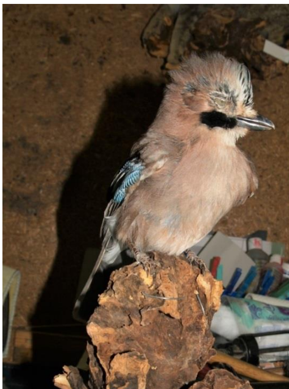
Slika 10. Dermo preparat bez umjetnih očiju