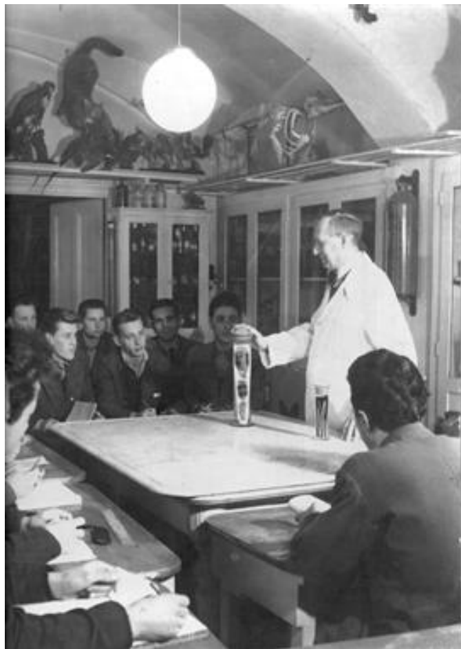
Slika 1. Predavanje u preparatorskoj školi u Zagrebu (ANONYMOUS, 2018).

Jugoslavije (ANONYMOUS, 2018). Kostur i koštani izdanci koriste se u obrazovanju veterinarara, veterinarskih tehničara, kao i srodnih znanosti. Uz napredovanje lovačkih sposobnosti i ekološke osviještenosti dolazi i divljenje prema divljači, koja nije samo izvor hrane i alatki nego važan dio globalnog ekosustava. Ono što je nekad bila alatka za obradu danas je vrlo cijenjen trofej, te ga kao takvog lovci i zaljubljenici u lov drže kao uspomenu. Riječ trofej potječe od grčke riječi τρόπαιον , tropaion , (lat. tropaeum ), a u staroj Grčkoj i Rimu izvorno je označavao ratni spomenik sastavljen od predmeta osvojenih na bojnopolju. Trofeji se u lovačkom smislu mogu definirati kao cijela životinja, odnosno neki njezin dio koji je uređen za čuvanje, a lovca podsjeća na ugodno provedeno vrijeme u prirodi i lovu, odnosno uspješan lov (DUMIĆ, 2013). Trofeje su sa ekološkog gledišta značajan pokazatelj kvalitete određenog staništa odnosno lovišta, ali i rezultat uzgojnih mjera koje su ondje provedene. Iz trofeja se mogu iščitati podatci o genetskim dispozicijama populacije divljači u staništu ali mogu poslužiti kao pokazatelj ekološkog onečišćenja i/ili zagađenja (DUMIĆ, 2013).