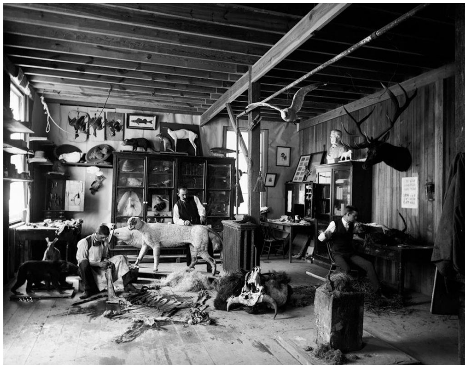
Slika 2. William T. Hornaday izrađuje dermo preparate

Kroz samu evoluciju i vrijeme izgubljene su mnoge životinjske vrste od kojih danas postoji samo fotografija ili dermo preparat, koji nam dočaravaju tu ljepotu koju smo trajno izgubili. O ulozi prepariranja u očuvanju bioraznolikosti svjedoči podatak iz 1880-ih godina kada je dr.sc. William Hornaday zoolog i glavni preparator Smithsonian muzeja, zgrožen masovnim pokoljem američkog bizona ( Bison bison ) odlučio prikupiti uzorke odstreljenih bizona koje je potom preparirao kako bi osvijestio javnost i političke dužnosnike u Washington D.C.-u na izrazitu biološku važnost opstanka američkog bizona radi očuvanja lokalnog, ali i globalnog ekosustava. Ukazao je na goruću problematiku istrebljenja vrste koja je stoljećima služila kao ishrana i izvorom alatki, odjeće i obuće domorocima američkog kontinenta. Svojim radom izravno je pridonio osnivanju saveznog zaštićenog područja ( Protected bison range ) za bizone na području nacionalnog parka Yellowstone. Skup tih aktivnosti je u konačnici rezultirao zdravom i stabilnom populacijom američkog bizona (CARR, 2017).