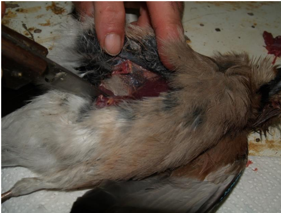
Slika 4. Zarezivanje kože od prsa do anusa

Vrat i glava se gule posljednji, od dna vrata prema lubanji, prstima ili uz pomoć noža. Kožu je tijekom cijelog postupka potrebno posipavati krumpirovim brašnom, koje apsorbira tjelesne tekućine i povećava trenje za lakši hvat. Na početku lubanje nalazi se tanka opna tj. uši, koje se odvajaju prstima ili vrškom noža. Te tanke opne se vrškom noža izvade iz njihovih duplja, a izgledaju poput malih vrećica. Daljnjim guranjem, guljenjem kože dolazi se do očiju. Kožu oko očiju treba povući prstima kako bi se postigla napetost koja će omogućiti da se koža lako prereže pritom pazeći da se ne prerežu očni kapci. Vrhom nožića izvade se oči iz očnih duplja. Nakon što je koža oko očiju prerezana, dalje se nastavlja guljenje kože do kljuna sve dok nosne šupljine ne postanu vidljive.