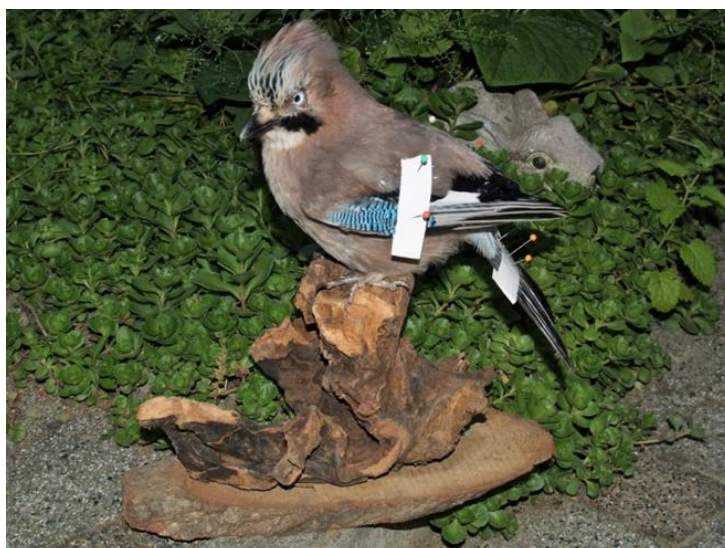
Slika 11. Završen dermo preparat postavljen na postolje