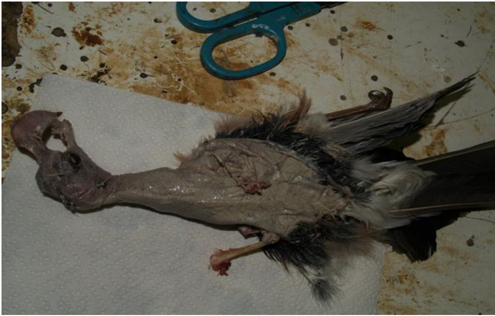
Slika 7. Konzerviranje kože

Vrlo je bitno da koža, kosti nogu i lubanje, krila, te korijeni perja budu dobro natopljeni s pripravkom jer se time postiže zaštita od insekata, bakterija i gljivica. Tim postupkom se i produljuje trajnost samog dermo preparata. Nakon završenog konzerviranja kožu je potrebno preokrenuti istim redoslijedom kojim je obrađivana. Zatim se koža polože na stol i nabiranjem se s obje ruke lubanja vraća sve dok se kljun ne pokaže na trbušnom otvoru. Time se postiže da lubanja ponovno bude vraćena u svoj prirodni položaj. Tradicionalnim načinom čišćenja i konzerviranja kože postiže se dugogodišnja trajnost dermo preparata. Suvremenim metodama i važnosti da vremensko razdoblje izrade bude što kraće gubi se trajnost koja je nekada bila najvažniji čimbenik uz sam izgleda dermo preparata.