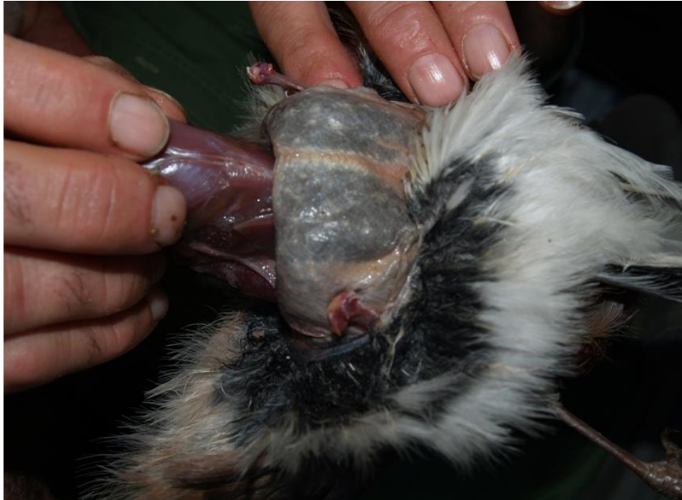
Slika 5. Guljenje kože

Usporedno skidamo kožu na donjoj strani lubanje dobro pazeći da koža kod kljuna ne popuca. Kada je od kože oslobođena lubanja, vrat se od lubanje odvoji rezom otprilike jedan centimetar od zatiljka. Tim rezom napravljen je otvor na lubanji koji će kasnije omogućiti lakše čišćenje lubanje. Dio odrezanog vrata od lubanje dodaje se ostatku vrata koji je ostao na tijelu, te se tako dobiva dužina cijelog vrata koju je potrebno zabilježiti kako bi se taj dio adekvatno mogao nadoknaditi s umjetno napravljenim vratom. Posebna pozornost je potrebna kod guljenja kože ptica plivačica (neke vrsta pataka i gusaka) jer je lubanja šira u odnosu na vrat pa prilikom izvlačenja lubanje kroz kožu vrata može doći do pucanja kože. Zbog toga za lakši rad potrebno je napraviti rez na području ispod kljuna ili na potiljku, dovoljne dužine da se kroz taj otvor glava može adekvatno izvući te u kasnijem procesu očistiti. U završnoj fazi izrade, pri montaži ptice taj rez šivamo ubodnim iglama i prekrivamo perjem čime postaje neprimjetan. Obradom glave završava faza guljena kože ptice te se daljnja obrada dermo preparata nastavlja fazom čišćenja i konzerviranja kože.