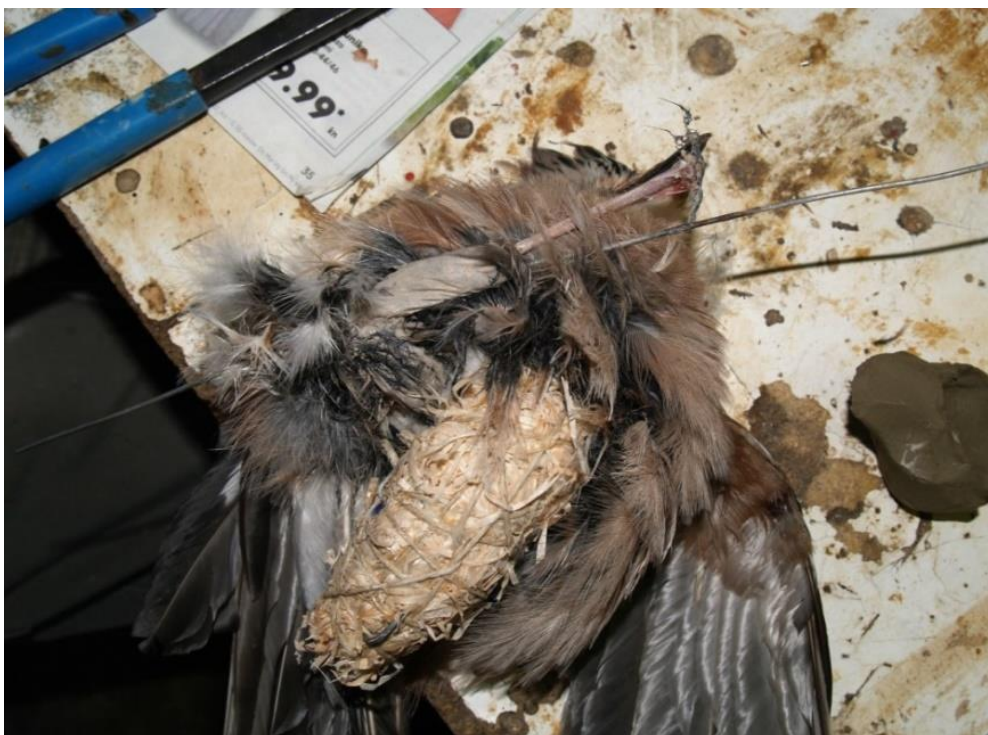
Slika 9. Uvođenje žica i umjetnog tijela