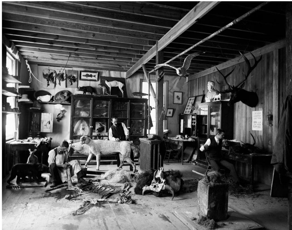
Slika 2. William T. Hornaday izrađuje dermo preparate

Kroz samu evoluciju i vrijeme izgubljene su mnoge životinjske vrste od kojih danas postoji samo fotografija ili dermo preparat, koji nam dočaravaju tu ljepotu koju smo trajno izgubili. O ulozi prepariranja u očuvanju bioraznolikosti svjedoči podatak iz 1880-ih godina kada je dr.sc. William Hornaday zoolog i glavni preparator Smithsonian muzeja, zgrožen masovnim pokoljem američkog bizona ( Bison bison ) odlučio prikupiti uzorke odstreljenih bizona koje je potom preparirao kako bi osvijestio javnost i političke dužnosnike u Washington D.C.-u na izrazitu biološku važnost opstanka američkog bizona radi očuvanja lokalnog, ali i globalnog ekosustava. Ukazao je na goruću problematiku istrebljenja vrste koja je stoljećima služila kao ishrana i izvorom alatki, odjeće i obuće domorocima američkog kontinenta. Svojim radom izravno je pridonio osnivanju saveznog zaštićenog područja ( Protected bison range ) za bizone na području nacionalnog parka Yellowstone. Skup tih aktivnosti je u konačnici rezultirao zdravom i stabilnom populacijom američkog bizona (CARR, 2017).