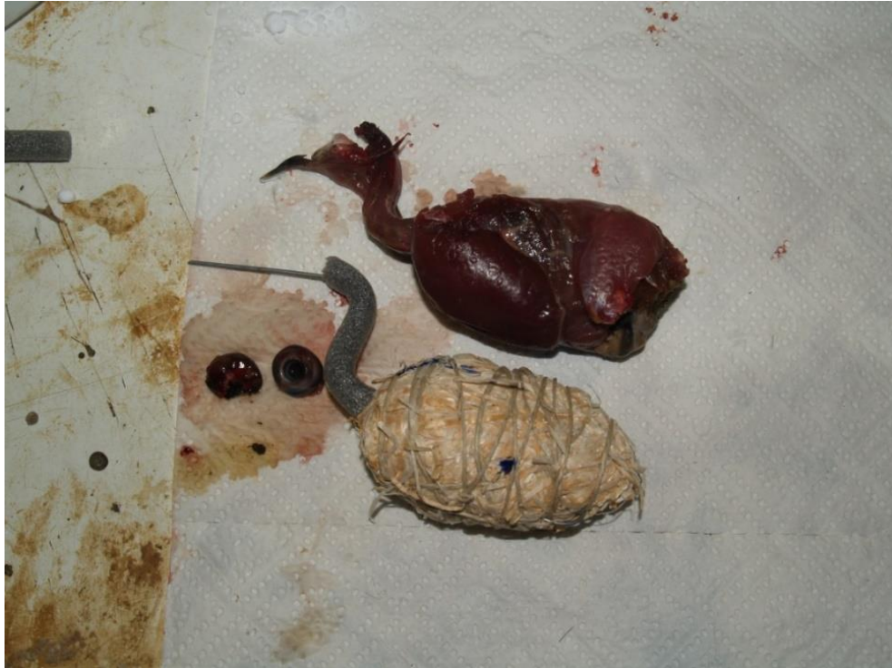
Slika 8. Izrada umjetnog tijela

Nakon što su svi dijelovi tijela sastavljeni, potrebno je pticu pažljivo pregledati, te provjeriti odgovaraju li veličina i oblik tijela, oblik i veličina glave, oblik krila i oblik nogu onome kako je ptica izgledala za života. Za kraj faze formiranja tijela potrebno je pomoću kudelje formirati gušu (volju) koja se namješta između vrata i tijela ptice. Kada je tijelo napravljeno točno prema veličini (izmjerama) prirodnog tijela, a vrat krila i noge točno namještene prema anatomiji ptice započinje šivanje kože. Prvo se šije rez koji je napravljen po sredini trbuha u fazi guljenja. Koža se šije tako da je udaljenost uboda od uboda otprilike 1 cm, pritom pazeći da ubod bude u rubu kože a nikako u koži gdje počinju folikuli trbušnih pera. Ako dođe do prolaska iglom kroz pero ono neće moći biti zaglađeno jer se vučenjem i zatezanjem konca poremeti njegov položaj. Nakon šivanja perje je potrebno rukom poravnati i pticu staviti u položaj u kojem je bila prije faze čišćenja, kada je napravljeno prvo mjerenje. Noge i krila potrebno je savinuti i staviti u prirodni položaj. Sadašnje mjerenje mora se poklapati sa prvim mjerenjem, a perje je potrebno zagladiti kako ptica ne bi izgledala "rašćupano". Ovime završava faza izrade umjetnog tijela dermo preparata.