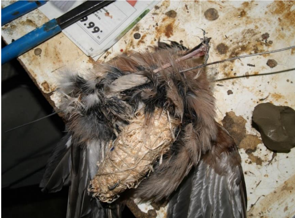
Slika 9. Uvođenje žica i umjetnog tijela