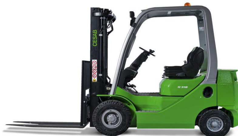
Slika 4 : Čeoni viličar

Čeoni viličari pogone se vlastitim motorom. U primjeni su elektroviličari koji se snabdijevaju strujom iz baterije (akumulatora) te viličari pogonjeni motorima s unutarnjim izgaranjem (diesel ili Otto motori). Uređaj za dizanje i spuštanje tereta (jarboli), zglobno je učvršćen na prednju stranu šasije viličara te se može nagibati naprijed ili nazad i time omogućuje zahvat i odlaganje tereta te stabiliziranje tereta na vilicama. Visina dizanja čeonog viličara u ovisnosti je od ugrađenog tipa uređaja za dizanje, a kod većine čeonih viličara ne prelazi 7 metara. Čeoni viličari izrađuju se za nosivosti od 5 do 800 kN. Upravljanje viličarom može biti izvedeno kao mehaničko ili hidrauličko te se ostvaruje zakretanjem zadnjeg upravljačkog kotača ili para kotača. Čeoni viličari izrađuju se s tri, četiri, šest ili osam kotača, u ovisnosti od namjene i nosivosti.