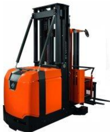
Slika 8 : Potezni viličar

Potezni viličar ili viličar s potiskivanjem, prihvaća teret izvan baze kotača i potiskivanjem vilica ili uređaja za dizanje, dovodi ga unutar baze kotača, te ga u tom položaju transportiraju. Pomicanje vilica ili uređaja za dizanje se vrši kontinuirano. Ovi viličari zahtijevaju uže radne prostore te imaju veću stabilnost od čeonih viličara. Za vrijeme transporta teret se pridržava na vilicama, a težina je jednoliko raspoređena na sve kotače.