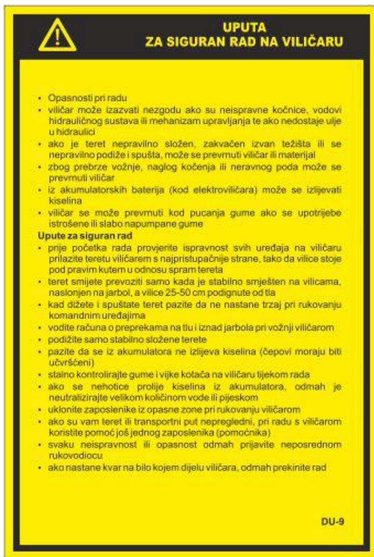
Slika 13: Uputa za siguran rad na viličaru