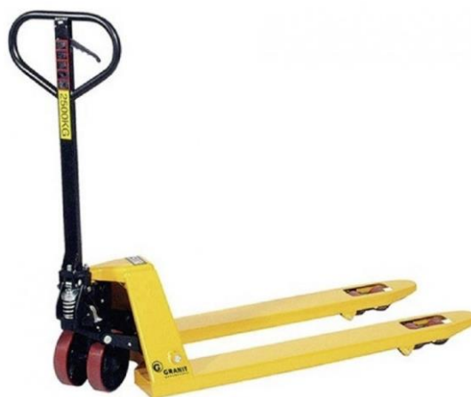
Slika 1: Ručni viličar

Ručni viličari upotrebljavaju se u skladištima za prijevoz paletizirane i komadne robe, pri istovaru kontejnera, pomorski, željezničkih, cestovni i zračnih prijevoznih sredstava. Ručni viličari služe za podni transport u uvjetima kada nije potrebno slaganje tereta u veće visine. Bitan dio ručnog viličara je vilica koja ulazi u otvore palete koju podižete s poda i prevozi na drugo prekrcajno mjesto. Sustav podizanja i spuštanja temelji se na hidrauličkom i mehaničkom principu. Znatno bolji je hidraulički sustav podizanja i spuštanja vilice, što i potvrđuje činjenica da se ovakvi viličari nalaze u širokoj primjeni. Ovi viličari služe isključivo za prijevoz paletiziranog materijala, standardnih izvedbi za težine do 26 kN. Visina dizanja tereta je minimalna, samo za omogućavanje transporta, iznosi od 10 do 20 cm.