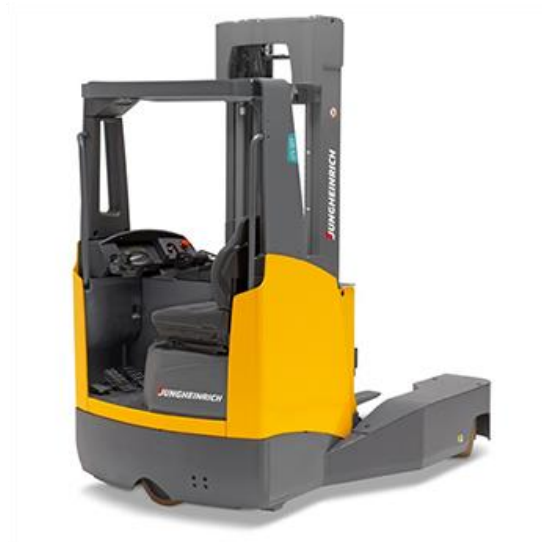
Slika 6 : Regalni viličar