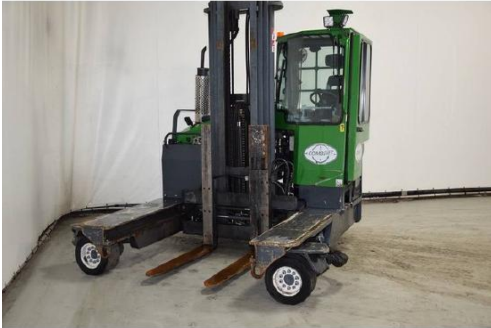
Slika 5 : Bočni viličar

Bočni viličar je vrlo dobro prihvaćen u drvenoj industriji, čeličanim, no nije isključena mogućnost i njegove šire primjene. Bočni viličar uzima teret bočno, pomoću uređaja za podizanje koji se bočno izvlači. Teret se odlaže na platformu viličara po dužini u smjeru kretanja, što omogućuje korištenje uskih prometnica.