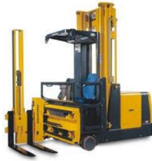
Slika 9 : Viličar sa zakretnim vilicama