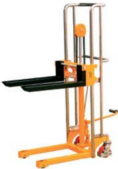
Slika 2 :Viskopodizni ručni viličar

Viskopodizni ručni viličari za razliku od običnih ručnih viličara mogu podizati teret na visinu do 3,5 m. Zajedničko im je to što se obe vrste viličara pokreću ljudskom snagom, iako je kod viskopodiznog ručnog viličara, izvedba koju pokreće ljudska snaga najjednostavnija. Postoji izvedba i s elektromotorom, ali takva vrsta se može kategorizirati kao motorni ručni viličar. Ova vrsta viličara je dosta raširena jer je relativno jeftina i praktična za korištenje.