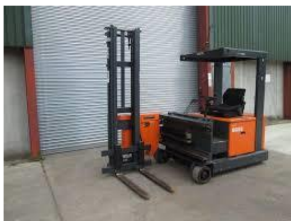
Slika 7 : Četverostrani viličar

Četverostrani viličari imaju mogućnost kretanja u četiri smjera zbog specijalne izvedbe kotača. Pogonski agregati su električni u svim izvedbama. Napredak tehničko-tehnoloških rješenja u ovoj skupini viličara znatno dolazi do izražaja budući da je i izvedba kotača koji se mogu kontrolirano okretati za puni krug oko vertikalne osi inovacija. Ovi viličari su namijenjeni za rad u zatvorenim skladištima sa vrlo uskim prolazima širine manje od 1,8 m, iako postoje i izvedbe za skladišta sa uskim prolazima. Inovacija okretanja kotača oko svoje vertikalne osi slična je i izvedbi bočnih i regalnih viličara, te je vidljivo da se radi o trendu u porastu.