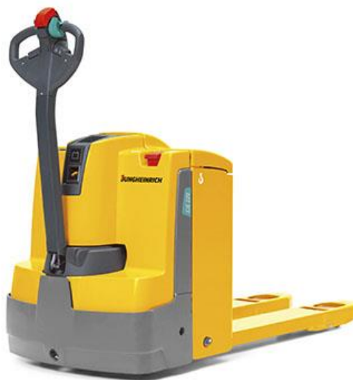
Slika 3 : Motorni ručni viličar

teleskopom pomoću kojih se paletizirana roba može podizati u visinu i iznad 3 metra. Nosivost ovih viličara se kreće od 5 do 30 kN.