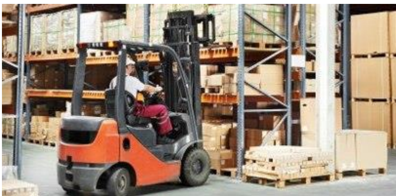
Slika 11: Manipulacija teretom u skladišnom prostoru

Skladišta mogu raspolagati različitim dimenzijama i različitim rasporedima regala. Ovisno o rasporedu regala te njegovim karakteristikama kao što su visina regala, dubina, razmak između regala ovisi vrsta viličara koja će se koristiti. U skladištima koja imaju uske prolaze između regala prikladno bi bilo koristiti viličare koji imaju posebne značajke kao što su bočni viličari ili viličari sa zakretnim vilicama. Svrha skladišta sa uskim prolazima između regala je da što bolje iskoriste prostor.