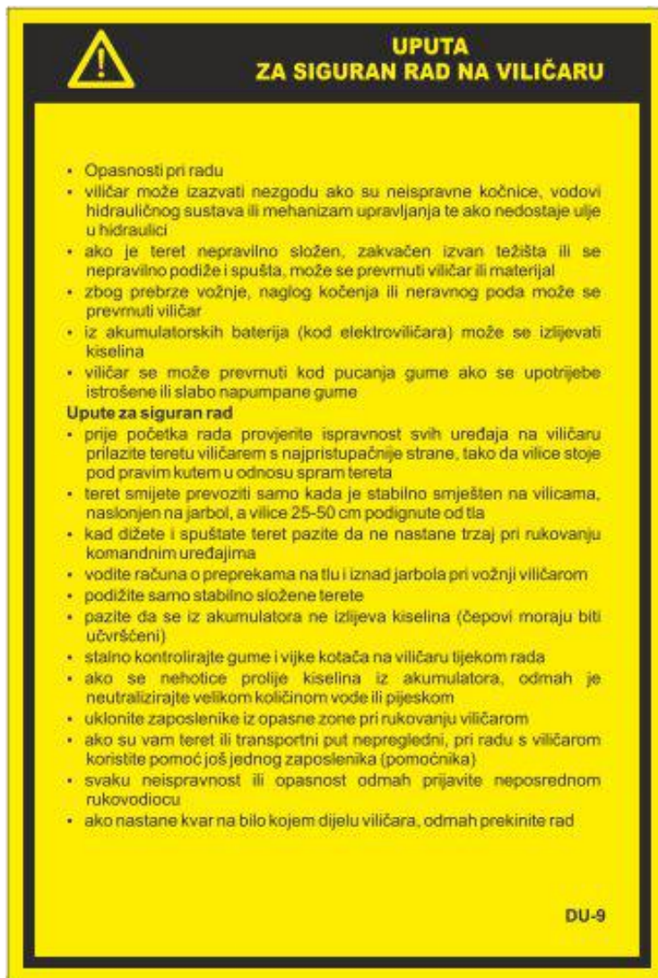
Slika 13: Uputa za siguran rad na viličaru