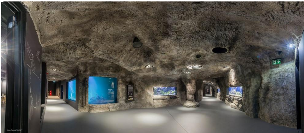
Slika 13. Unutrašnjost Aquatike