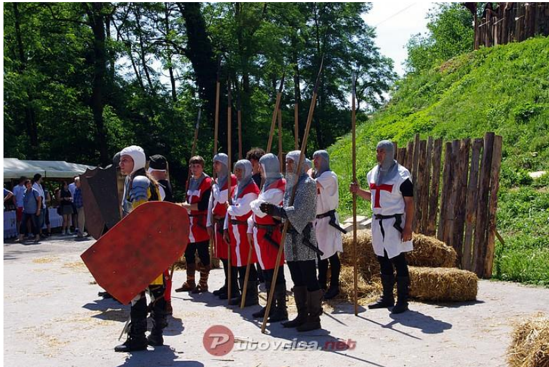
Slika 10. Sajam Vlastelinstva na Starom gradu Dubovcu