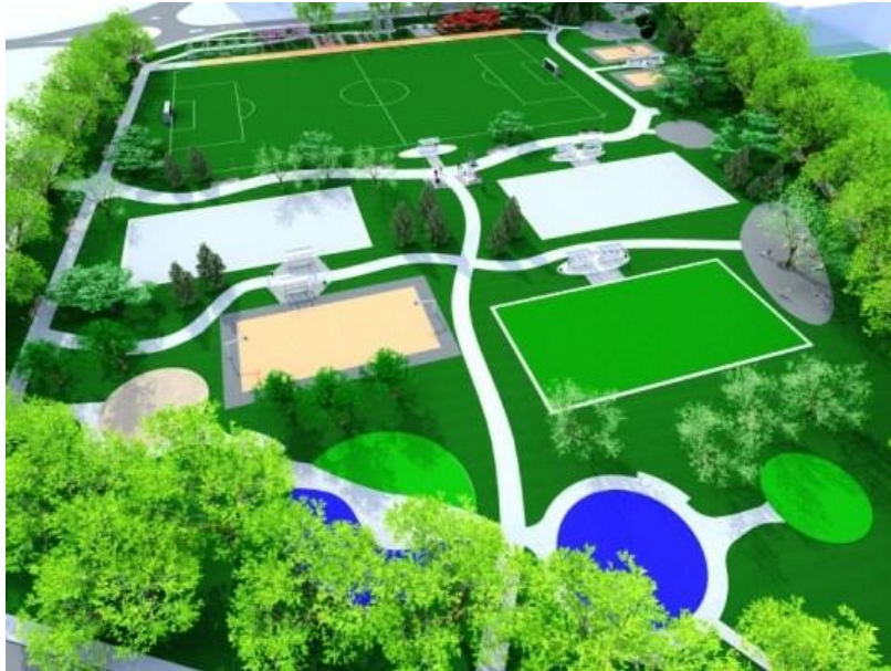
Slika 7. Plan preuređenja Vunskog polja