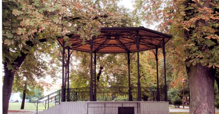
Slika 6. Glazbeni paviljon u Šetalištu dr. Franje Tuđmana