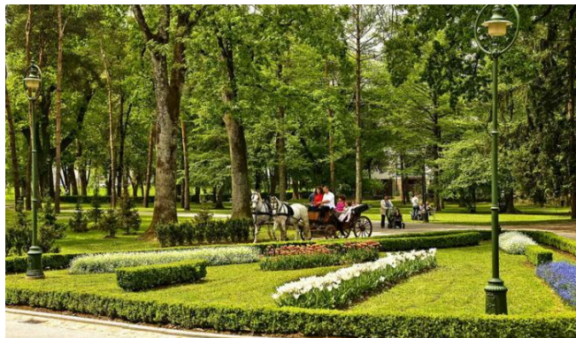
Slika 4. Vrbanićev perivoj