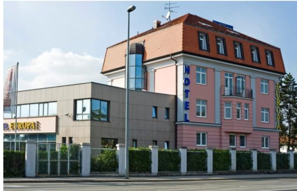
Slika 15. Hotel Europa