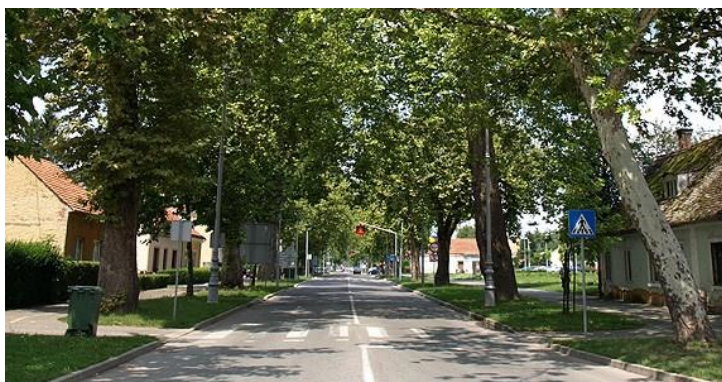
Slika 5. Marmontova aleja na Dubovcu