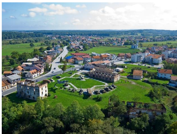
Slika 12. Muzej Domovinskog rata na Turnju

Ratna zbivanja u Domovinskom ratu potvrdila su Turanj kao predstražu Karlovaca. Na Turnju su 90-ih godina prošlog stoljeća hrvatski branitelji slomili agresorske pokušaje da se zauzme grad Karlovac, tu su se vodili mnogi pregovori o uspostavljanju primirja, razmjenjivali zarobljenici, prihvaćali izbjeglice i prognanici. Turanj je simbol pobjede, povratka i novog života na ratom opustošenom području.