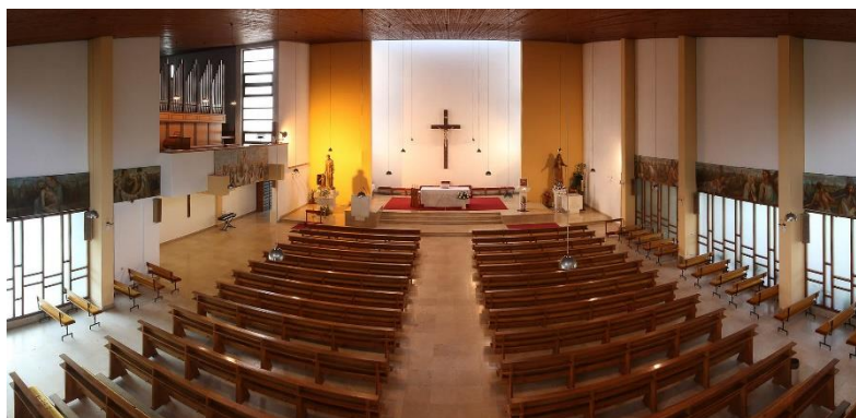
Slika 11. Unutrašnjost crkve sv. Josipa na Dubovcu