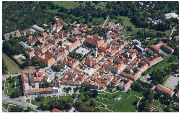
Slika 1. Karlovac