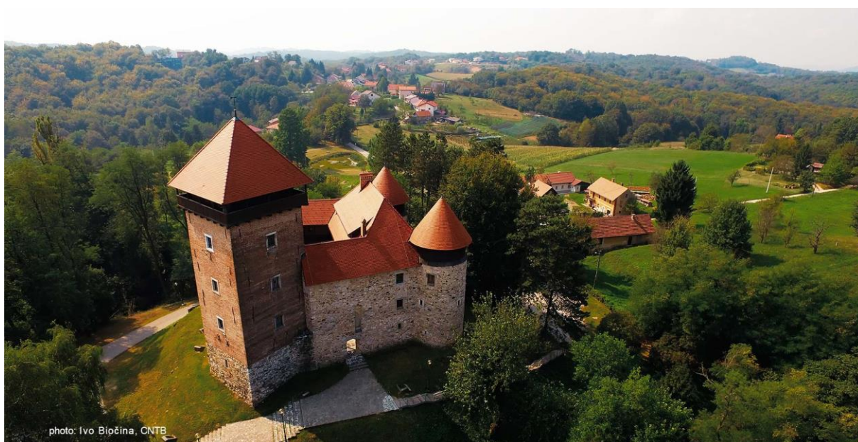
Slika 9. Stari grad Dubovac