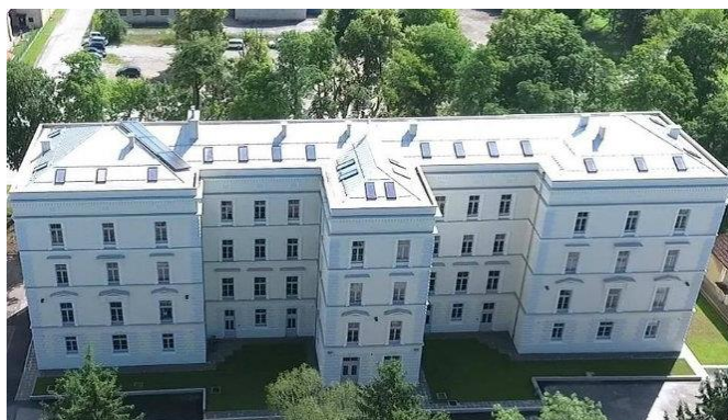
Slika 16. Hostel Bedem u Karlovačkoj Zvijezdi