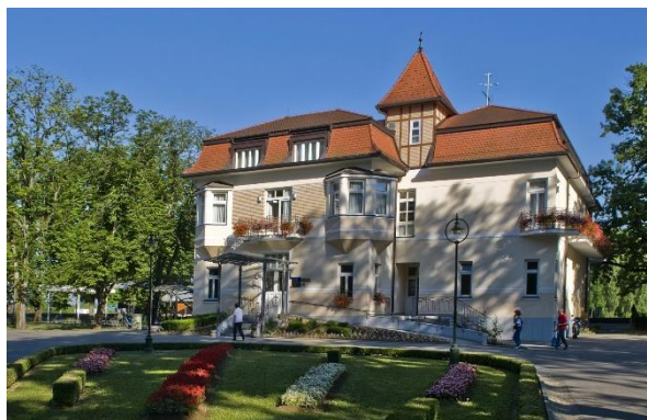
Slika 14. Hotel Srakovčić na Korani