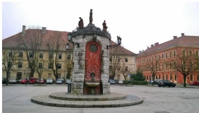
Slika 8. Zdenac na Trgu bana Josipa Jelačića u Zvijezdi