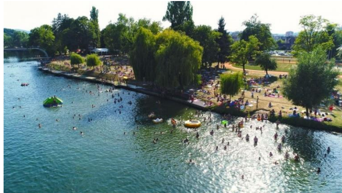
Slika 2. Figinovo kupalište na Korani