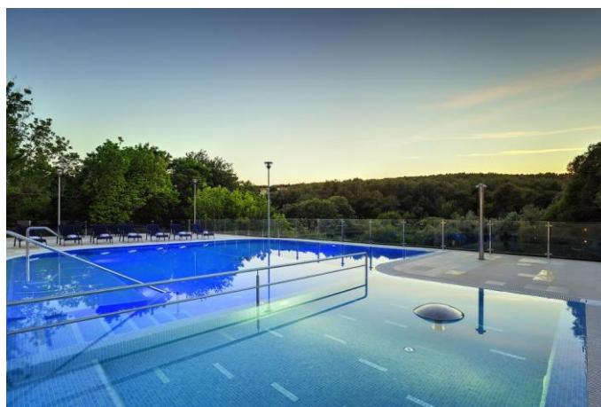
Slika 11. Vanjski bazen

Izvor: Booking.com; https://www.booking.com/hotel/hr/premantura-resort.hr.html (22.09.2018.)