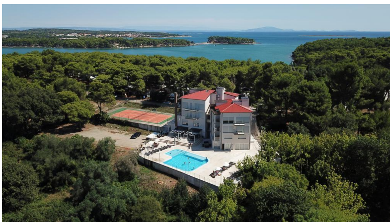
Slika 12. Prikaz teniskog igrališta i bazena hotela