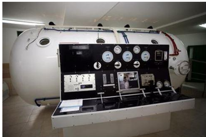
Slika 4. Prikaz hiperbarične komore

U ronjenju su znanje i vještine prve pomoći obavezni za voditelje i instruktore, a prilike za svladavanje znanja iz prve pomoći imaju i oni koji polaze osnovne i specijalističke ronilačke tečajeve. Važno je prepoznavanje različitih znakova i simptoma ozljeda i oboljenja. Prva pomoć se pruža tijekom izrona, na površini, te na brodici ili obali na način da se unesrećenom ronioncu pruži 100% čisti kisik. 46 Hiperbarična komora je osnovni složeni pogon koji se koristi u podvodnoj medicini, a služi nam kako bi na „umjetan“ način stvorili uvjete boravka čovjeka pod tlakom. Može nam poslužiti za različite namjene. Dije se na prijenosne i stacionarne hiperbarične komore. 47