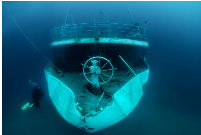
Slika 13. Prikaz potopljenog admiralskog broda „Vis“