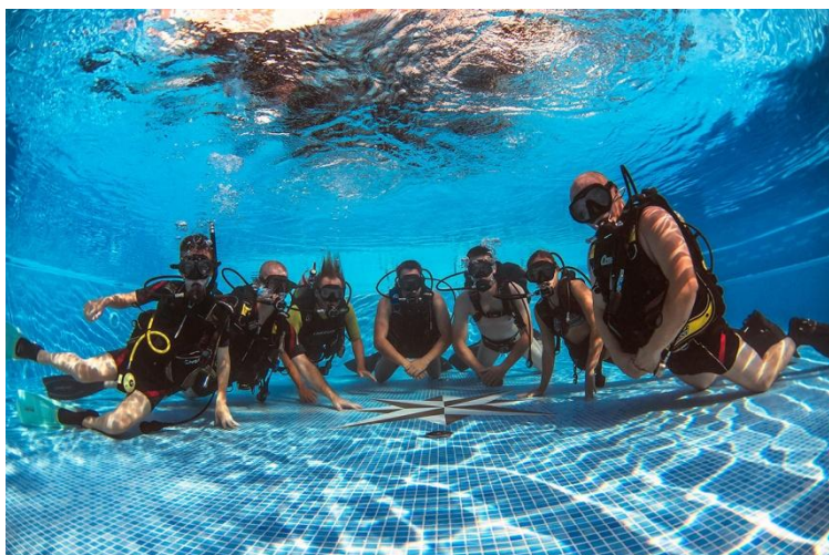
Slika 10. Ronilačke vježbe u bazenu