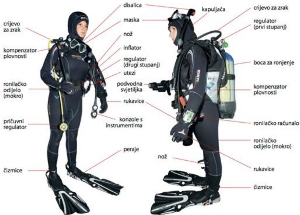
Slika 3. Detaljni prikaz ronilačke opreme