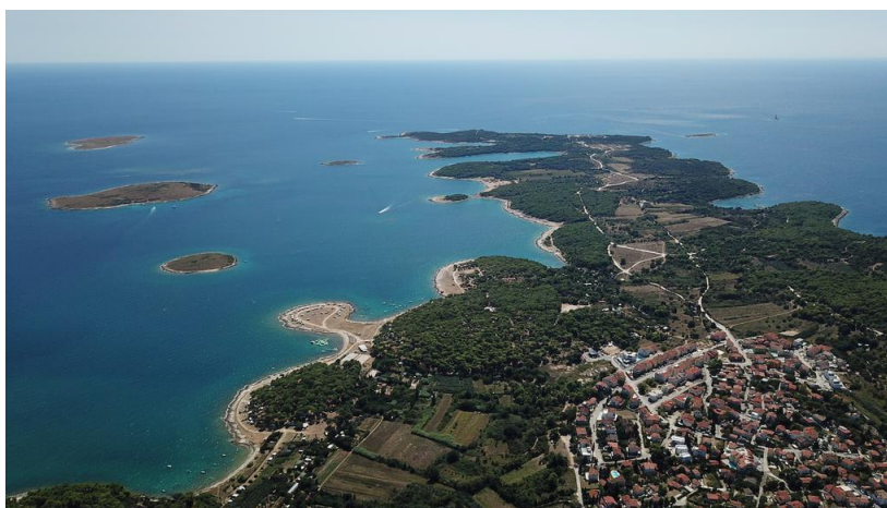
Slika 6. Premantura