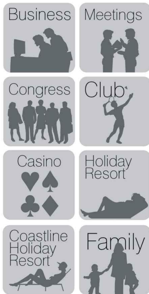
Slika 1. Primjer grafičkih rješenja ploča za označavanje nekih od posebnih hotelskih standarda