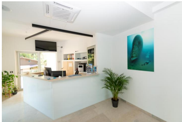
Slika 7. Recepcija hotela