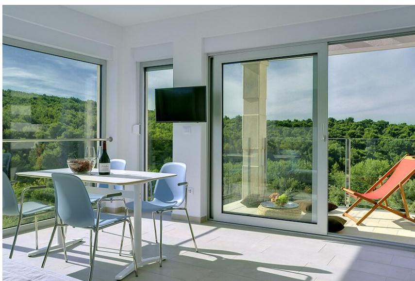
Slika 9. Premium apartman