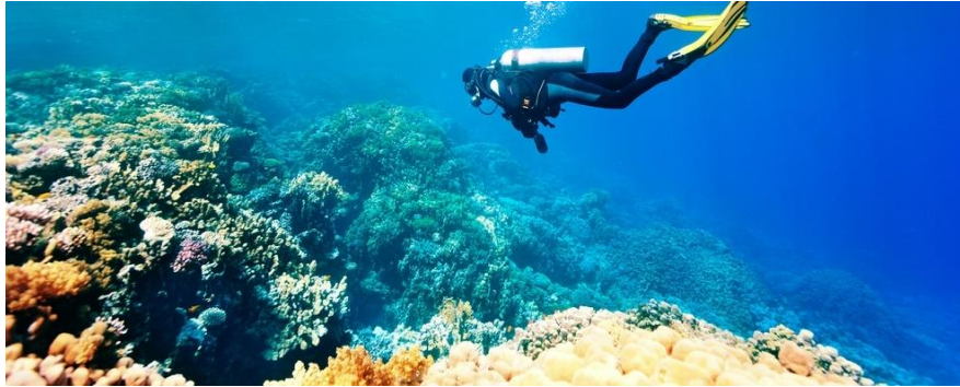
Slika 2. Prikaz ronioca u podmorju