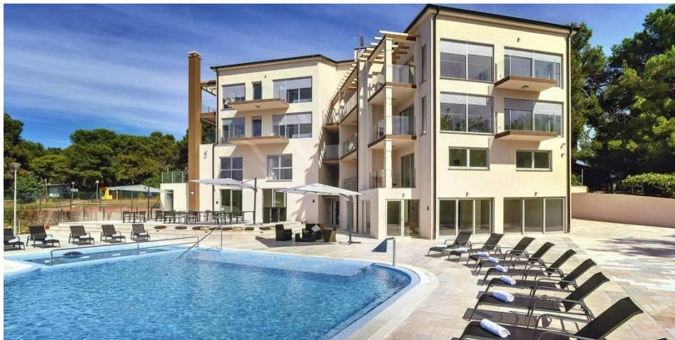
Slika 5. Hotel Premantura Resort