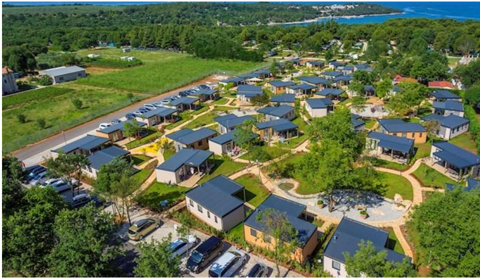
Slika 1.: Kamp naselje

Izvor: Valamar-riviera, www.valamar-riviera.com (14.08.2018.)