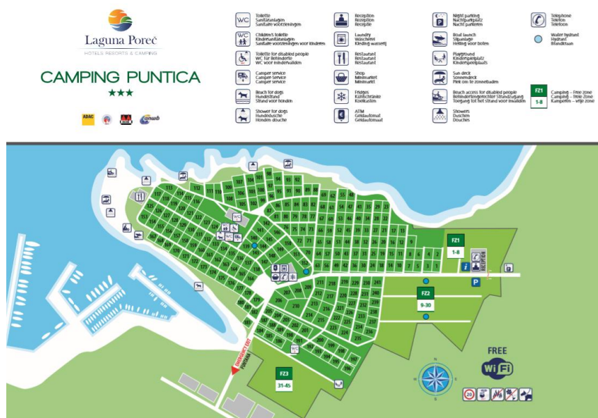
Slika 9.: Plan kampa „Puntica“