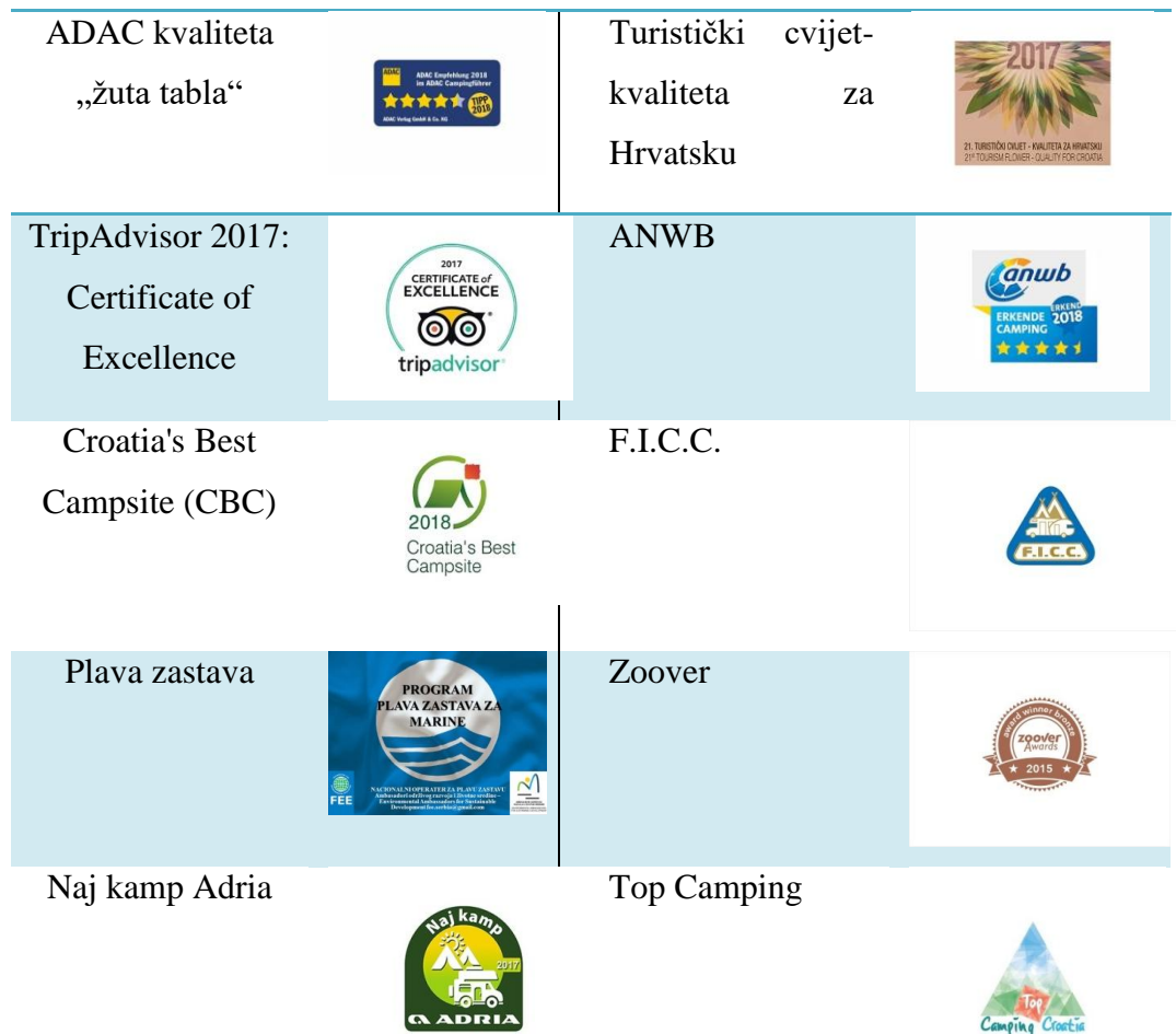
Tablica 7.: Nagrade i priznanja kampa „Bijela Uvala“