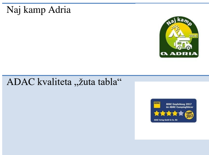
Tablica 15.: Nagrade i priznanja kampa „Puntica“