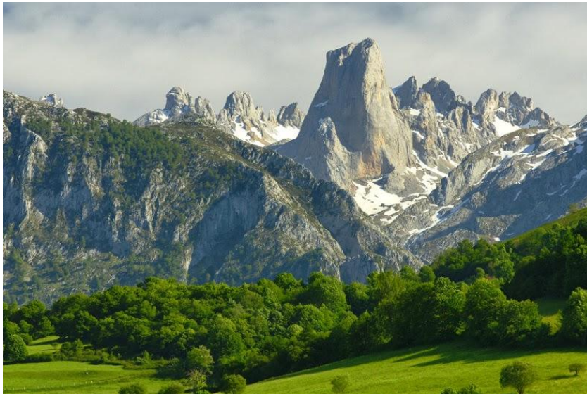
Slika 9. Picos de Europa

Izvor: BttW, www.backtothewildpct.blogspot.hr , (26.5.2018.)