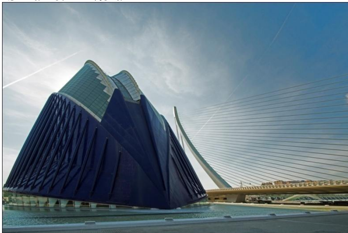
Slika 26. L'Àgora

L'Àgora je metalna građevina s tlocrtom nalik na šiljastu elipsu dužine 88 i širine 66 metara i 4811 četvornih metara natkrivenog prostora. Ovaj veliki unutarnji prostor zamišljen je kao natkriven javni trg s otvorenim tlocrtom na razini sa susjednim jezerima. Učvršćen krov, koji kada je zatvoren doseže maksimalnu visinu od 70 metara, bit će prekriven staklenim panelima, a donji dio sa zamučenim pločama. 27