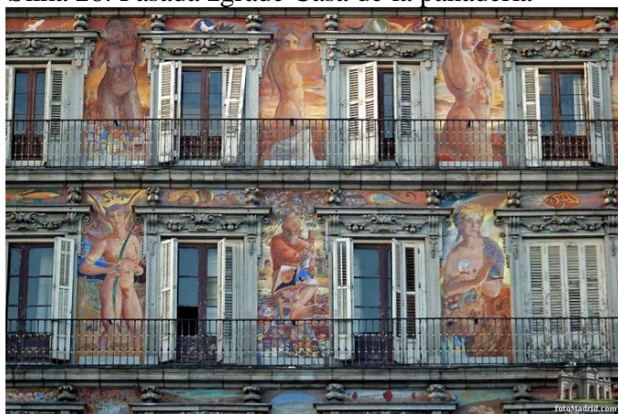
Slika 28. Fasada zgrade Casa de la panaderia