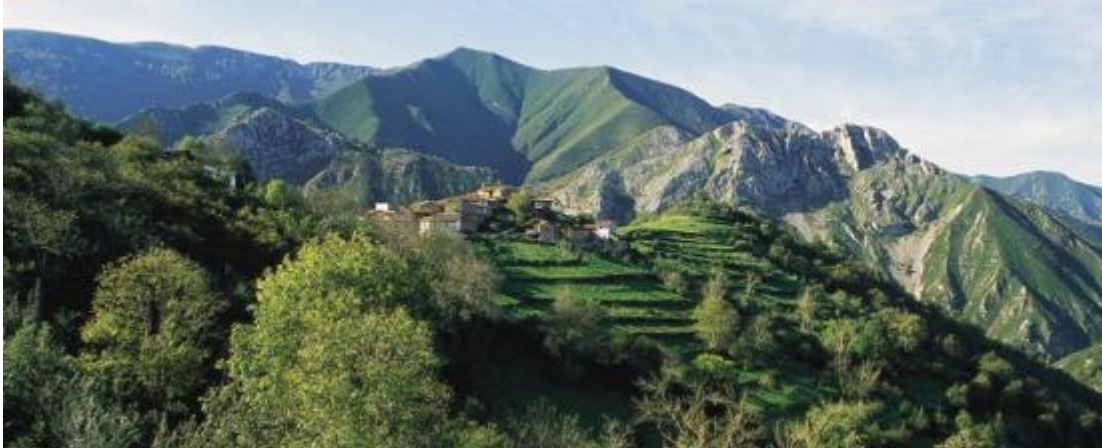
Slika 10. Selo u planinama