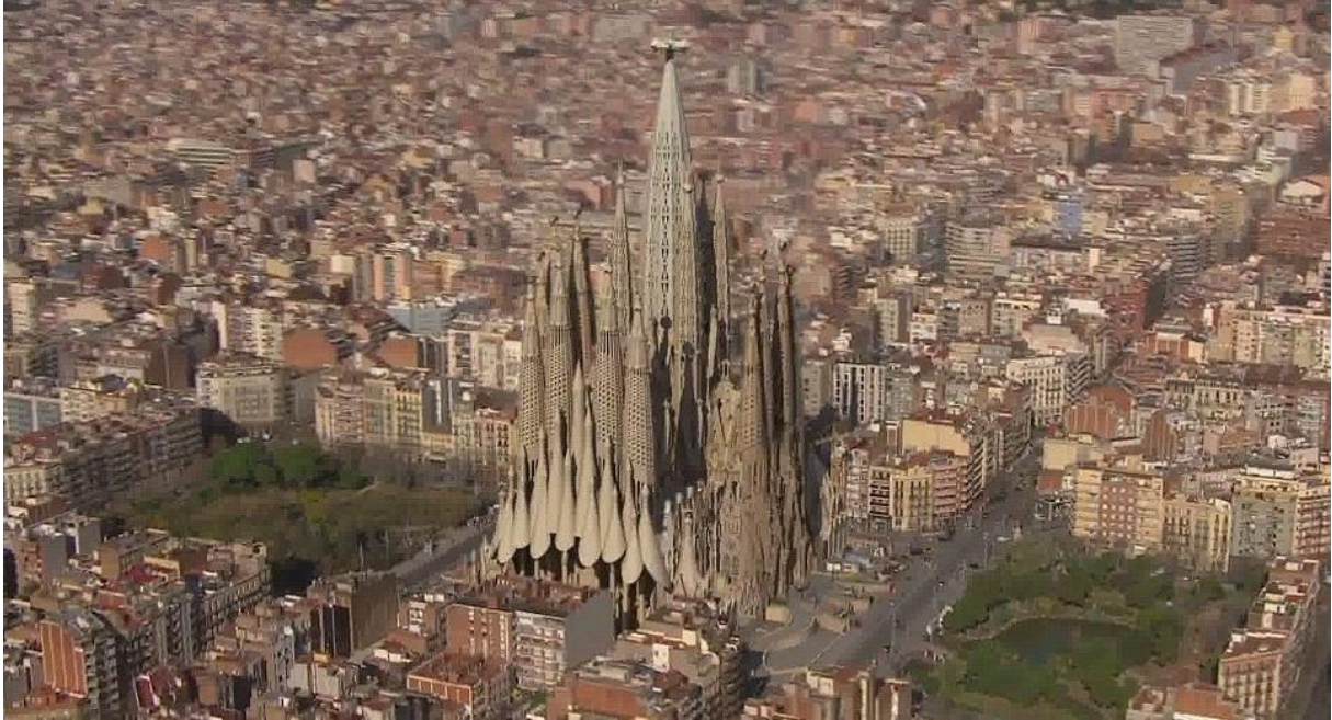
Slika 19. Prikaz dovršene Sagrade Familije