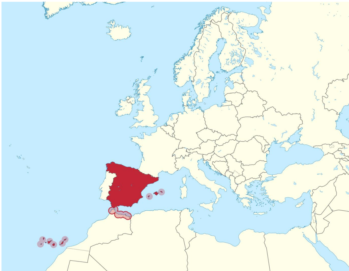
Slika 1. Španjolska na karti Europe