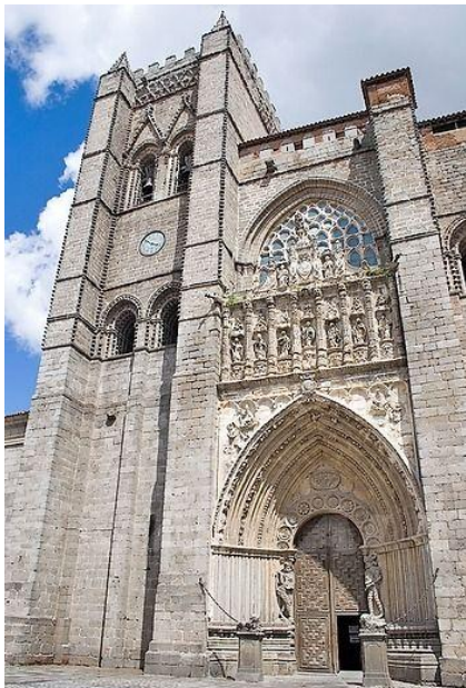
Slika 31. Avilska katedrala