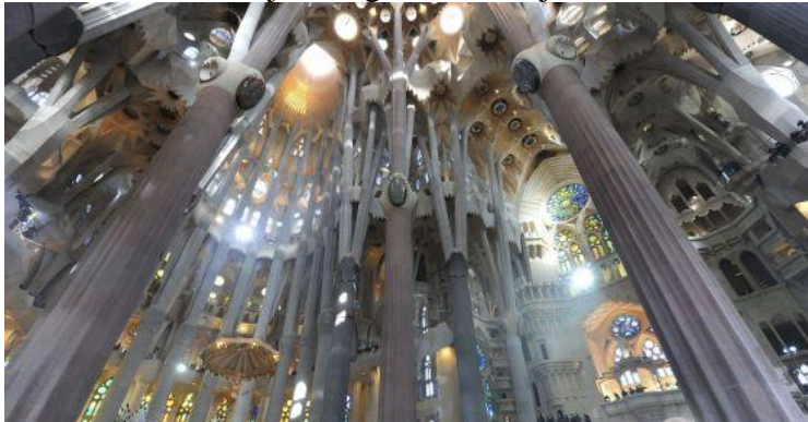
Slika 18. Unutrašnjost Sagrade Familije

Gaudi je inspiraciju pronalazio u prirodi te iz tog razloga nije volio ravne linije jer ih, kako je rekao, u prirodi nema. Stoga se ne treba čuditi kada se unutar crkve pogleda gore i dobije osjećaj kao da se nalazimo pod krošnjom drveća. Stupovi