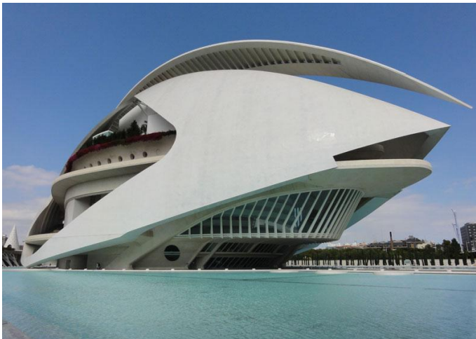
Slika 24. Palau de les Arts Reina Sofia