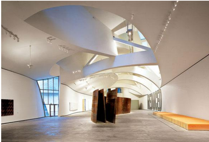
Slika 8. Unutrašnjost muzeia