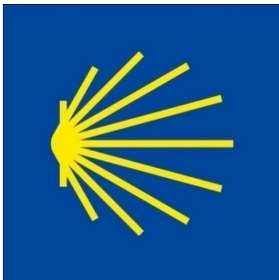
Slika 3. Simbol Puta sv. Jakova

Na sjeverozapadu Španjolske, u autonomnoj zajednici Galiciji nalazi se grad Santiago de Compostela čiji je stari dio grada UNSECO 1985. godine uvrstio na popis svjetske kulturne baštine a 2000. godine proglašen europskim gradom kulture. Santiago je poznato hodočasničko mjesto odnosno završno odredište na Putu sv. Jakova.