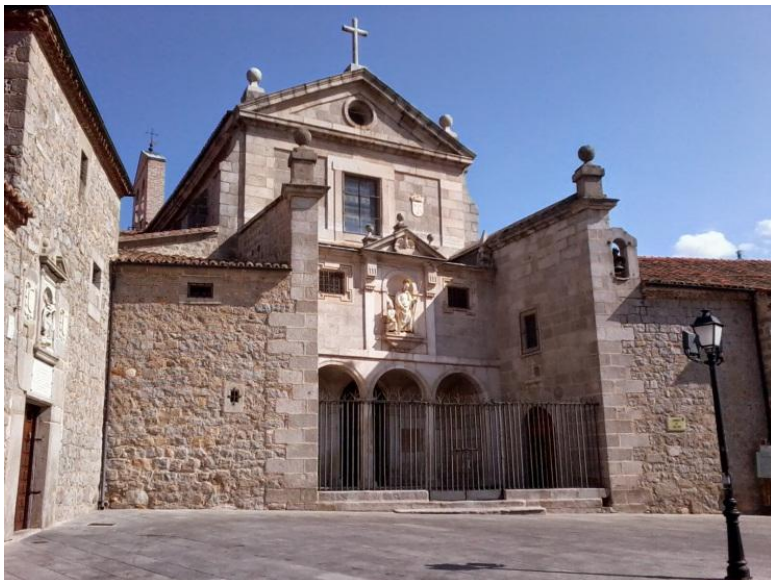
Slika 33. Samostan San José

Samostan San José izgrađen je 1562. g. pored male crkve koja je kasnije srušena i na čijem je mjestu izgrađena arhitekt Francisco de Mora izgradio novu 1607. 1968. godine proglašen je nacionalnim spomenikom.