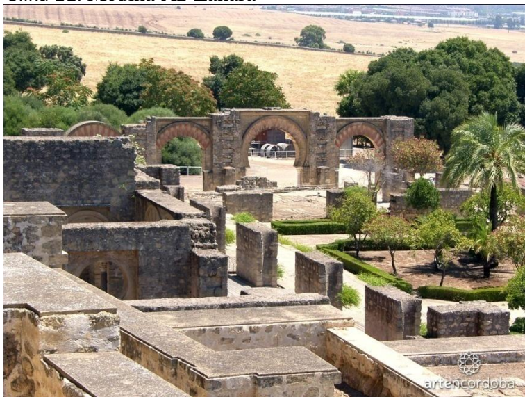
Slika 11. Medina Az-Zahara