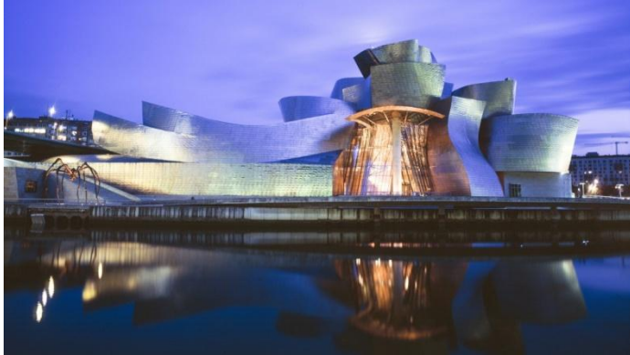
Slika 7. Guggenheim muzej u Bilbao

Izvor: GMAF, www.guggenheim.org , (6.5.2018.)