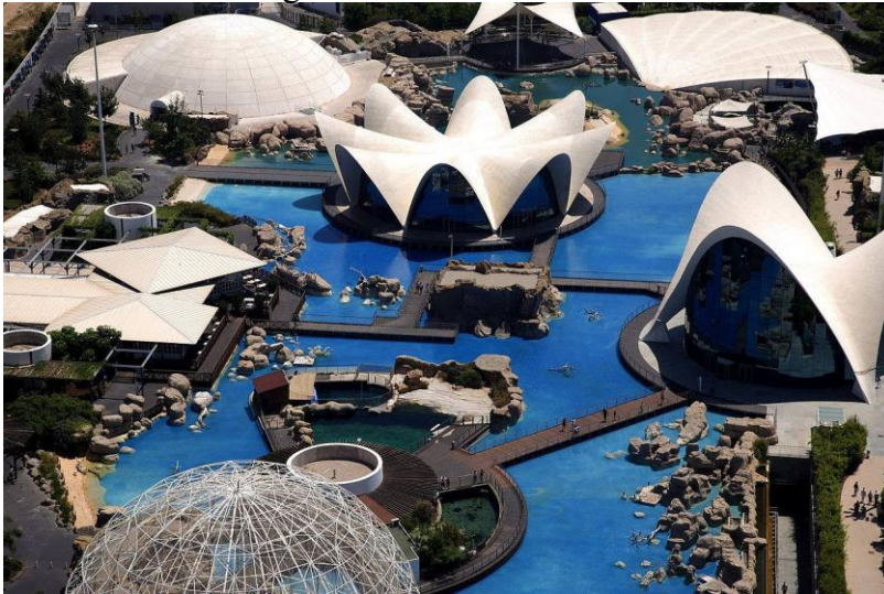
Slika 23. L'Océanogràfic