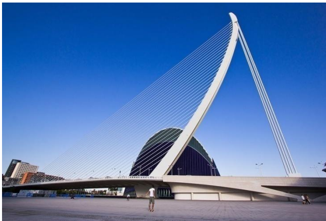
Slika 25. Most Serreria

Smješten na najistočnijem rubu Grada umjetnosti i znanosti, most Serreria visi sa nagnutog pilona izgrađenog na južnom kraju. Dužine je 180 metara a širinom varira od 35.5 do 39.2 metra. Pilon je visok 118.6 metara što ovaj most čini najvišom točkom u gradu. 26