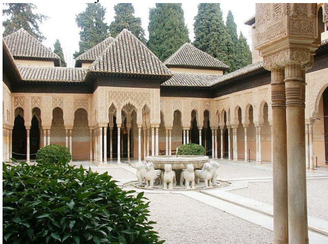
Slika 14. Lavlje dvorište