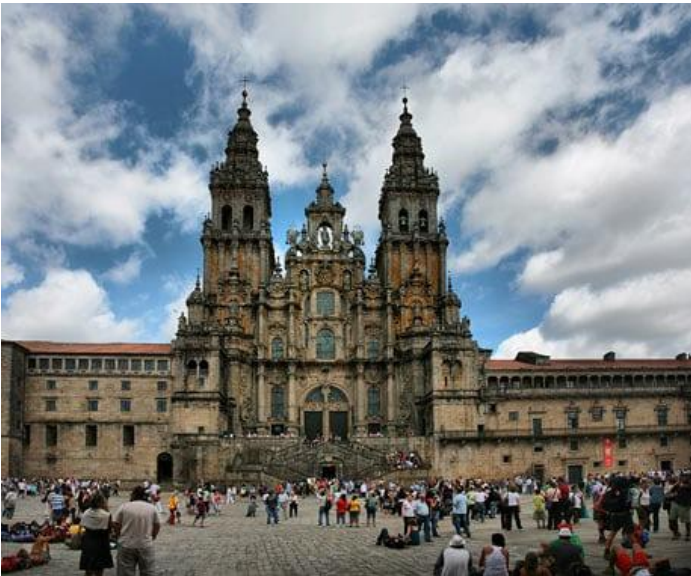
Slika 5. Katedrala sv. Jakova