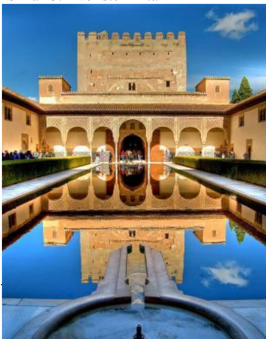
Slika 13. Dvorište Mirta

Alhambra u Granadi maurska je inačica islamske palače izgrađene oko nekoliko dvorišta, s fontanama, bazenima i sjenovitim kolonadama filigranske ornamentike, s najljepšim vrtom Generalife, s vodama koje „pjevuju i plešu“, s čempresima i mirtom, irisom i ružama, te „mirador“ – pogledom na udaljene brežuljke. Stijene interijera sjaje od perzijskih „čilima i kašmirskih šalova“, na čudo putnicima i očaj pjesnicima. Nalazimo poseban spoj zapletenoga,