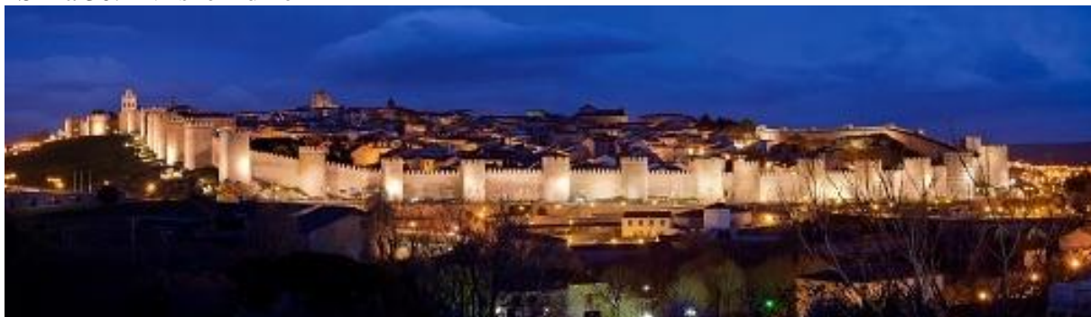
Slika 30. Avilske zidine