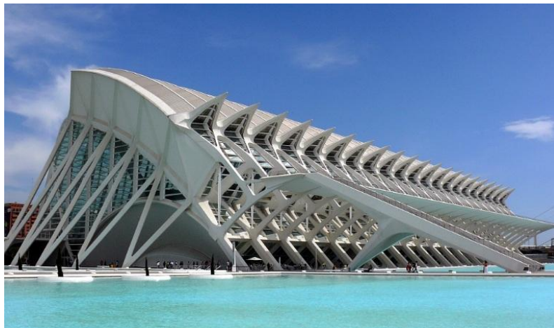
Slika 21. Museu de les Ciències Príncipe Felipe