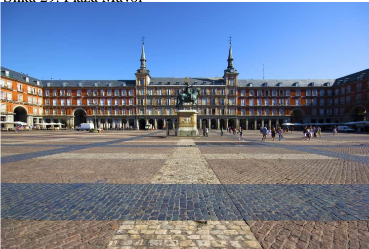
Slika 29. Plaza Mayor