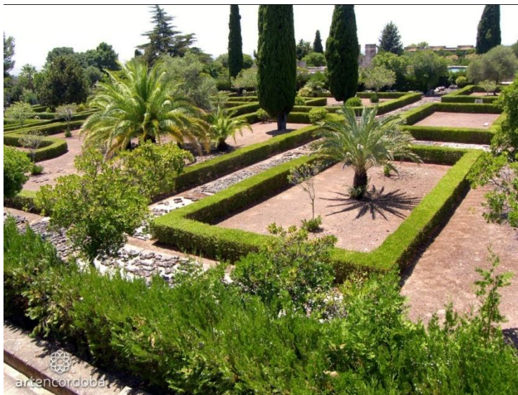
Slika 12. Medina Az-Zahra

Od brojnih fontana, najviše se isticala jedna od zelenog mramora s ukrasima od zlata i dragog kamenja. Ljubav prema prelijepoj Az-Zahri (=cvijet) potaknula je kalifa na izgradnju poetskoga pothvata istočnjačkog sjaja i odabrana ukusa u sretnoj klimi pod vedrim i veselim nebom. 16