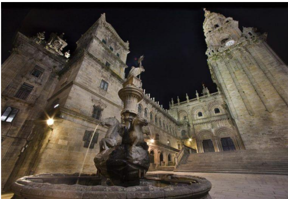
Slika 6. Fasada Platerías