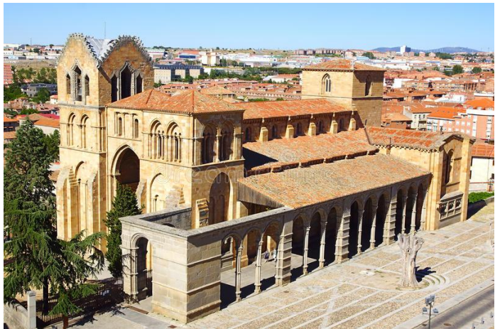
Slika 32. Bazilika sv. Vinceta

12. st. i izgrađena je većinom u romaničkom stilu. Posebno ćete cijeniti portale iz 12. st. i trijem bazilike koji su sjajni primjeri romaničke arhitekture. Unutrašnjost je također romanička ali sa nekoliko kasnijih dopuna. Za vidjeti tu je također i grobnica sv. Vinceta na kojoj su isklesani krvavi događaji svečevog mučenja i pogubljenja a u kripti se nalazi kamen za kojeg se smatra da je sa mjesta mučenja i gdje se pojavila zmija. 38