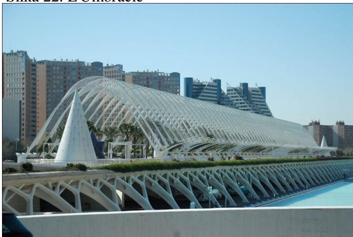
Slika 22. L'Umbracle