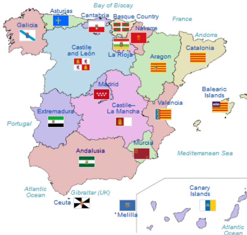
Slika 2. Španjolske autonomne zajednice