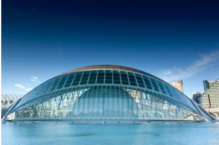
Slika 20. L'Hemisfèric

Izvor: DP, www.dphotographer.co.uk , (24.5.2018.)