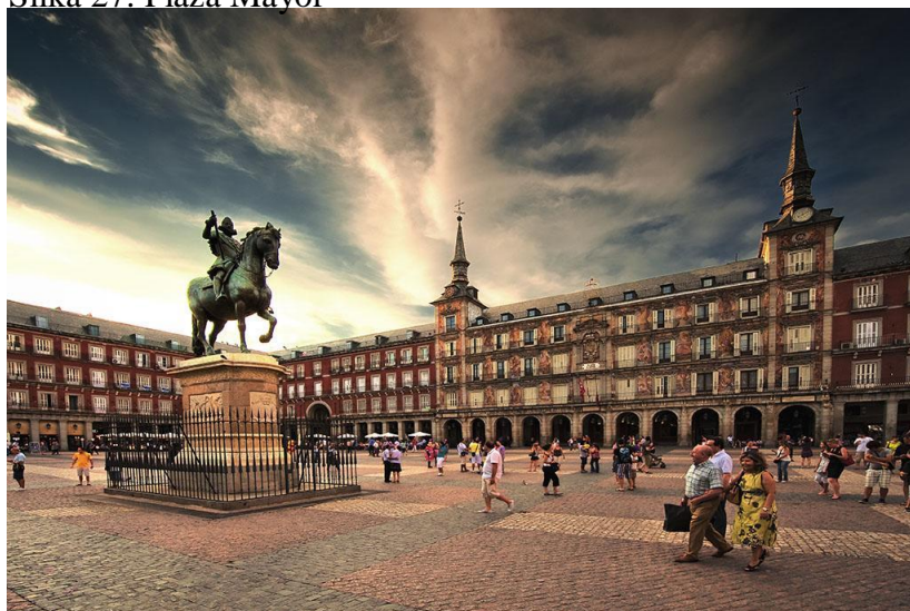
Slika 27. Plaza Mayor