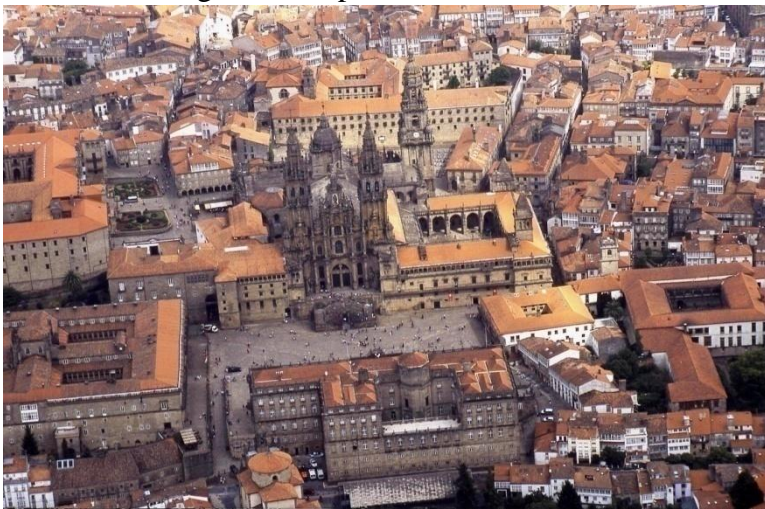
Slika 4. Santiago de Compostela

Tijekom srednjeg vijeka, pa i danas, Santiago de Compostela je, nakon Jeruzalema i Rima, najvažnije kršćansko mjesto hodočašća. Razlog tomu je, naravno, Put sv. Jakova kojim svake godine preko stotine tisuća vjernika hodočasti do grobnice sv. Jakova, Isusovog apostola čije su relikvije pronađene 813. godine u Santiagu gdje je u njegovu čast sagrađena i katedrala.