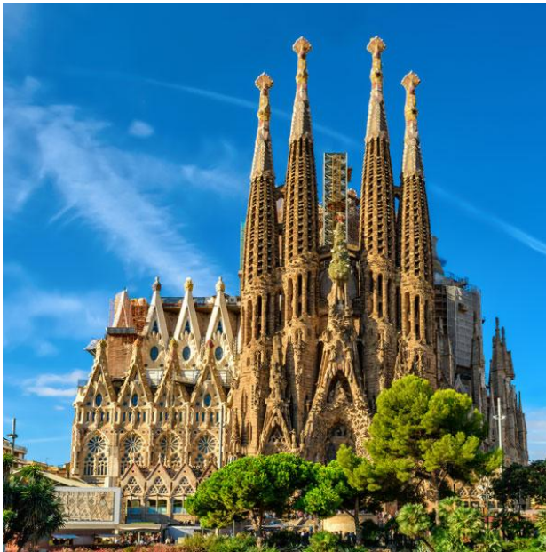
Slika 16. Sagrada Familia

Josipu zagovaralo izgradnju hrama posvećenog svetoj obitelji. Zahvaljujući raznim donacijama, 1881., društvo je kupilo zemljište između ulica Marina, Provença, Sardenya i Mallorca na kojem će uskoro početi izgradnja