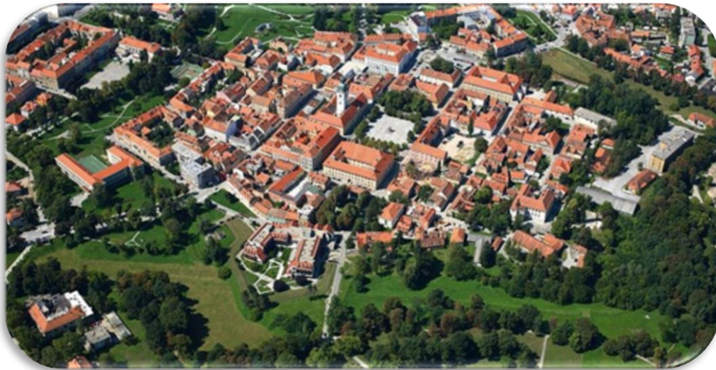
Slika 1. Grad Karlovac (Karlovačka zvijezda)

Izvor: Grad Karlovac, www.karlovac.hr/grad/zvijezda-93/93 (09.03.2018.)