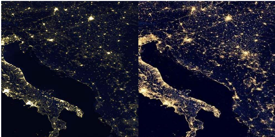
Slika 5. Svjetlosno onečišćenje