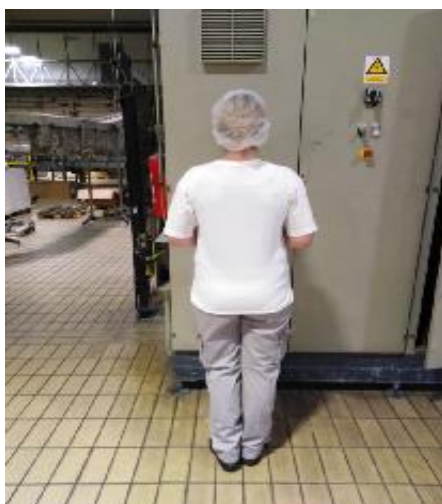
Slika 8. Radno odijelo proizvodnog radnika u ljeti

U periodu zime djelatnici rukovatelji strojem na proizvodnoj liniji koriste visokokvalitetnu flis radnu jaknu(slika 9.) od 100% poliestera koja je crne boje, majicu bijelu pamučnu, te treger radne zaštitne hlače.