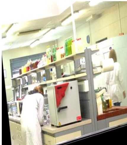
Slika 26. Zaštitna laboratorijska kuta

Zaštitne bijele kute(slika 26.) koriste se kao radno odijelo u laboratorijima. Namijenjene su samo kao sredstvo za zaštitu od prašine i raznih prljavština pri obavljanju poslova. Materijal je od 100% pamuka i strukiranog je kroja, te ima dva bočna džepa . Tijekom ljetnog i zimskog perioda koriste se kute dugih rukava.