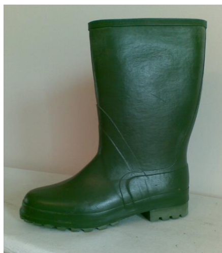
Slika 16. Zaštitne gumene čizme

Serviser u pripremi je radno mjesto radno mjesto s posebnim uvjetima rada radne stoga prilikom ručnog pretakanja kiselina koriste je gumene čizme, koje također koriste u pripremi tehnoloških voda. Čizme su od poliuretana, i zelene su boje(slika 16.). Konstrukcija čizmi osigurava sigurnu manipulaciju i ergonomsku prihvatljivost bez posebnih dodataka. Podstava je izrađena iz flisa od prirodnih i sintetičkih vlakana. Potplat je izrađen zajedno sa petama te je otporna na kemijske postupke