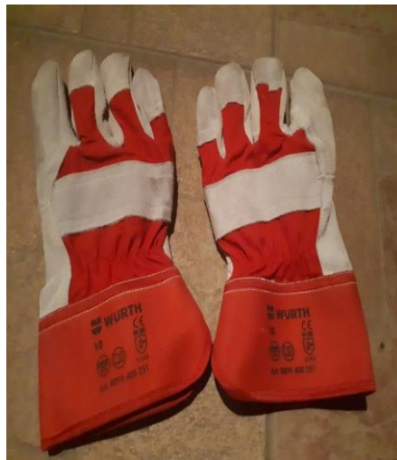
Slika 17. Kožne rukavice

Rukavice se koriste i za rad sa metalima, za popravke, montaže i održavanja jer su prikladne za rad u vlažnim uvjetima.