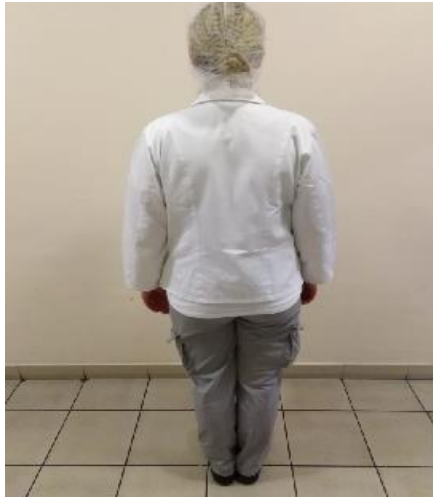
Slika 11. Radno odijelo kontrolora proizvoda

Također, tijekom hladnijeg perioda koriste kao i svi zaposlenici zaštitni radni prsluk koji je plave boje.