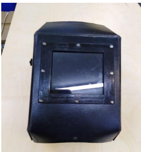
Slika 24. Naglavni štitnik sa zaštitnim staklom za zavarivanje