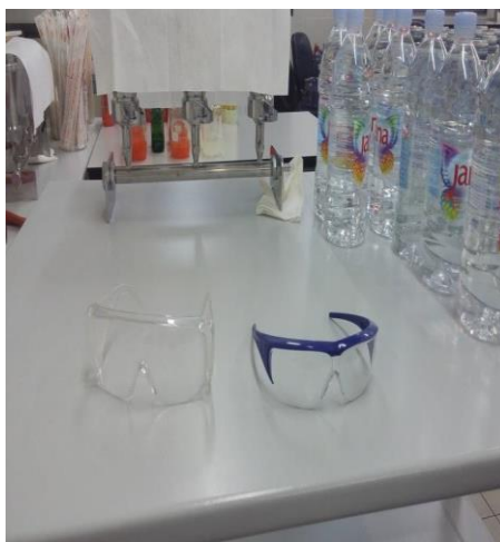
Slika 28. Zaštitne naočale u laboratoriju

Rad u laboratoriju zahtjeva poštivanje propisa i pravila ponašanja propisanih zakonom. Zaštitne naočale (slika 28.), koriste se u mikrobiološkim i kontrolnom laboratoriju te u službi razvoja. Sportski dizajn i visoka funkcionalnost pruža veliku udobnost nošenja. Usko priljubljujući oblik pruža kompletnu zaštitu i time povećava subjektivnu percepciju zaštitne funkcije. Zaštitne naočale imaju polikarbonatna stakla za odličnu zaštitu od udarca, mekani i profilirani „most“ između stakala je vrlo ugodan i sprječava klizanje te neograničeno vidno polje. Primjenjuju se prilikom rada stvaranja hranidbenih podloga, prilikom svakog naciepljivanja podloga te tijekom bilo kojega rada sa kiselinama jer služe kao zaštita od prskanja tekućine, prašina i para.