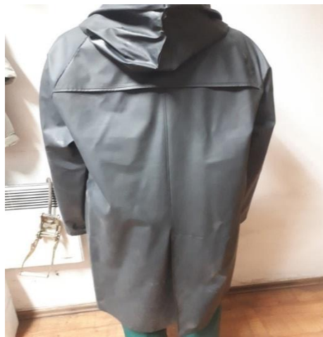
Slika 5. Kišna kabanica

Prilikom odlaska na otpadne vode, vođitelji smjena proizvodnje kao i serviseri u pripremi koriste kišnu kabanicu ili kišno odijelo, koje djeluje kao zaštita od vage, kiše ili snijega. S obzirom da kabanica ne stoji uz tijelo ne primjenjuje se za druge vrste poslova, osim nadzora. Kišna kabanica(slika 5.) je vodootporna i vodonepropusna , dužine do koljena, sa prednje strane se zatvara sa zatvaračem ima kapuljaču