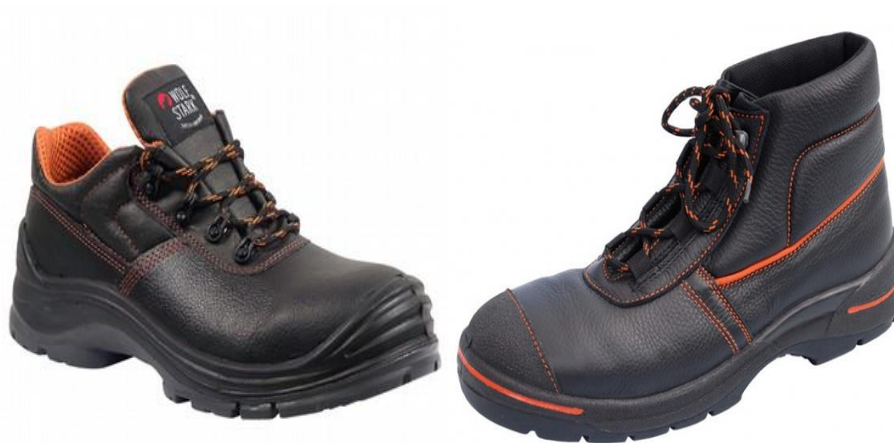
Slika 15. Zaštitne visoke i niske cipele sa zaštitnom kapicom

Serviser u pripremi je radno mjesto radno mjesto s posebnim uvjetima rada radne stoga prilikom ručnog pretakanja kiselina koriste je gumene čizme, koje također koriste u pripremi tehnoloških voda. Čizme su od poliuretana, i zelene su boje(slika 16.). Konstrukcija čizmi osigurava sigurnu manipulaciju i ergonomsku prihvatljivost bez posebnih dodataka. Podstava je izrađena iz flisa od prirodnih i sintetičkih vlakana. Potplat je izrađen zajedno sa petama te je otporna na kemijske postupke