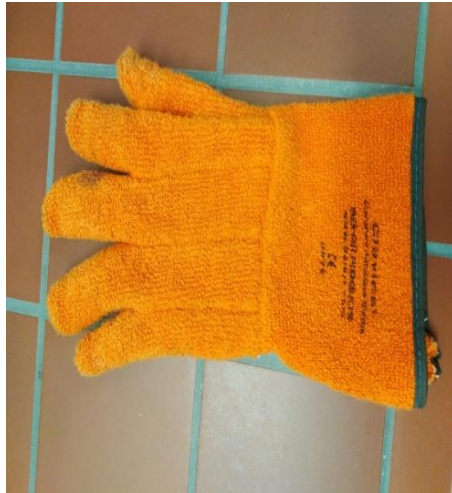
Slika 31. Rukavice za specijalnu namjenu

Rukavice se isključivo koriste za potrebe laboratorija.