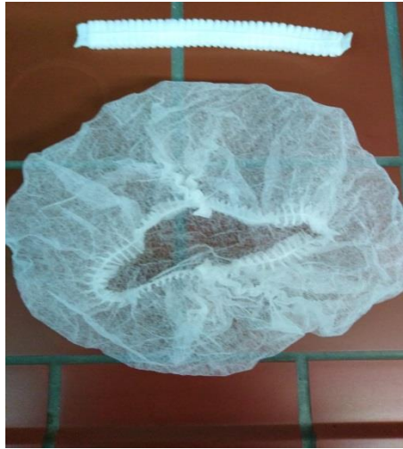
Slika 25. Harmonika kapa za jednokratnu upotrebu

Zaštitne bijele kute(slika 26.) koriste se kao radno odijelo u laboratorijima. Namijenjene su samo kao sredstvo za zaštitu od prašine i raznih prljavština pri obavljanju poslova. Materijal je od 100% pamuka i strukiranog je kroja, te ima dva bočna džepa . Tijekom ljetnog i zimskog perioda koriste se kute dugih rukava.