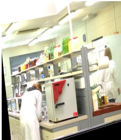
Slika 26. Zaštitna laboratorijska kuta

Zaštitne bijele kute(slika 26.) koriste se kao radno odijelo u laboratorijima. Namijenjene su samo kao sredstvo za zaštitu od prašine i raznih prljavština pri obavljanju poslova. Materijal je od 100% pamuka i strukiranog je kroja, te ima dva bočna džepa . Tijekom ljetnog i zimskog perioda koriste se kute dugih rukava.