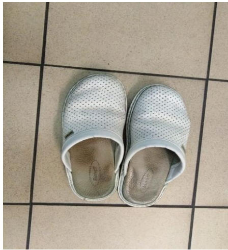
Slika 27. Laboratorijska klompa

prirodna kože od koje je sastavljeno lice klompe omogućava stopalu da slobodno diše i tako ostane suho tijekom cijelog dana.