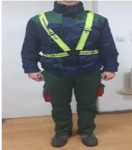
Slika 4. Radno odijelo zimsko

Također, prilikom izlaska iz hale prolaze kroz prostor prolaska viličara i obvezatna je uporaba reflektirajućih traka(slika 4.)