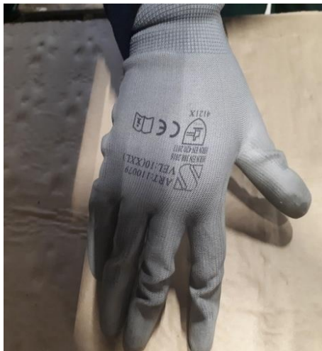
Slika 23. Rukavice najlon sa PU premazom

Oblik rukavice koja oponaša "ruku u stanju mirovanja" (slika 23.)