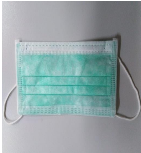
Slika 29. Jednoslojna higijenska maska

Jednoslojna higijenska maska sa elastičnim vezicama primjenjuje se kod svakog postupka rada u laboratoriju, a služi kao zaštita od udisanja para, neugodnih mirisa(slika 29.)