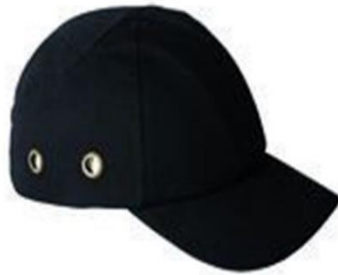
Slika 21. Zaštitne kape sa šiltom

Slika 21. prikazuje primjer kape od platna sa šiltom koju koriste djelatnici tehničke službe mehaničari-električari.