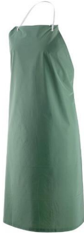
Slika 20. Zaštitna pregača