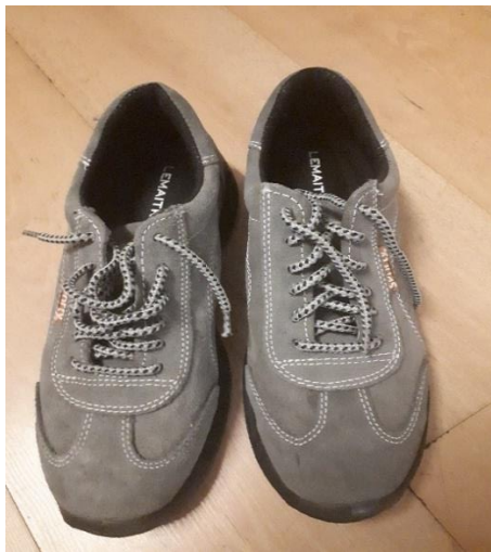
Slika 7. Zaštitne cipele

Rukovatelji strojem je radno mjesto većinom u stajaćem položaju, tada se djelatnici koriste ortopedske uloške.