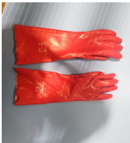
Slika 18. Rukavice sa specijalnu primjenu

Prilikom rada sa kiselinama i lužinama, serviseri u pripremi koriste rukavice za specijalnu primjenu(slika 18.) EN420, 2272 koje su otporne na kiseline, lužine i goriva. Unutrašnjost rukavica je pamučna podstava.