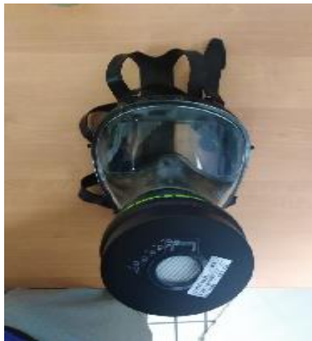
Slika 19. Maska za cijelo lice sa filterom

Maskom se isključivo koriste serviseri u prostorijama pripreme tehnoloških voda i sirupani