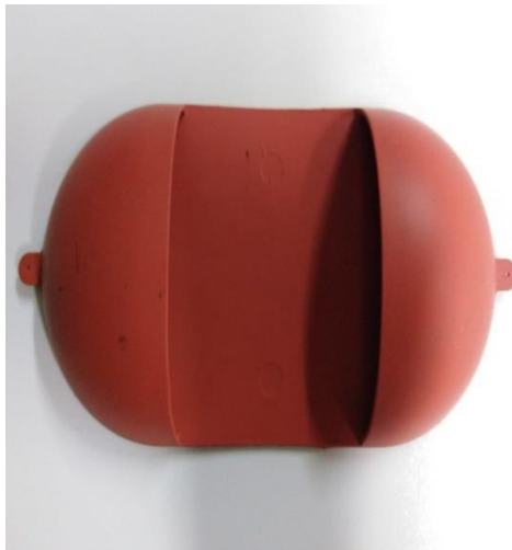
Slika 30. Gumeni štitnik

Kod manipuliranja vrućim staklom iz mikrovalne pećnice djelatnici laboratorija koriste gumene štitnike, koji služe za zaštitu prstiju i dlana ruke(slika 30.)