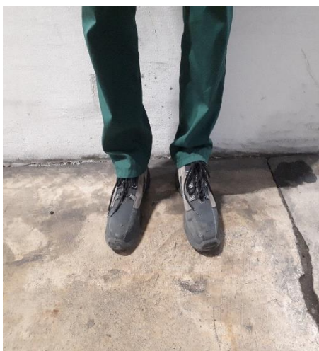
Slika 3. Zaštitne cipele od tanke brušene kože

Voditelji smjena proizvodnje prilikom rada u tehnološkim procesima koriste radne cipele od brušene kože koja sadrži kompozitnu kapicu. Potplat je jednoslojni, antistatik, te protu klizni na keramici i metalu. Zaštitna cipela je vrlo udobna(slika3.), ergonomski skladno napravljena.