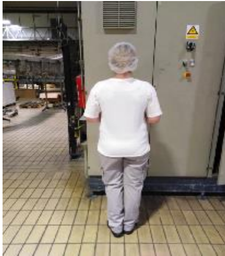
Slika 8. Radno odijelo proizvodnog radnika u ljeti

U periodu zime djelatnici rukovatelji strojem na proizvodnoj liniji koriste visokokvalitetnu flis radnu jaknu(slika 9.) od 100% poliestera koja je crne boje, majicu bijelu pamučnu, te treger radne zaštitne hlače.