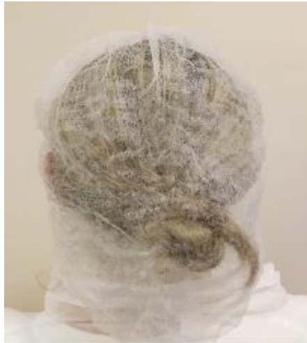
Slika 13. Zaštitna naglavna mrežica

rotirajućeg dijela stroja. Naravno, s druge strane sanitarnog gledališta zahtjeva se korištenje ovakvih zaštitnih sredstava. Ta, interno zvana kapa za jednokratnu uporabu materijala je od pamučnog konca te je rub stegnut od pamučnog platna. Materijal je polipropilen, otporan na habanje i trganje te pri svakom izlasku/ulasku u tehnološki proces kape se mijenjaju nanovo.