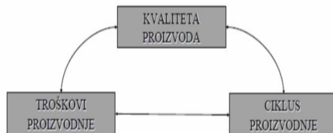
Slika 1. Parametri uspješne proizvodnje[1]

Ciklus izrade predstavlja zbroj trajanja dva vremena, odnosno ukupno vrijeme potrebno za izvođenje svih aktivnosti u procesu. Prvo vrijeme je trajanje tehnološkog ciklusa, a drugo vrijeme je trajanje svih prekida u procesu čije trajanje je poznato, a u prekide su uključeni transport, među skladištenje i kontrola.