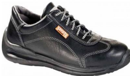
Slika 10. Niske zaštitne cipele

Prilikom rada koriste niske zaštitne radne cipele(slika 10.). Kvalitetne cipele od goveđe kože visoke su klase te izuzetno udobne za duži period nošenja. Potplat je antistatik, protu klizni te otporan na ulje i goriva. Cipele sadrže zaštitnu kapicu i neprobojan među potplat.