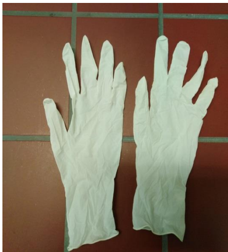
Slika 32. Rukavice za jednokratnu upotrebu

Rukavice su bez pudera, veličina S, M, L, i XL