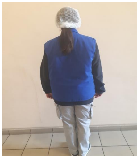
Slika 12. Topli zaštitni prsluk

Topli radni prsluk je za rad u hladnijim uvjetima sa proširenim toplim umetkom i sadrži dva džepa a jedan u unutrašnjoj podstavi(slika 12.). Zatvaranje sa patentnim zatvaračem +metalni drucker. Materijal je mješavina pamuka i poliestera a podstava je od 100% poliestera te pruža dodatnu zaštitu i toplinu.