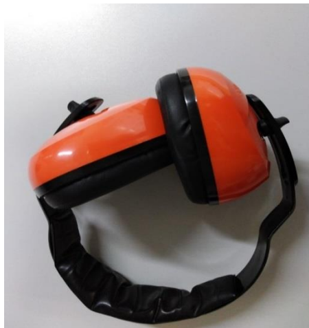
Slika 14. Ušni štitnik- antifon slušalice

Školjke su od PVC-a s jastučićima poput kože. Opseg glave je podesiv tako da se može svakome prilagoditi, a obruč je podstavljen.