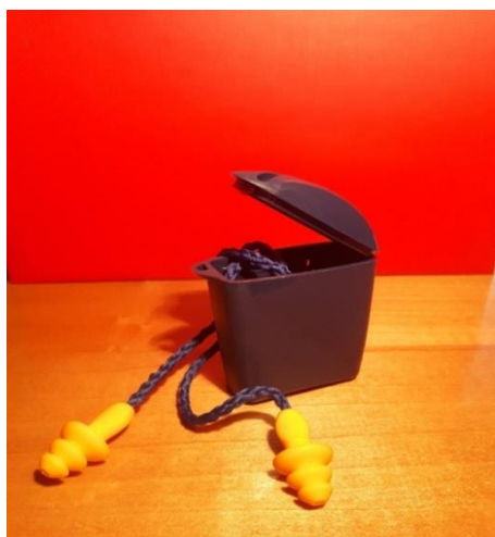
Slika 6. Višekratni čepići sa trakom sa kutijom za odlaganje

Silikonski čepići (slika 6.) omogućuju ravnomjerno prigušivanje zvuka, a čepići su povezani vezicom. Vrlo su ugodni za nošenje te su zbog vezice uvijek pri ruci. Napravljeni su od fleksibilne mikro gume, lako se peru i održavaju te imaju osobinu da se prilagođavaju uhu. Prilikom nošenja vrlo dobro se raspoznaje signal i govor što je bitno prilikom rada u tehnološkom procesu a koriste je rukovatelji strojem.