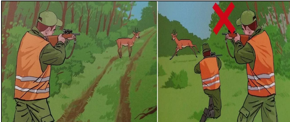
Sl.7. Primjer sigurnog i opasnog lova [8]