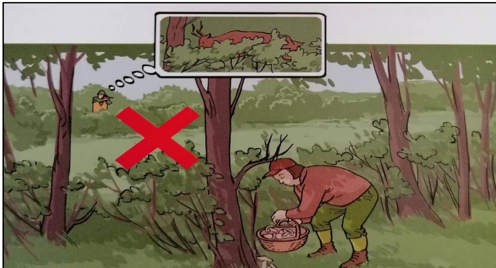
Sl.8. Opasan lov ne razmišljajući o smjeru lova [8]