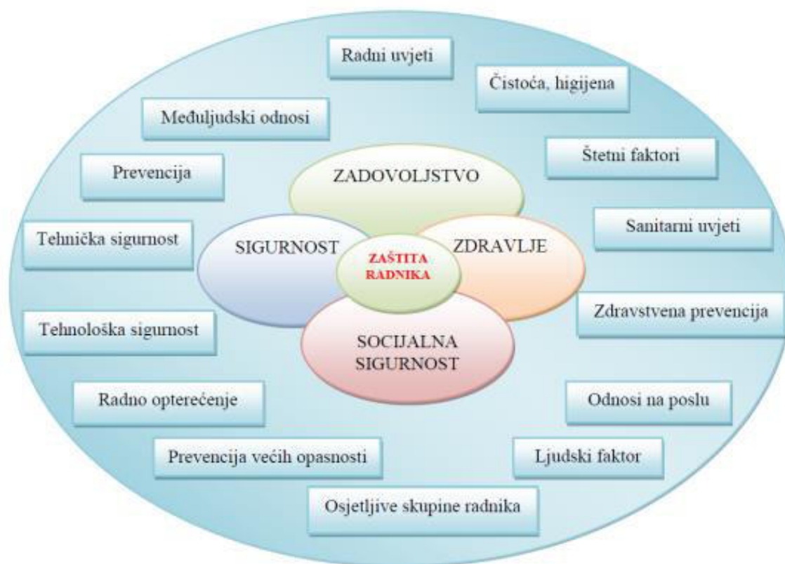
Slika 1. Aspekti rada koji utječu na zaštitu radnika