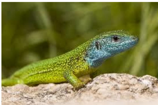
Slika 10. Obični zelembać

Na Papuku je zabilježen na Jankvcu – 24 jedinke, Zvečevu – 31 jedinka, Bistri – 14 jedinki, Orahovačkom jezeru – 21 jedinka, Vetovo ribnjacima – 21 jedinka, Kutjevo potoku – 27 jedinki, Brzaji – 17 jedinki, Djedovica – 11 jedinki, Fosilnom nalazištu – 7 jedinki, Svinjarevcu – 12 jedinki, Voćin jezeru – 16 jedinki, Sekulinci potoku – 22 jedinke i Slatinski Drenovac – 22 jedinke (BOGDANOVIĆ, 2013.).