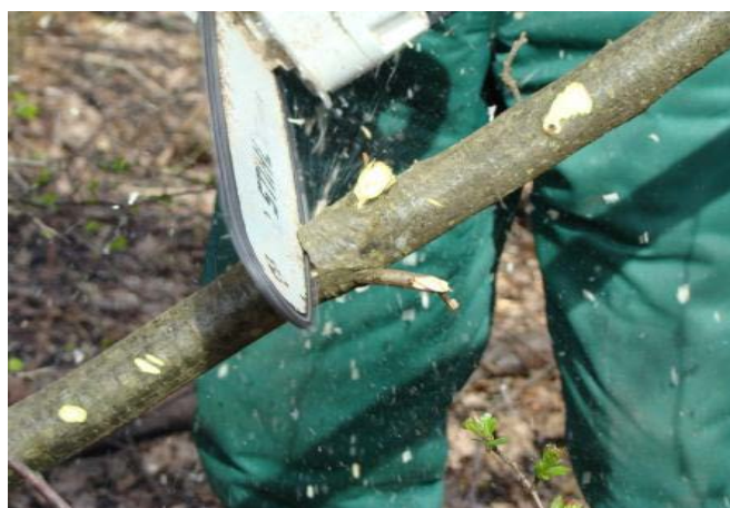
Slika 22. Prikraćivanje stabalca

Prikraćivanje stabalca radimo postupkom rezova odozgo i odozdo, ponavljajući rezove dok krošnja ne padne na zemlju. Prilikom prikraćivanja stabalaca treba obratiti posebnu pažnju na opasnost od ozljede nogu, kao i na opasnosti od bočne napetosti stabalaca. [9]