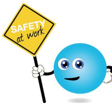
Sl. 1. Zaštita na radu