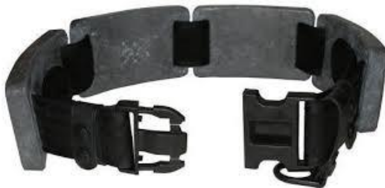
SLIKA 22. ronilački utezi

Ronioci nose utege kako bi se savladao uzgon koji stvara druga oprema koju oni koriste (odijelo i boce). Uglavnom je to niz olovnih ploča na pojasu koji se kopča oko struka ili inačica s pojasom sa spremnicima u koje se stavljaju utezi u obliku vrećica punjenih olovnim kuglicama. Remen se kopča kopčom koja omogućava brzo otkopčavanje i skidanje remena u slučaju opasnosti. Na slici brij 22 imamo klasične ronilačke utege koji se stavljaju na tijelo ronioca poput pojasa u struku.