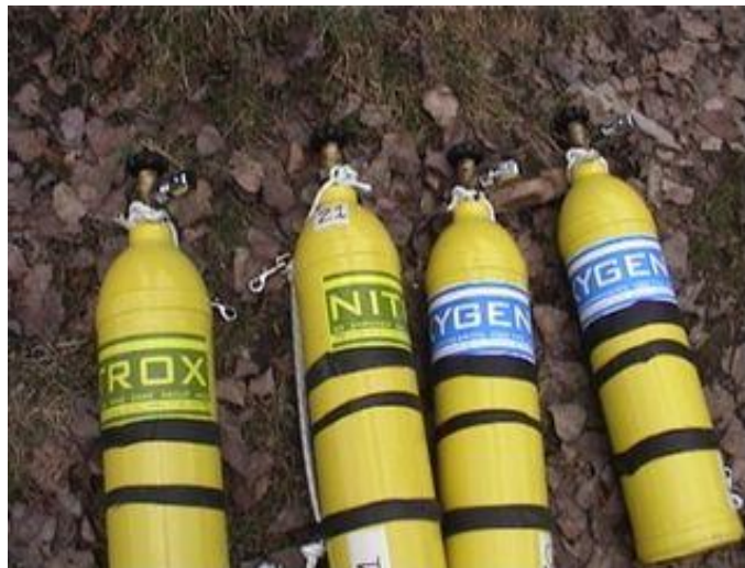
SLIKA 13.boce na NITROX

Nitrox ljudi nazivaju zrak obogaćen kisikom. Nitrox je mješavina dušika i kisika (N 2 /O 2 ). S obzirom da ova dva plina čine preko 99% atmosferskog zraka koji normalno udišemo, troposfera - tanki sloj atmosfere uz Zemlju u kojem se odvija život je isto što i jedna vrsta Nitrox-a. Na slici broj 13 vidimo prikaz ronilačkih boca na Nitrox.