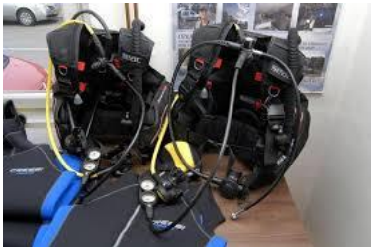
SLIKA 8..autonomni ronilački aparat