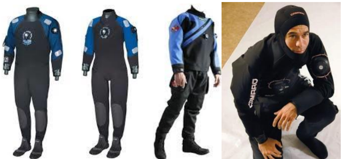
SLIKE 19. suha ronilačka odijela

Suha odijela potpuno sprječavaju ulaz vode. Na sebi imaju priključak za stlačeni zrak i mogu se napuhavati, te na taj način služiti i kao dodatni kompenzator plavnosti. Ispod suhoga odijela oblači se pod odijelo koje je ključni čimbenik za osiguranje dobre termičke zaštite. Iako su suha odijela puno bolja toplinska zaštita od mokrih odijela, za njihovu uporabu potrebno je završiti poseban specijalistički tečaj kako bi ih se naučilo pravilno koristiti. Na slikama broj 18 imamo suho ronilačko odijelo, na desnoj slici vidimo ronioca odjevenog u suho ronilačko odijelo.