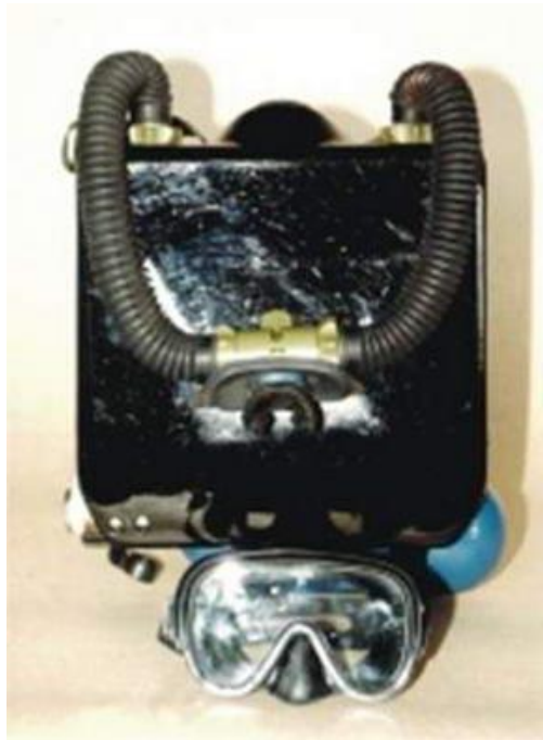
SLIKA 9. ronilački aparat- ARAK

Funkcionira na principu zatvorena kruga. To znači da se nakon udisanja čistog kisika iz boca izdahnuti plinovi bogati kisikom i ugljičnim dioksidom, nakon eliminacije ugljičnog dioksida ponovno koriste za disanje. Primjenjuju se u ofenzivnim (diverzantskim) borbenim ronjenjima, prilikom izvođenja lakših ronilačkih radova. Sastoji se od boce(a) za kisik sa zapornim ventilom, ventilne skupine se spojenim cijevima, vreća za disanje s kanistrom za natronsko vapno i rebrastih dišnih crijeva s ventilnom kutijom. Kisik iz boca nakon međuredukcije u redukcijском ventilu reducira se u vreći za disanje. Iz vreće za disanje kisik se udiše iz crijeva za udah putem piska, a izdahnuti plinovi nakon oslobađanja od ugljičnog dioksida na natronskom vapnu vraćaju se u vreću za disanje. U njoj se miješa s čistim kisikom i ponovno udiše. Maksimalna dubina ronjenja s ARAK-om je do 10m. Na slici broj 8 vidimo prikaz autonomnog ronilačkog aparata na kisik –ARAK.