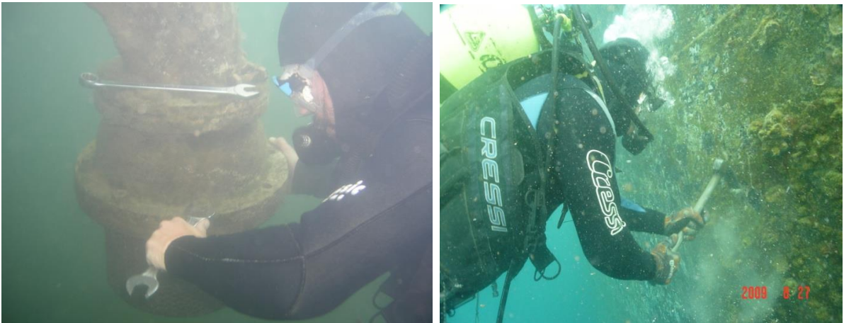
SLIKE 1. i 2.primjeri upotrebe ručnih alata

U podvodne alate i strojeve koji se koriste u podvodnim radovima spadaju uglavnom pneumatski i hidraulični strojevi, ručni alati i električni alati i strojevi. To su uglavnom alati i strojevi koji se koriste i kod izvođenja građevinskih radova na kopnu. Neki od tih alata i strojeva su potpuno identični alatima i strojevima na kopnu, dok su neki prerađeni odnosno prilagođeni radu pod vodom. Na slikama 1 i 2 vidimo primjere upotrebe ručnih alata, a na slikama 3 i 4 primjere upotrebe hidrauličkih strojeva.