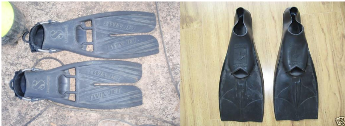
SLIKE 23. peraje za podvodne radove

Pune peraje se koriste za plivanje u toploj vodi uz uvjet da su odgovarajuće veličine. Tijesne peraje stežu, izazivaju grčeve i povećavaju osjetljivost na hladnoću.