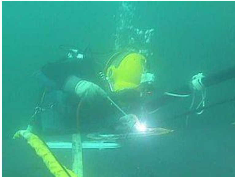
SLIKA 5 .mokro podvodno zavarivanje

Podvodno zavarivanje kao i drugi podvodni radovi koje izvode ronionici u cilju održavanja brodova, podmornica, platformi, cjevovoda itd., vrlo su složene i skupe aktivnosti, te su zbog poznatih fizikalnih ograničenja ljudskog tijela ronionici izloženi visokom riziku. Organizacija takvih poslova zahtijeva veliki broj visokostručnih ljudi i mobilizaciju ogromne količine opreme. Nezamjenjivu ulogu u održavanju podvodnih konstrukcija imaju ispitivanja bez razaranja i postupak mokrog podvodnog zavarivanja, pomoću kojih se vrlo brzo i uspješno mogu izvesti sanacije lomova konstrukcijskih elemenata na licu mjesta, a u slučaju dobre pripreme i organizacije moguća je izvedba ugradbenih (montažnih) zavarenih spojeva.