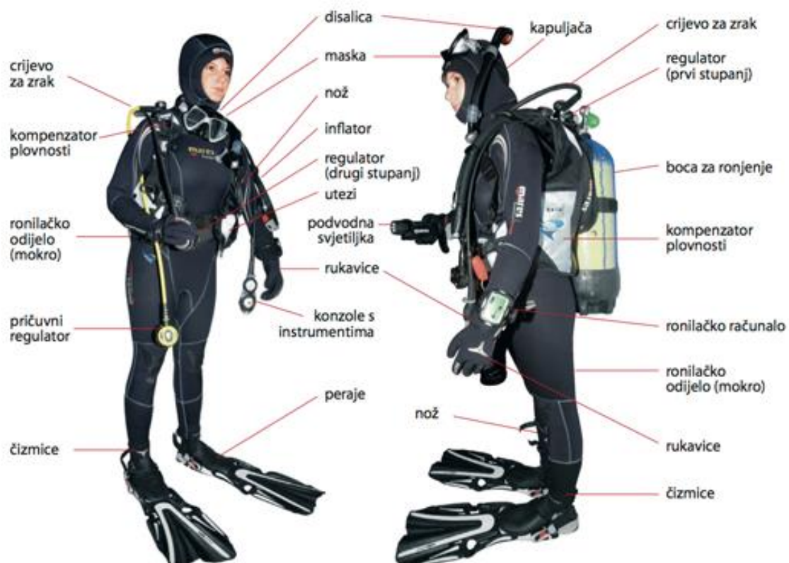
SLIKA 14.detaljan prikaz opreme

Pomoćna oprema ronionca koji obavlja radove podvodnog varenja i rezanja se sastoji od osnovne glavne ronilačke opreme, bez koje se ne može izvesti boravak ispod vodene površine, a sastoji se od: maske za ronjenje, peraja, ronilačkog odijela, rukavica, kompenzatora plovnosti, boca za ronjenje, instrumenta, noža, utega, ronilačkih čizama, i dodatne opreme koja se upotrebljava za obavljanje određenih podvodnih radova u našem slučaju podvodnog varenja i rezanja. Na slici broj 14 vidimo kompletan i detaljan prikaz ronilačke opreme i njezin položaj, odnosno mjesto na kojem se uvijek nalazi. Svaki dio opreme ima točno određeni propisani položaj zbog toga da bi se ronioncu olakšalo snalaženje i rad pa i sam boravak ispod vodene površine s opremom te da bi se prije svega smanjile moguće ozljede u nekim slučajevima i smrt, zbog nepredvidivih uvjeta rad, kao što su jake morske struje, zamućenost vode, smanjena vidljivost idr.