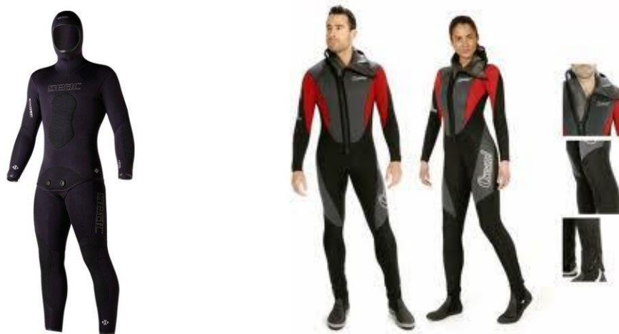
SLIKA 18. mokra ronilačka odijela

Ronilačko odijelo štiti tijelo ronioca od ogrebotina, životinjskih uboda, no prvenstvena mu je uloga da spriječi gubitak topline roniočeva tijela. Tijekom dužega boravka pod vodom i na većoj dubini ronionci su izloženi niskim temperaturama. Postoje dva tipa odijela za ronjenje: mokro i suho odijelo.