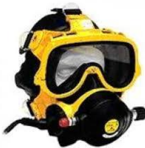
SLIKA 16. maska za cijelo lice

Budući da nema univerzalnih maski, poželjno je i preporučljivi poznavati kriterije za odabiranje kvalitete maske. Na slici broj 16 imamo klasičnu masku za cijelo lice.