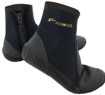
SLIKE 24. ronilačke čizmice

Čizmice za ronjenje (slika 24) sa patentom i gumiranim protukliznim đonom, izrađuju se od neoprena, minimalne debljine 3mm.