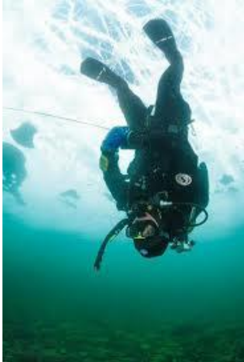
slika 25. ronilac osiguran užetom

Spusno uže je namijenjeno za spuštanje torbe s oruđem ili pojedinačnog pribora (strojeva, alata, elektroda, spojki i sl.), ronioncu dok se nalazi u vodi, glavna prednost mu je praktičnost kada ronilac u tijeku rada zatreba dodatni pribor. Na dno užeta objesi se torba s oruđem potrebnim za rad ili pojedinačni dio pribora. Na slici 25 vidimo ronionca osiguranog užetom.