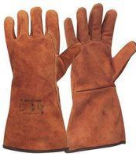
SLIKA 28. rukavice za varenje

varenja na suhom jer se vari u vodi. Ove se zaštitne rukavice također koriste i prilikom podvodnog rezanja.