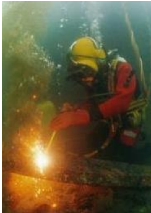
SLIKA 6. podvodno rezanje elektrodom

Jedan od načina podvodnog rezanja i varenja je pomoću opreme za podvodno rezanje i varenje ultratermičkim (5000 °C) elektrodama (Broco BR-22), opremom za rezanje (propan-butan s kisikom) koja uključuje poseban plamenik (HarrisCalorific H-624FL), redukcijske ventile, suhe nepovratne ventile i sigurnosne ventile za kisik i propan-butan, plinske sapnice raznih veličina, oprema za održavanje i dvostruka crijeva. Na slici 6 vidimo primjer podvodnog rezanja elektrodom.