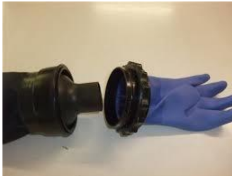
SLIKA 20. manžete

najčešće proizvodi od trilaminata (kombinacija triju različitih materijala) ili crash neoprena (već stlačeni neopren).