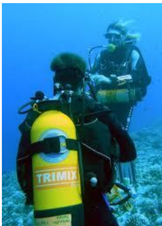
SLIKA 12.boce punjene mješavinom TRIMIX

Za mješavine u dubljim zonama (od 60m pa naviše), potrebni kisik koji je sadržaj naše mješavine pa sve do točke kod koje možemo miješati helij i zrak, zvan HELIAIR – ne smije se dodavati kisik.