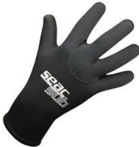
SLIKA 27. klasične zaštitne rukavice

Zaštitne rukavice za ronjenje (slika 27) sastavni su dio obvezne ronilačke opreme, svrha im je da zaštite ruke ronioca od vanjskih utjecaja okoline, vode i hladnoće. Kao i zaštitna ronilačka odjela izrađuju se od neoprenskog materijala, štite ruke ronioca od ogrebotina i pothlađivanja, napravljene su tako da savršeno prijanjaju uz ronilačka odijela.