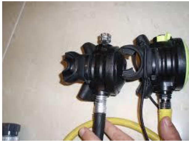
SLIKA 17 regulatori

Regulatori su osobito važan dio opreme ronioca. Ronioci preko njega izravno udišu zrak koji im je neophodan ne samo za rad već i za sam boravak ispod vodene površine. Regulator za ronjenje sastoji se od prvoga i drugoga stupnja. Prvi stupanj ima zadatak reducirati tlak iz boce na 9 bara. Drugi stupanj se sam regulira na tlak okoline prilikom čega omogućava nesmetano disanje ronioncu. Ronilačku opremu važno je redovito održavati, a posebno njen najosjetljiviji dio – regulator. Na slici broj 17 imamo prikaz dva regulatora.