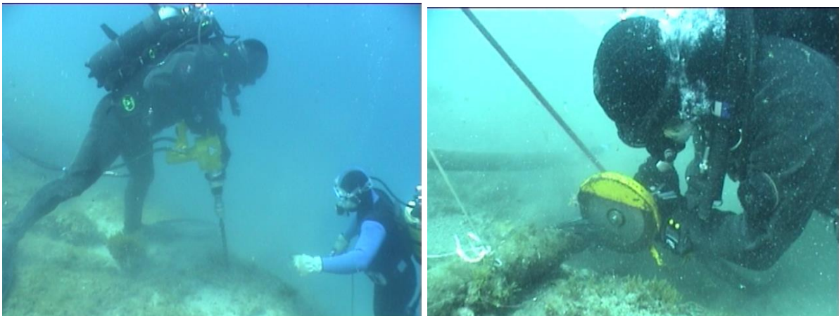
SLIKE 3 i 4.radovi sa hidrauličkom bušilicom i hidrauličkom brusilicom