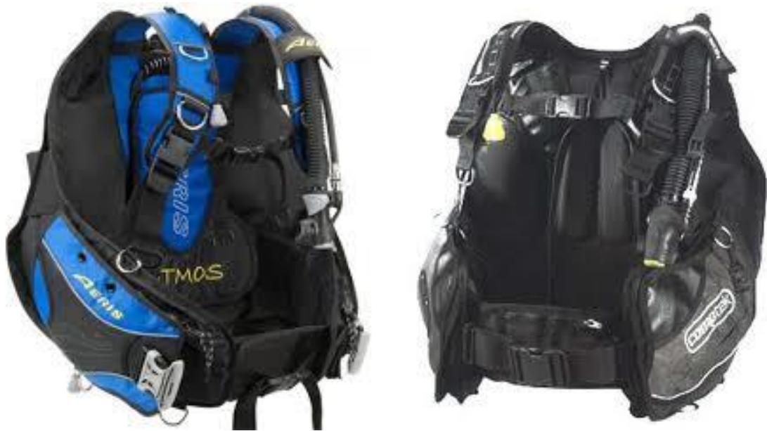
SLIKE 21. kompenzatori plovnosti