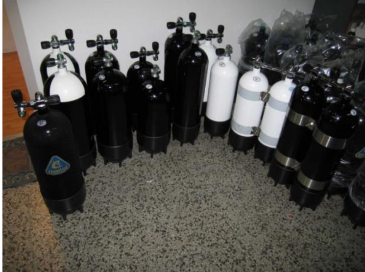
SLIKA 11. zračne ronilačke boce (spremnici)

Zaštiti i održavanju vanjskih i posebice unutarnjih stjenki posvećuje se posebna pozornost. Izvana se boce konzerviraju galvanizacijom, odnosno pocinčavanjem i nanošenjem epoksi boja odnosno vinil plastičnih pokrova. Unutrašnjost boca i to nakon poliranja se zaštićuje galvanizacijom, fosfatacijom, lakiranjem ili plastifikacijom.