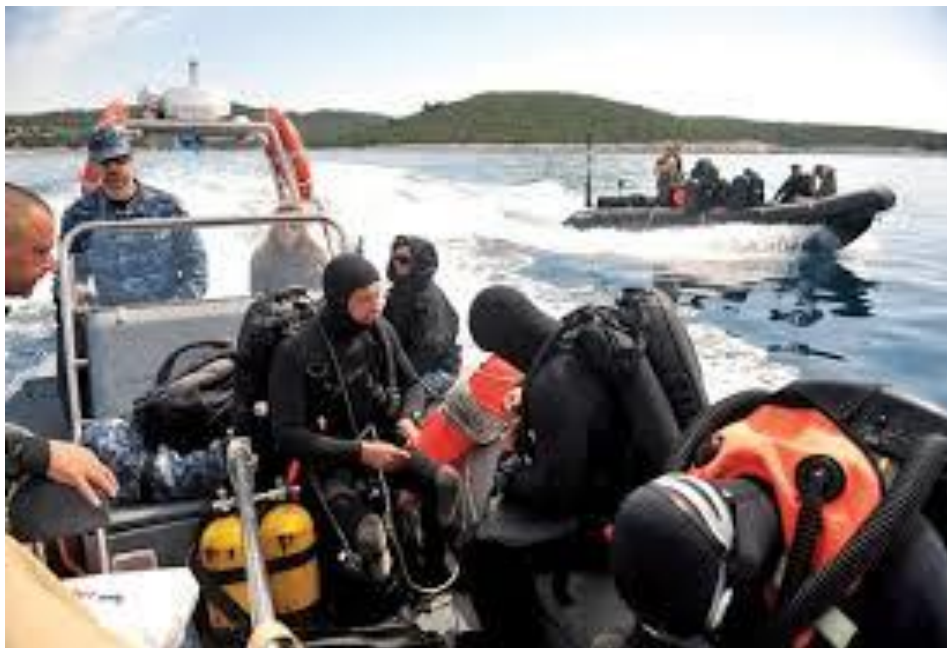
SLIKA 10. ronionci opremljeni ARAM-om

Funkcioniraju na principu poluzatvorena kruga. Klasični ARAM sastoji se iz boce(a) za mješavinu sa zatvorenim ventilom, ventilne skupine, spojenih cijevi, jedne ili dvije vreće za disanje s kanistrom za natrsko vapno te rebrastih crijeva za udisanje i izdisanje s ventilnom kutijom i piskom. Napajaju se mješavinama obogaćenog zraka koje standardno sadrže 60, 40 ili 32,5 % kisika (Nitrox-60%, Nitrox-40% i Nitrox-32,5%). Nakon otvaranja boca izvorni visoki tlak mješavine se najprije reducira na odgovarajući među tlak kao kod ARAK-a. Udiše se iz vreća za disanje a izdiše kroz izdišno crijevo. Izdahnuti plinovi najvećim dijelom se regeneriraju i ponovno udišu pomiješani se svježom mješavinom iz boca. Najčešća im je primjena u protuminskom ronjenju. Na slici broj 10 su ronionci u pripremi za rad opremljeni autonomnim ronilačkim aparatima na mješavinu.