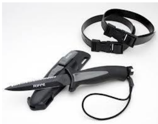
SLIKA 26. ronilački nož