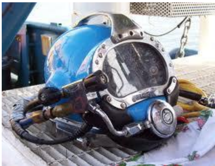
SLIKA 15. maska za cijelo lice s tempiranim staklom

U našem slučaju ronioca koji obavlja radove podvodnog varenja i rezanja podrazumijevaju se maske od temperiranog stakla jer u slučaju prskanja komadići ne nanose ozljede nosiocu maske. Na slici broj 15 imamo primjer maske za cijelo lice s tempiranim staklom.