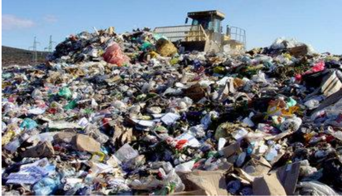
Slika 1. Odlagalište otpada u radu