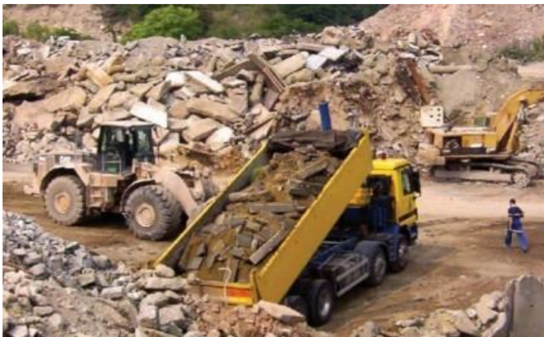
Slika 4. Građevinski otpad