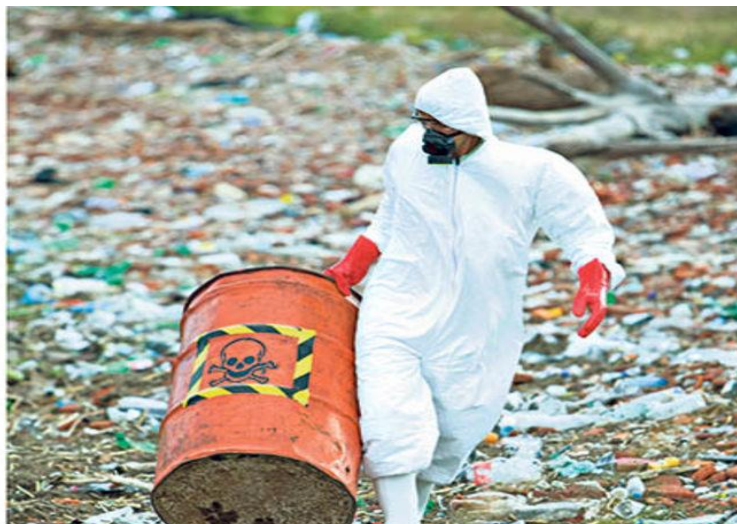
Slika 2. Opasni otpad

Zakonom o otpadu definira se način skladištenja i prijevoz opasnog otpada. Osnovno je da se opasni otpad mora izdvojeno sakupljati i skladištiti na strogo kontroliranim i u skladu sa Zakonom opremljenim prostorima. Prijevoz opasnog otpada mora biti isključivo u skladu s propisima koji vrijede za prijevoz opasnih tvari. Obrada opasnog otpada dozvoljena je samo u postrojenjima koja posjeduju sve zakonom propisane uvjete i dozvole.