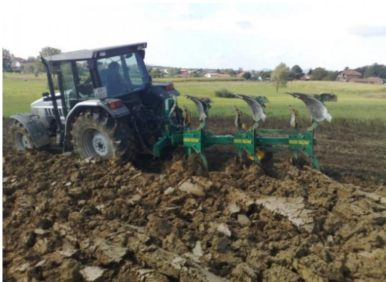
Slika 1. Oranje tla