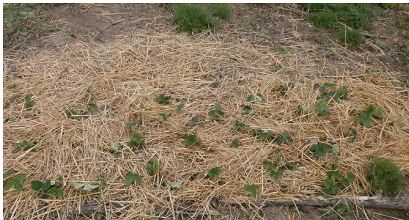
Slika 2. Malčiranje tla

provedeno na najbolji mogući način u jesen. Njegova debljina mora biti između 10 cm i 15 cm te je najbolje koristiti polurazloženi malč. Ako se koristi malč koji je sastavljen od drvenih supstanci u tom se slučaju nastoji izbjegavati lišće hrasta i oraha zbog sporog razgrađivanja te otrovnih tvari koje ta drva sadrže. Prije postavljanja drvenog malča tlo se gnoji organskim gnojem kako bi se održao udio dušika u tlu (Znaor, 1996).