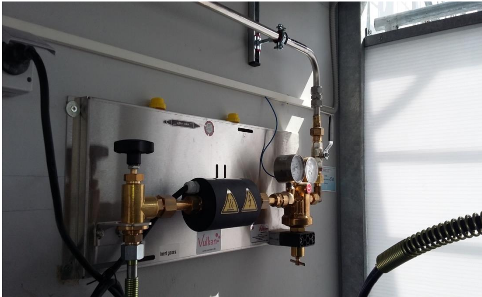
Slika 1. Regulator tlaka [16]

Cjevovodi za tehničke plinove obuhvaćaju skup cijevi, spojnice, ventila i regulatora u jednu cjelinu. Cjevovodi za tehničke plinove koje montira tvrtka GTG-plin spadaju u skupinu visokotlačnih cjevovoda, a izrađeni su od nehrđajućeg čelika ili od bakra. Promjeri cjevovoda se kreću u rasponu \varnothing 8mm pa do \varnothing 35mm. Slika 1 prikazuje regulator tlaka.