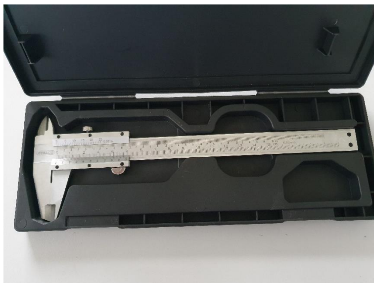
Slika 12. Pomično mjerilo [16]

Pomično mjerilo korišteno za mjerenje je preciznosti 0,02mm. Slika 12. prikazuje pomično mjerilo korišteno za mjerenje.