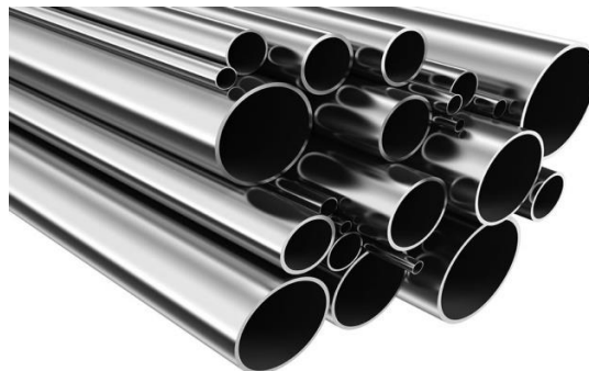
Slika 8. Cijevi od nehrđajućeg čelika [10]

Cijevi od nehrđajućeg čelika visoke su tvrdoće i vrlo otporne na utjecaj korozije. Proizvode se šavne i bešavne. Cijevi od nehrđajućeg čelika legirane su kromom (Cr), niklom (Ni), molibdenom (Mo), a manje ostalim elementima pripadaju austenitnim nehrđajućim čelicima. Slika 8 prikazuje cijevi od nehrđajućeg čelika.