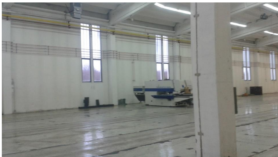
Slika 5. Cjevovod od bakra

Bakrene cijevi spajaju se tehnikom tvrdog lema.