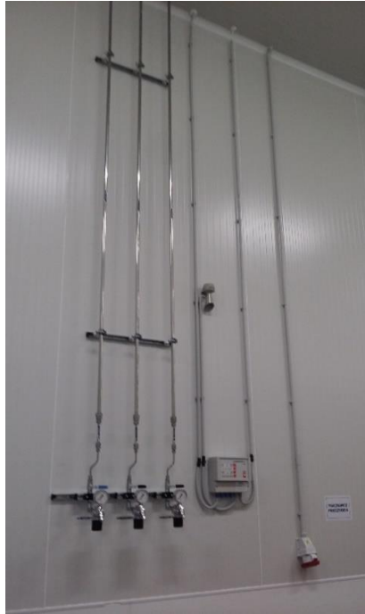
Slika 2. Cjevovod od nehrđajućeg čelika [16]

Slika 3 prikazuje izlazni regulator tlaka. Cijevi se spajaju ili spojnicama sa dva prstena koja obuhvate cijev te se stezanjem uhvate oko cijevi i naprave nepropusan