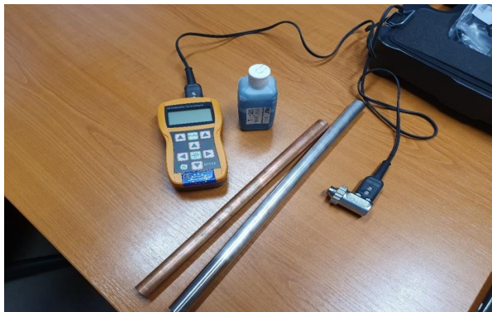
Slika 11. Uređaj za ispitivanje debljine stijenke ultrazvukom

Prilikom mjerenja na cijev je nanesen sloj gela koji je neophodan za provedbu ispitivanja ultrazvukom. Gel se koristi u svrhu lakšeg prijenosa ultrazvučnih valova sa sonde na ispitnu površinu, i obrnuto. Kontaktna sredstva imaju svrhu da strukturom i svojstvima što manje pridonose utjecaju na ultrazvučni impuls, a istodobno ne daju pristup nekom drugom mediju na kontaktnu površinu. Slika 11 prikazuje uređaj za ispitivanje debljine stijenke ultrazvukom.