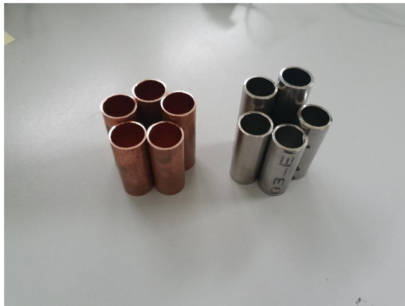
Slika13. Komadi cijevi [16]

Mjerenja izvršena na istim komadima cijevi koji su korišteni za ispitivanje debljine stijenke ultrazvukom. Svaka od cijevi razrezana je na 5 mjesta te je na tim mjestima mjerena debljina stijenke. Slika 13 pokazuje izrezane komade cijevi.