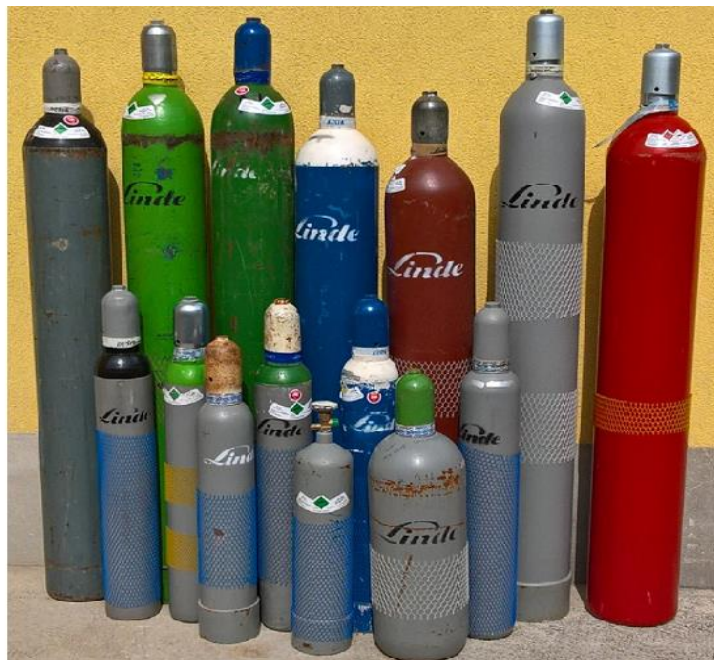
Slika 6. Tehnički plinovi u bocama [3]

Tehnički plinovi važan su dio gotovo svake industrije. Koriste se kod zavarivanja, inertizacije, konzerviranja, gorenja, pospješivanje gorenja, hlađenje, rezanje (laseri, plazme) i drugo. Slika 6 prikazuje tehničke plinove u bocama.