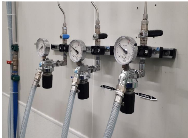
Slika 3. Izlazni regulatori tlaka [16]

Slika 3 prikazuje izlazni regulator tlaka. Cijevi se spajaju ili spojnicama sa dva prstena koja obuhvate cijev te se stezanjem uhvate oko cijevi i naprave nepropusan