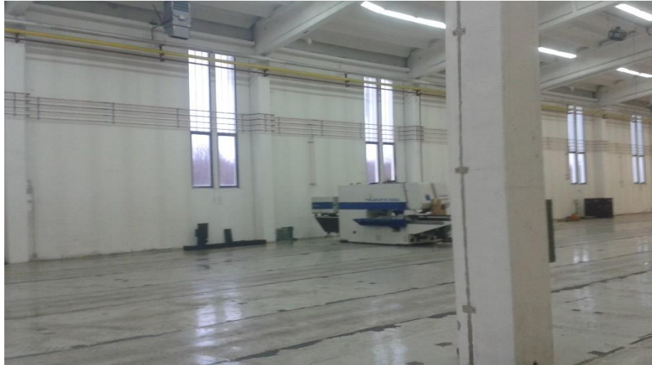
Slika 5. Cjevovod od bakra

Bakrene cijevi spajaju se tehnikom tvrdog lema.