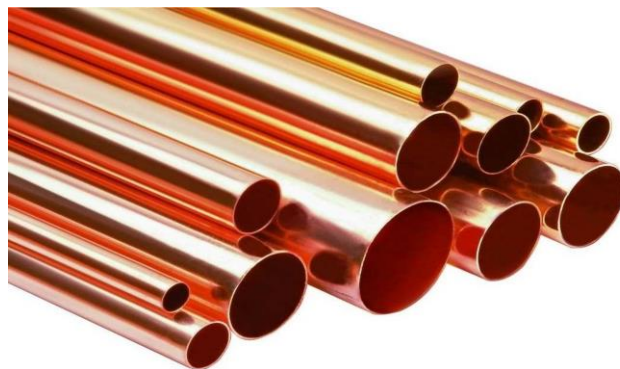
Slika 7. Bakrene cijevi [5]

Bakrene cijevi proizvode se kao šavne ili bešavne. Slika 7 prikazuje bakrene cijevi.