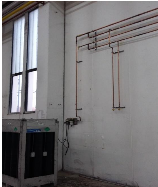
Slika 4. Bakar cjevovod sa priključenim snopom boca dušika [16]

Kada su u pitanju cjevovodi kod neprehrambenih pogona uglavnom se radi o bravarskim radionicama gdje se rade cjevovodi za transport plinova koji služe za raznorazna rezanja, inertizaciju atmosfere i slično. Veliki broj kupaca koriste dušik i kisik kao medij za rezanje laserskim rezačicama. Prilikom projektiranja samog cjevovoda mora se uzeti u obzir potrošnja plina koju će korisnik imati. Po potrošnji se zatim određuje promjer cijevi koje će biti korištene u izradi, te se gleda hoće li se izvesti jednostruki cjevovod odnosno cjevovod koji nema zatvoreni tok ili će se izrađivati tzv. „kružni vod“ zatvoren u obliku „prstena“. Cjevovodi se uglavnom se izrađuju od bakra, dok je nešto manje cjevovoda od nehrđajućeg čelika. Slika 4 prikazuje bakar cjevovod sa priključenim snopom boca dušika.