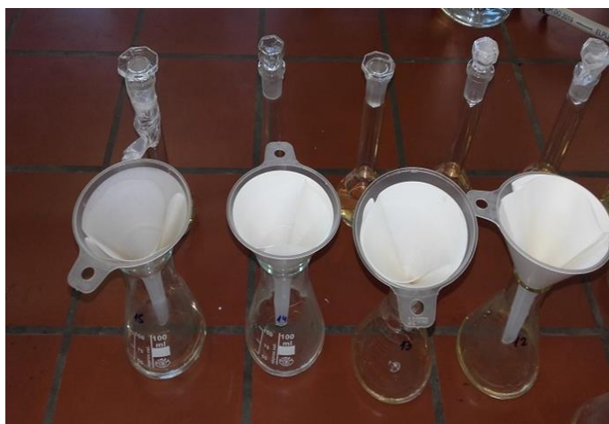
Slika 2. Filtriranje uzoraka

Iz odmjernih tikvica se nefiltrirani uzorci kroz filter papir, preko lijevaka, filtriraju u nove, čiste Erlenmayer tikvice (postupak na Slika 2.).