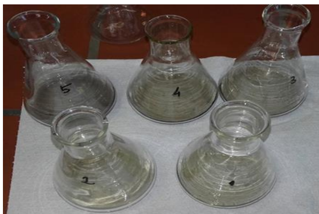
Slika 3. Filtrirani uzorci

Filtrirani uzorci su prikazani na Slici 3.