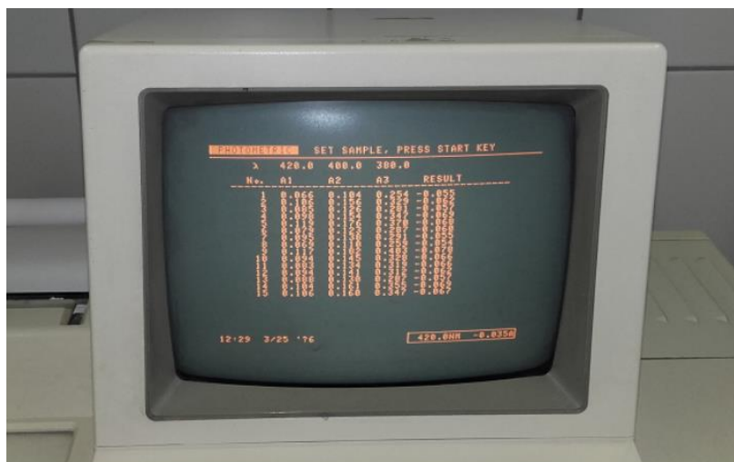
Slika 4. Prikaz rezultata na monitoru spektrofotometra

Nakon završenih mjerenja filtriranih uzoraka, pri svakoj određenoj valnoj duljini, na monitoru ponovno su prikazane sve izmjerene vrijednosti apsorbancija za svaki pojedini uzorak, ti se podaci također ispisuju.