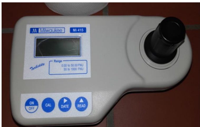
Slika 5. Turbidimetar

Turbidimetar koji mjeri mutnoću pri rasipanju svjetlosti pod kutom 90^\circ je nefelometar i mjeri smetnje putovanja svjetlosti kroz tekućinu koje uzrokuju krute čestice u tekućini. Jedinica za mjerenje mutnoće je NTU (Compendium i sur., ,2013).