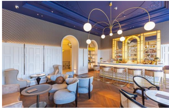
Slika 3. Interijer bara u Hilton Imperial hotelu u Dubrovniku