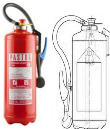
Slika 10. Vatrogasni aparat sa vodom. [5]

Konstrukcija ovog vatrogasnoga aparata slična je kao vatrogasnog aparata s bočicom koji koristi prah kao sredstvo za gašenje te je i aktiviranje identično. Razlika je samo u mlaznici gdje kod vatrogasnih aparata sa vodom imamo mlaznicu za raspršenu vodu, tzv. tuš mlaznicu te je unutrašnjost spremnika zaštićena od korozije. Nikako nisu pogodni za gašenje uređaja pod naponom te trebaju imati upozorenje na uputstvu ili dodatnu naljepnicu da se ne smiju gasiti uređaji pod naponom. Ovi vatrogasni aparati pogodni su za gašenje požara razreda A i B. Vodi se mogu dodati dodatci kojima se poveća efekt gašenja. [4]