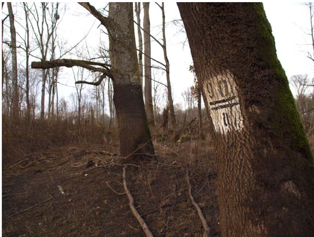
Slika 4: Izvozne vlake u promatranom odjelu

Odsjek 90a predstavlja mješovitu sastojinu poljskog jasena s hrastom lužnjakom i podstojnim grabom na gredi. Fitocenološka je to zajednica Leucoio – Fraxinetum angustifoliae Glavač 1959 (Šuma poljskog jasena s kasnim drijemovcem). Sastojina je površine 13,26 ha, nejednolike je debljinske strukture i osrednje kakvoće, a u nižim dijelovima odsjeka se nalaze grupe čistog jasena (nize). Starost odsjeka je 105 godina. Sklop u odsjeku je nepotpun, a jasen koji je dostigao ophodnju je većinom pri žilištu šupalj, vjerojatno zbog dugotrajnog zadržavanja vode u odsjeku te od oštećenja žilišta prilikom prijašnjih radova vuče. Tip tla u odsjeku je močvarno-glineno. Odsjek je redovito svake godine plavljen u jesenskom, zimskom i proljetnom periodu, te su poplave većinom u trajanju od 20 do 40 dana u jesen i zimu, i tridesetak dana tijekom proljeća. Iako se uz odsjek nalazi kanal Sepčina (čini južnu granicu odsjeka), odvodnja suvišne površinske vode nije dobro riješena prekapanjem kanala pa se u mikrodepresijama (nizama) voda nalazi tokom cijele godine. Zbog dugotrajnog zadržavanja vode u odsjeku, stabla koja su dočekala ophodnju redovito stradavaju od leda u zimskom periodu, te je prirodna obnova otežana. Obnova u