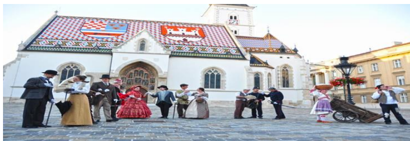
Slika 15: Zagrebački vremeplov na Markovom trgu