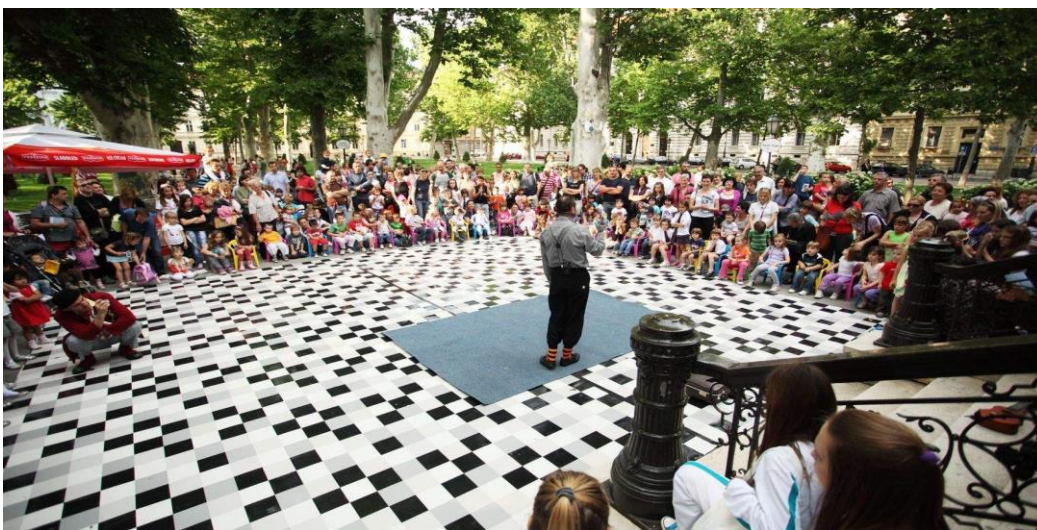
Slika 9: Cest is d best