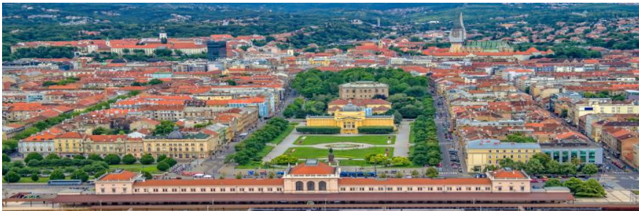
Slika 1: Grad Zagreb