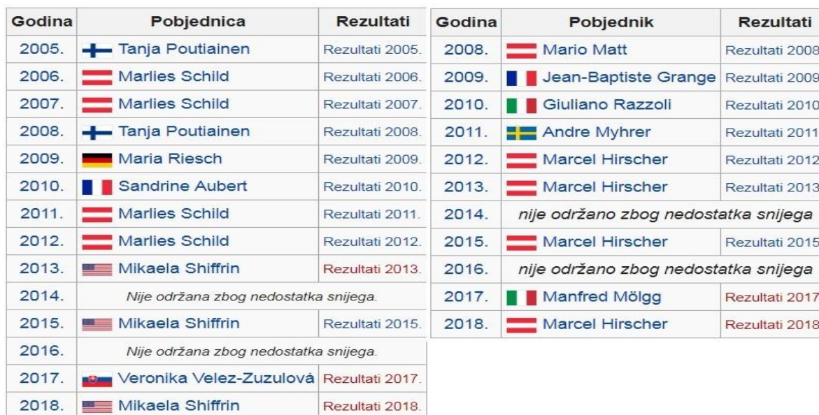
Slika 13: Muški i ženski pobjednici od osnivanja utrke