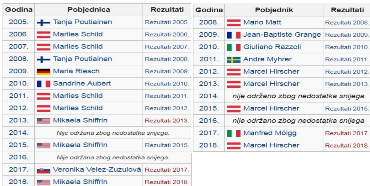
Slika 13: Muški i ženski pobjednici od osnivanja utrke