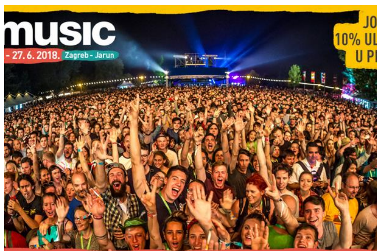
Slika 11: INmusic festival