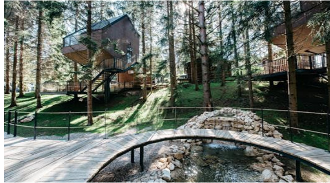
Slika 3: Glamping - Plitvice Holiday Resort

Izvor: Journal, www.journal.hr (11.11.2019.)