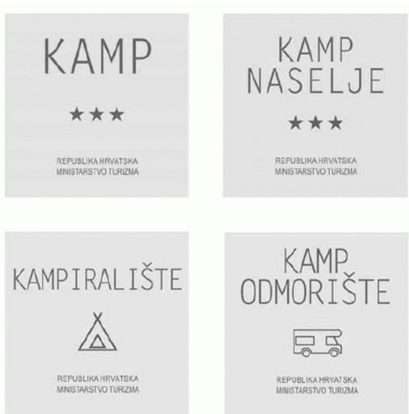
Slika 2: Grafička rješenja standardiziranih ploča za pojedine vrste kampa