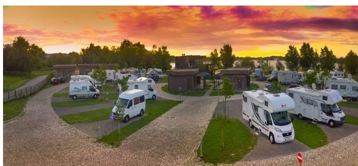
Slika 1: Kamp Zagreb