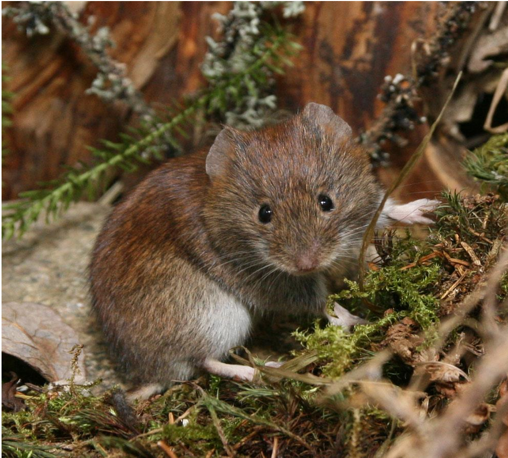
Slika 5. Šumska voluharica

Šumska voluharica ( Myodes glareolus ) je najrasprostranjenija vrsta unutar porodice voluharica. Tipičan je stanovnik šuma i šumskih rubova. Za razliku od drugih voluharica ova vrsta je arborealna te često traži hranu na drveću i u krošnjama. Aktivna je tijekom noći, sumraka i zore. Brlog se najčešće nalazi pod zemljom i često se nalazi ispod panjeva i korijena prevrnutog drveća. Ova vrsta se lako raspoznaje od drugih voluharica svojom specifičnom crvenkastosmeđom obojenošću i dugim repom. Brojnost populacije ove vrste u šumama ovisi o urodu šumskog sjemena. Štete čini na kori drvenastih vrsta (pomladka).