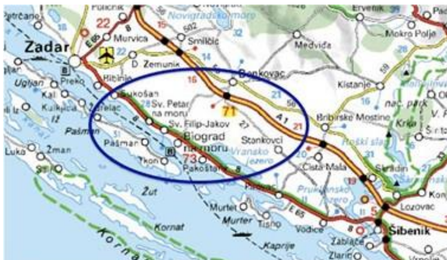
Slika 1. Geografski položaj Biograda na Moru