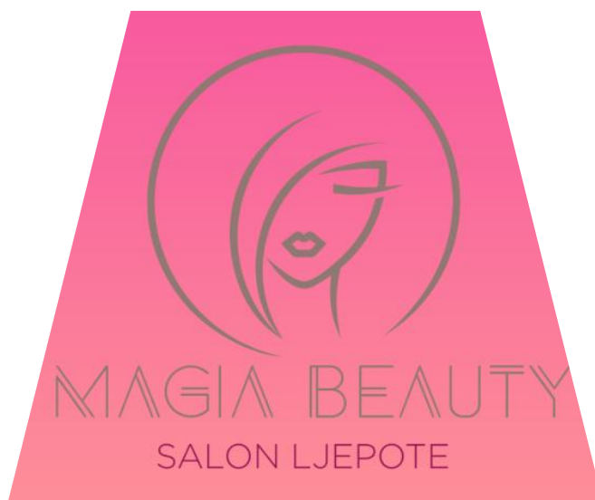
Slika 2. Logo salona ljepote Magia beauty

Zaštitni znak, odnosno logo, tvrtke je vrlo jednostavan, a upečatljiv. Sadrži ime tvrtke ispod animacije ženskog lica. Boje u pozadini zaštitnog znaka prelijevaju se od roze boje na vrhu ka narančastoj na dnu, taj aspekt boja podsjeća na čaroban zalazak Sunca koji, kao i narančasta boja, izražava žensku kreativnu energiju, radost i veselje.