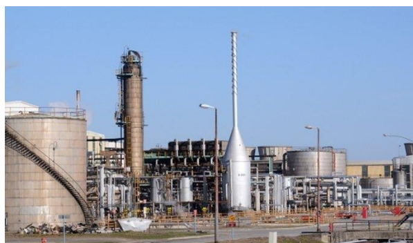
Slika 1. Rafinerija nafte Sisak [11]

Rafinerija nafte Sisak je smještena u Sisačko-moslavačkoj županiji u gradu Sisku, koji broji 47.768 stanovnika, na oko 50km udaljenosti od glavnog grada Republike Hrvatske, Zagreba. Rafinerija nafte Sisak se prostire u južnoj industrijskoj zoni na oko 4 km uz područje desne obale rijeke Kupe kod ušća u rijeku Savu na površini od 171 ha (slika 1).[6]