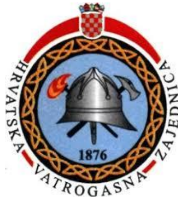
Slika 1. Oznaka Hrvatske vatrogasne zajednice [1]

vatrogasce“ izdan je 1882. godine. Obrađivao je teme kao što su: zadaci vatrogasnih društava, sredstva za gašenje i njihova upotreba, taktika gašenja požara te ustroj i oprema vatrogasnih postrojbi. Kako bi se unaprijedilo dobrovoljno vatrogastvo te zaštitili interesi dobrovoljnih vatrogasnih društava, Hrvatsko-slavonska vatrogasna zajednica je na skupštini 1899. godine utvrdila nacrt Gasnika za Kraljevinu Hrvatsku i Slavoniju. Zatražili su od Vlade da zakonom urede vatrogastvo u Kraljevini te da izdvajaju 2% od njihovih bruto prihoda za vatrogastvo. Na kraju skupštine, dobrovoljni vatrogasci Hrvatske dobili su svoju oznaku koju nose na ovratniku, nju čine kaciga i u križ postavljeni čekić i sjekirica (Slika broj 1). To je bio početak stvaranja jedinstvenih vatrogasnih oznaka u Hrvatskoj. [1], [11]