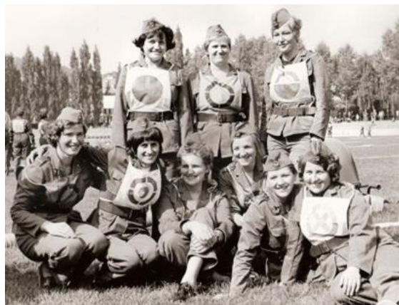
Slika 5. Dobrovoljno vatrogasno društvo na natjecanju 1970. godine [5]

Iz navedenog Pravilnika dobrovoljne vatrogasne službe i statuta konkretnog dobrovoljnog vatrogasnog društva (dobrovoljnog vatrogasnog društva Pobegi-Čežarij) možemo zaključiti kako nema velikih razlika u načinu obavljanja vatrogasne djelatnosti. [5]