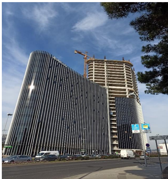
Slika 3: Sjedište OTP Banke u Splitu (lijevo) te u izgradnji (desno) najviši neboder u RH

U proteklom je desetljeću Split postao turistička hit destinacija, posebno mladih te je postao turistički šampion Hrvatske. U 2019. je ostvario 943 907 turističkih dolazaka, približujući se iznimno impresivnoj brojci od čak milijun turista, dok je broj noćenja iznosio 2,75 milijuna. 11 Te brojke su naravno i mnogo veće ako ubrojimo i okvirnu brojku od 300 000 kruzerskih posjetitelja te sve one koji prolaze kroz grad ili spavaju u neregistriranim objektima. Takve brojke iznimno potiču i lokalnu ekonomiju, od onih koji se direktno bave turističkom djelatnošću pa sve do drugih grana ekonomije koje indirektno također ostvaruju rezultate u kojima turisti igraju značajnu ulogu. U gradu buja privatni smještaj ali i sve veći broj luksuznih hotela, iznimnih ugostiteljskih objekata koji dobivaju nagrade na državnoj razini što za inovativnost i kreativnost, što za ambijent i kvalitetu hrane a iz godine u godinu novi restorani upotpunjuju i listu preporuka francuskog Michelinovog vodiča za Hrvatsku, svjetski priznatog vodiča za visoku gastronomiju. Iako brojke možda neće to direktno prikazati, financijski utjecaj turizma na ekonomiju grada Splita danas je postao toliko relevantan da se zaista može reći kako je postao glavna ekonomska pokretačka sila grada.