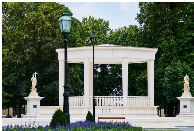
Slika 2. Trg Eugena Kvaternika