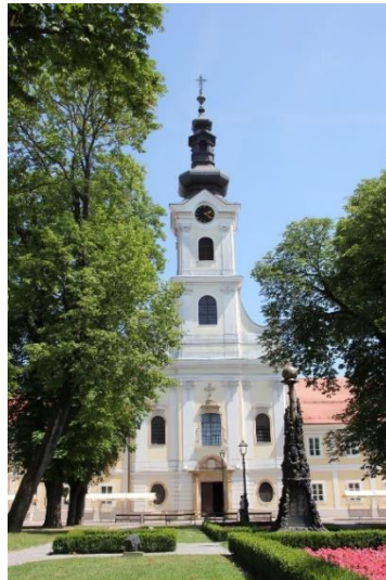
Slika 3. Bjelovarska katedrala