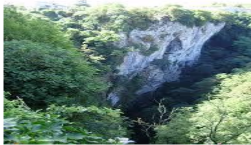
Slika 3. Pazinska jama