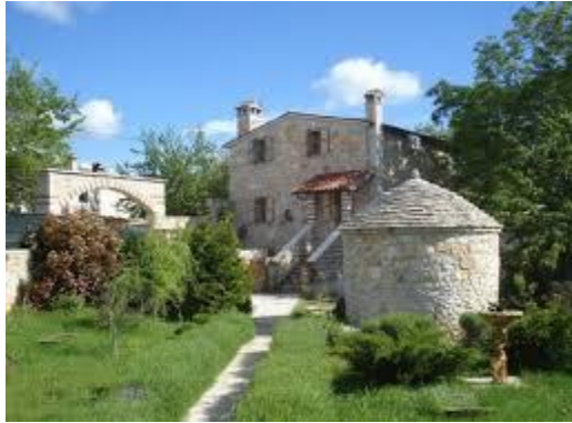
Slika 5. Kamena kuća u Istri