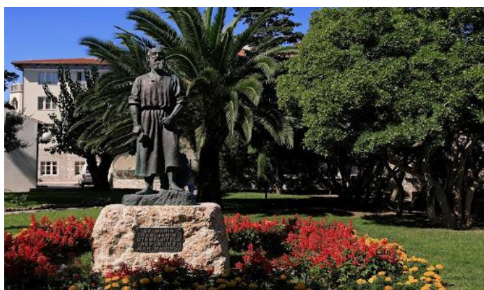
Slika 3. Spomenik Svetog Marina