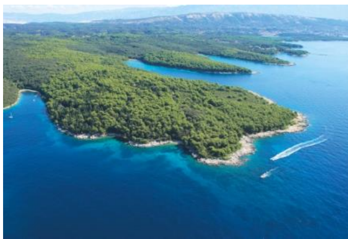
Slika 6. Poluotok Kalifront i šuma Dundo