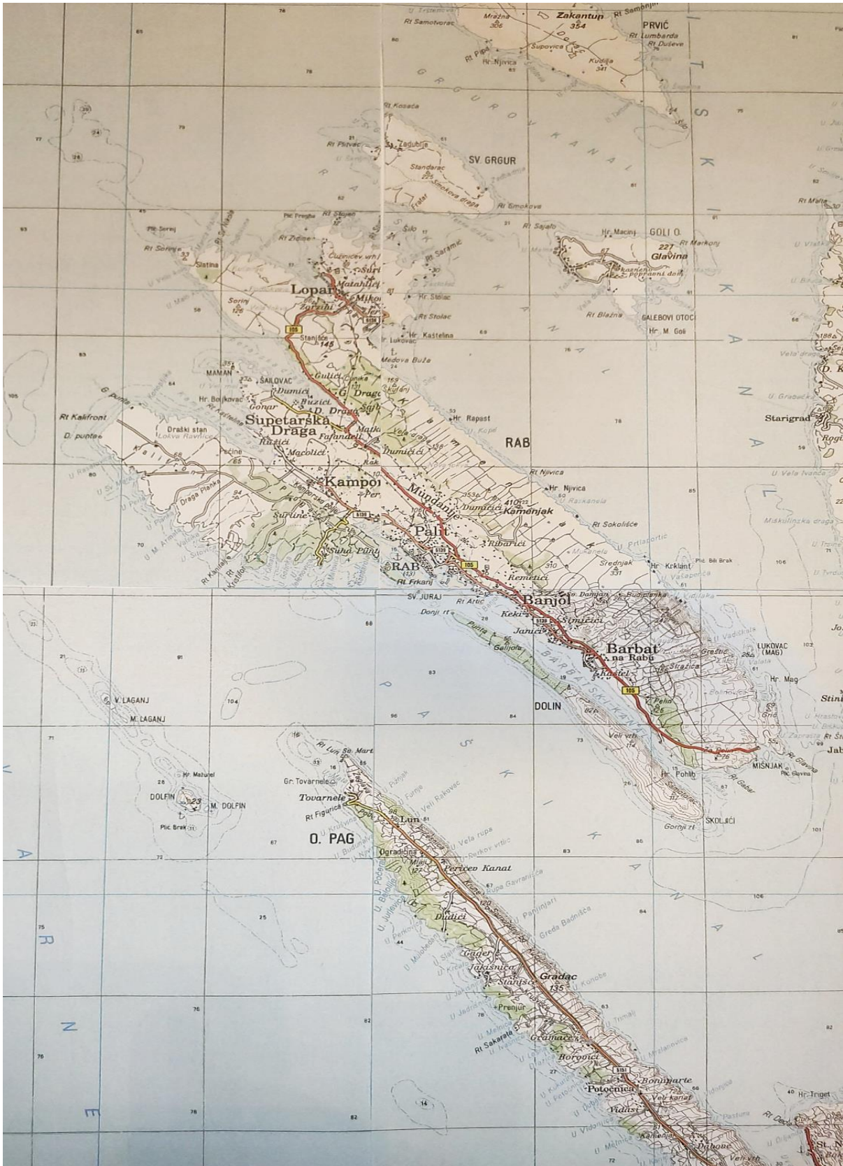
Slika 2. Karta otoka Raba