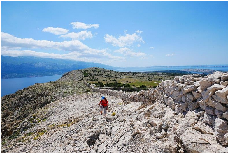
Slika 5. Vrh Kamenjak