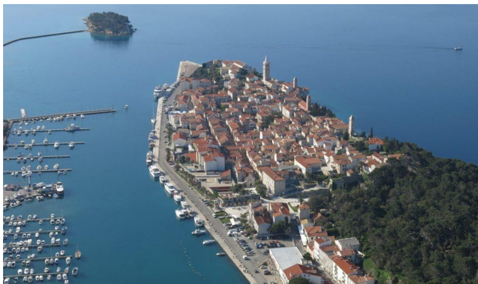
Slika 7. Grad Rab