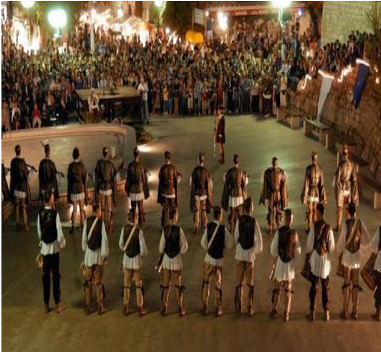
Slika 9. Rapska fjera