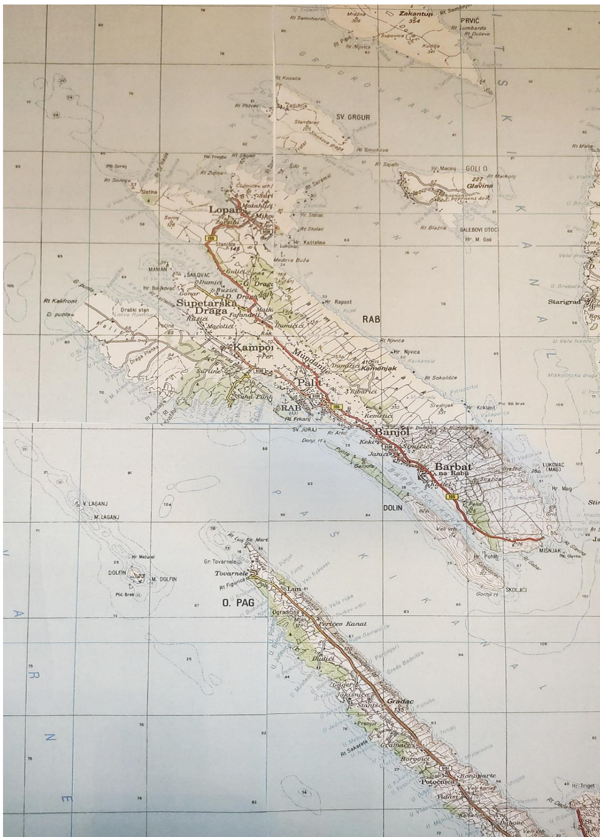
Slika 2. Karta otoka Raba