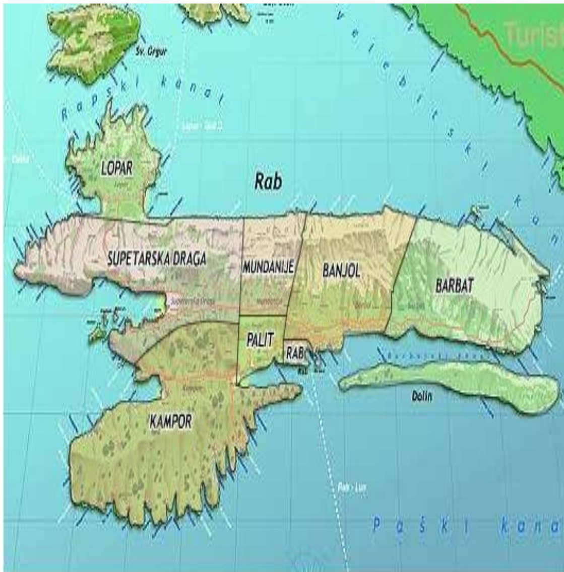
Slika 4. Naselja na otoku Rabu