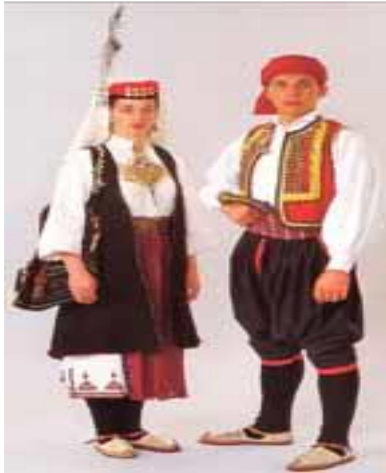
Slika 8. Narodna nošnja otoka Raba