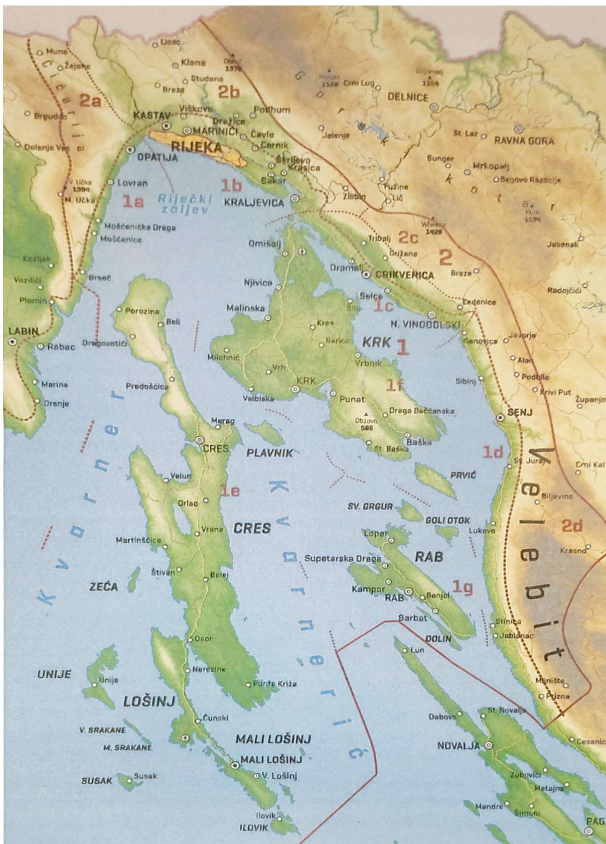
Slika 1. Kvarnersko primorje i otoci