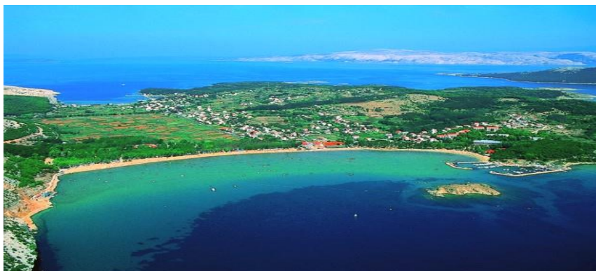
Slika 10. Rajska plaža