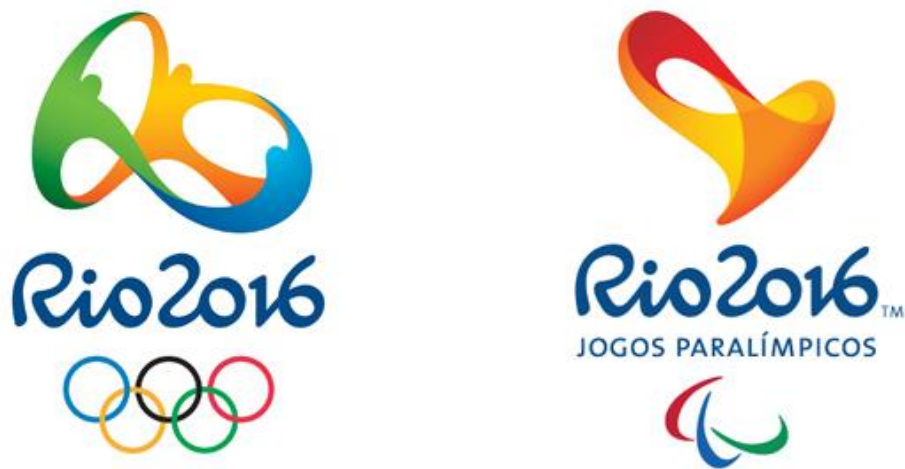
Slika 1. Amblem Rija 2016. [22]

U listopadu 2009. godine Međunarodni olimpijski odbor objavio je da je Rio de Janeiro grad domaćin Igre 2016. godine. Brazilska vlada morala je preuzeti odgovornost za koordinaciju sudjelovanja saveznih, državnih i općinskih agencija u sigurnosnoj operaciji Igre. Ministarstvo pravosuđa stvorilo je Specijalno tajništvo osiguranja za velike događaje (SESGE) koje je uspostavilo Integriranu kontrolu i kontrolu javne sigurnosti za velike događaje (SICC) i strukturiralo Integrirana zapovjednička i nadzorna središta (CICC) na nacionalnoj i regionalnoj razini za potporu inicijativama javne sigurnosti u glavnim događajima. [17]