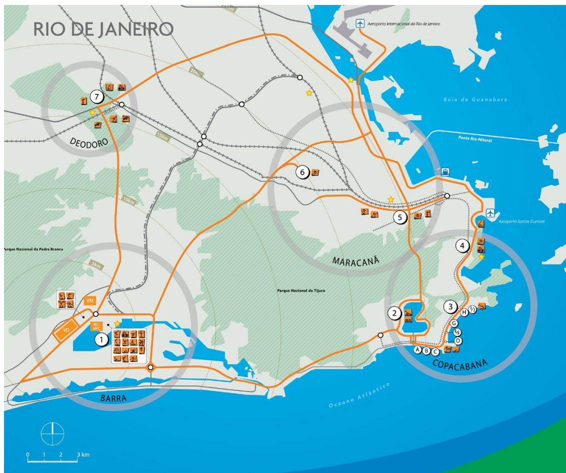
Slika 2. Četiri regije grada Rio De Janeira predviđene za korištenje prilikom olimpijskih igara [26]

Uobičajeno ukradeni predmeti uključuju novčanike, torbice, telefone i druge dragocjenosti. Iako su krađe obično bile nenasilne, zabilježeni su i ozbiljniji zločini, uključujući seksualno zlostavljanje, oružanu pljačku i ekspresnu otmicu. 2