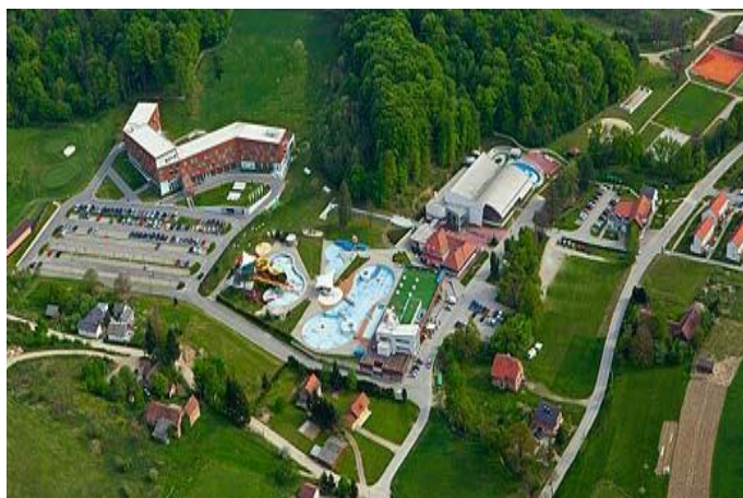
Slika 4. LifeClass Sv. Martin (snimka iz zraka)