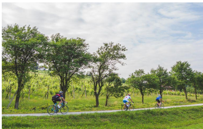
Slika 5. Biciklistička staza 1 u sklopu kompleksa LifeClass Sv. Martin