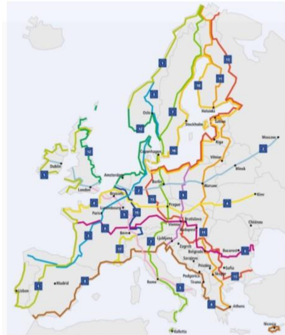
Slika 2. Europska mreža biciklističkih staza