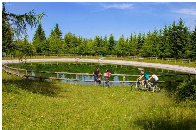
Slika 7. Jedna od biciklistička staza u sklopu hotela Cerkno