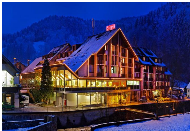
Slika 6. Hotel Cerčno