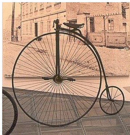
Slika 1. Model bicikla iz 19. stoljeća