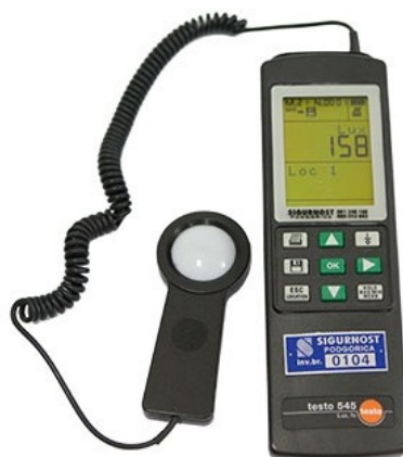
Slika 5. Luksmetar TESTO, tip 545

Kao mjerac osvjetljenosti korišten je luksmetar TESTO, tip: 545. (Slika 2.)