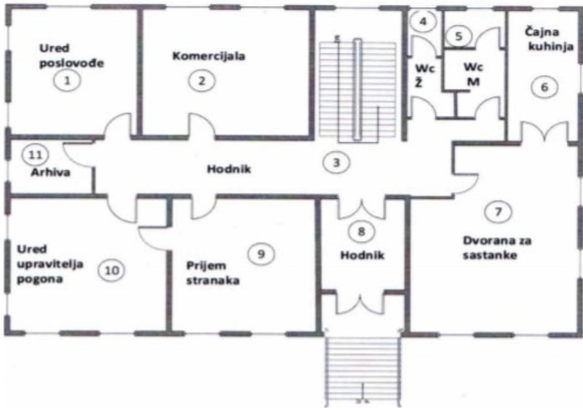
Slika 6. Tlocrt prizemlja