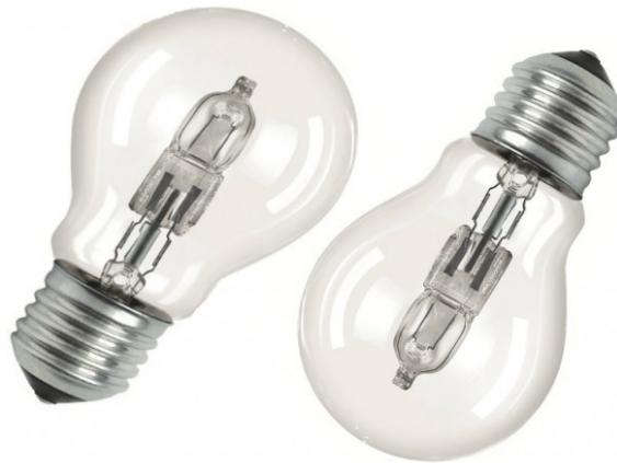
Slika 3: Halogena žarulja

Također, moguće je žarnu nit zagrijati na puno višu temperaturu, čime se podiže svjetlosna iskoristivost. Temperatura žarne niti kod ovih žarulja doseže 3000K, a stakla i do 250°C. zbog toga se mora koristiti balon od kvarcnog stakla, koje je specijalno dotirano tako da zadržava štetno UV zračenje. [7]