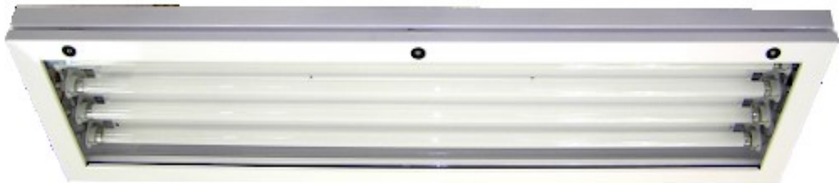
Slika 4: Fluorescentna svjetiljka

Fluorescentne cijevi proizvode skoro 2/3 ukupnog umjetnog svjetla u Europi. Svjetlo fluorescentnih cijevi je: jednoliko, ekonomično, dugotrajno, ali nije točkasto. Prosječan vijek trajanja izvora svjetla je period nakon kojeg 50% izvora svjetlosti radi. Koristan vijek trajanja izvora svjetla je period nakon kojeg rasvjetni sustav daje 80% početnog (nazivnog) svjetlosnog toka. [9]