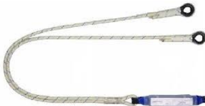
Slika 8. Dvostruko fiksno uže s usporivačem

Usporivači pada su naprave koje se koriste kako bi ograničili silu trzaja koja djeluje na tijelo kada dođe do pada, Slika 8. Usporivač pada je komponenta ili element sustava za zadržavanje pada koji ima zadatak da kinetičku energiju nastalu pri slobodnom padu prenosi na veznu liniju i sidrište pri čemu se svladavaju sile koje dovode do produženja naprave za usporavanje pada ili posebne izvedbe koje se temelje na trenju. Usporivači pada su uglavnom dizajnirani da se koriste integrirani s dinamičkim užetom i to tako da ukupna dužina svih elemenata ne prelazi 2m bez opterećenja. Materijal za izradu je najčešće od poliesterskih vlakana koja se pletu u tvrda tkanja [12].