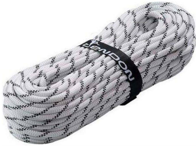
Slika 7. Statičko uže

Statičko uže je najčešće korišteno uže kod tehnike pristupa i preporučuje se kako za korištenje za rad tako i za sigurnosnu liniju u većini slučajeva, Slika 7.