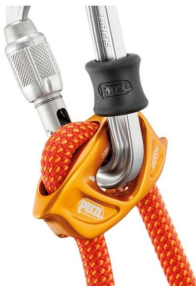
Slika 9. Spojni elementi