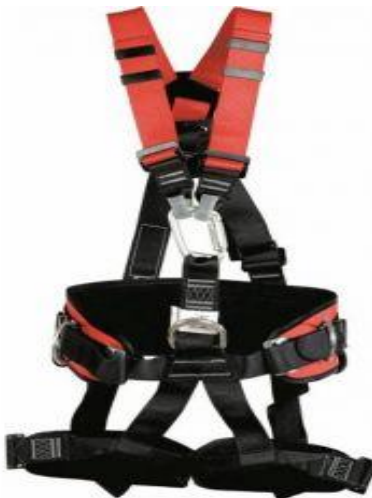
Slika 6. Zaštitni pojas za cijelo tijelo