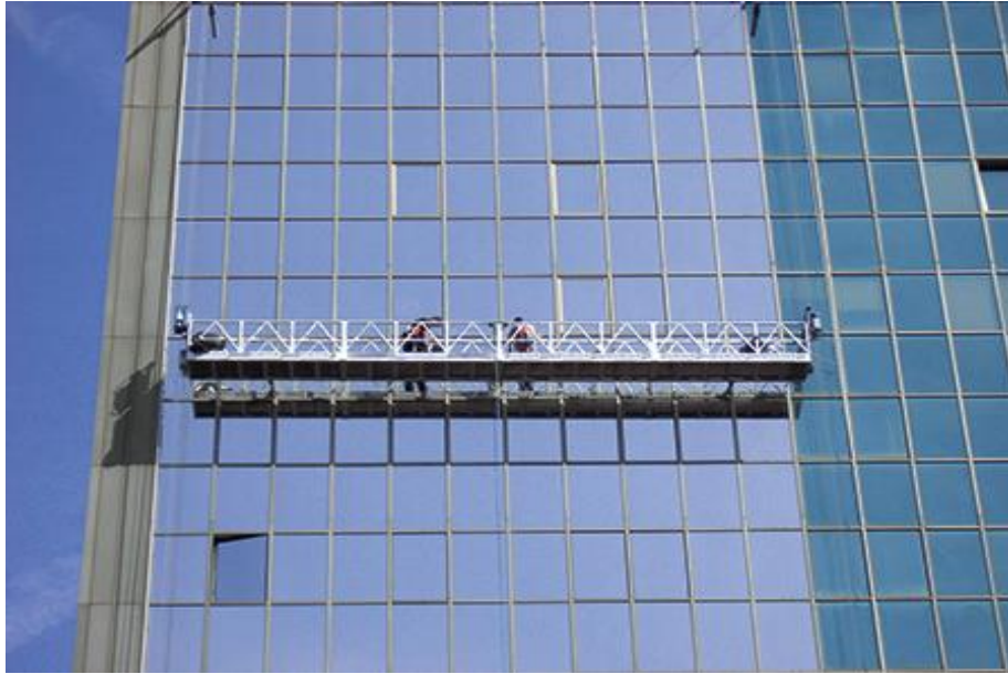
Slika 3. Viseća skela

Upotreba vreća sa pijeskom ili drugim materijalom i nagomilavanje kakvog drugog nekompaktnog materijala radi opterećenja i održavanja ravnoteže nosača viseće skele, zabranjeni su. Svi elementi koji služe za vezivanje i učvršćivanje viseće skele za nosače na objektu, moraju biti izrađeni od atestiranog materijala i dimenzionirani prema najvećem dozvoljenom opterećenju viseće skele [2].