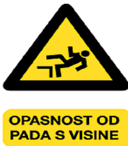
Slika 5. Znak opasnosti od pada s visine