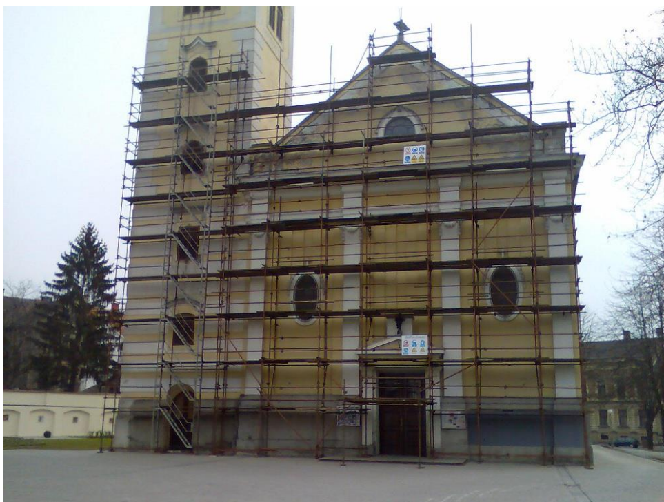
Slika 4. Fasadne skele

Ako fasadna skela nije stalno postavljena na objekt, već se premješta s jednog na drugi objekt, svaki puta se nakon postavljanja skele, a prije puštanja u rad ponovno pregledava i ispituje, Slika4.