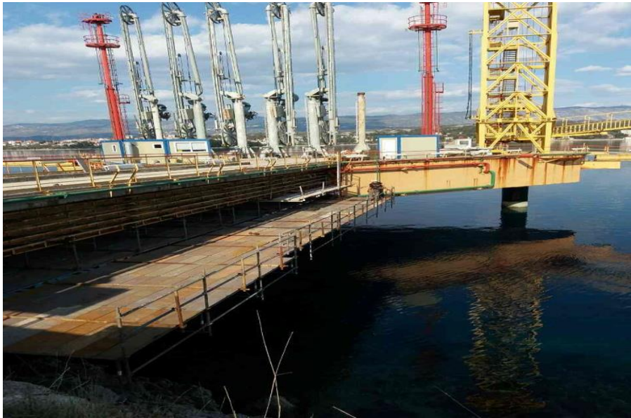
Slika 2. Konzolna skela

u pravilu, obješene iznad mjesta rada i pomoću pogonskog motora i vitla sa čeličnim užetom pokreću košaru koja visi na tom užetu [2].