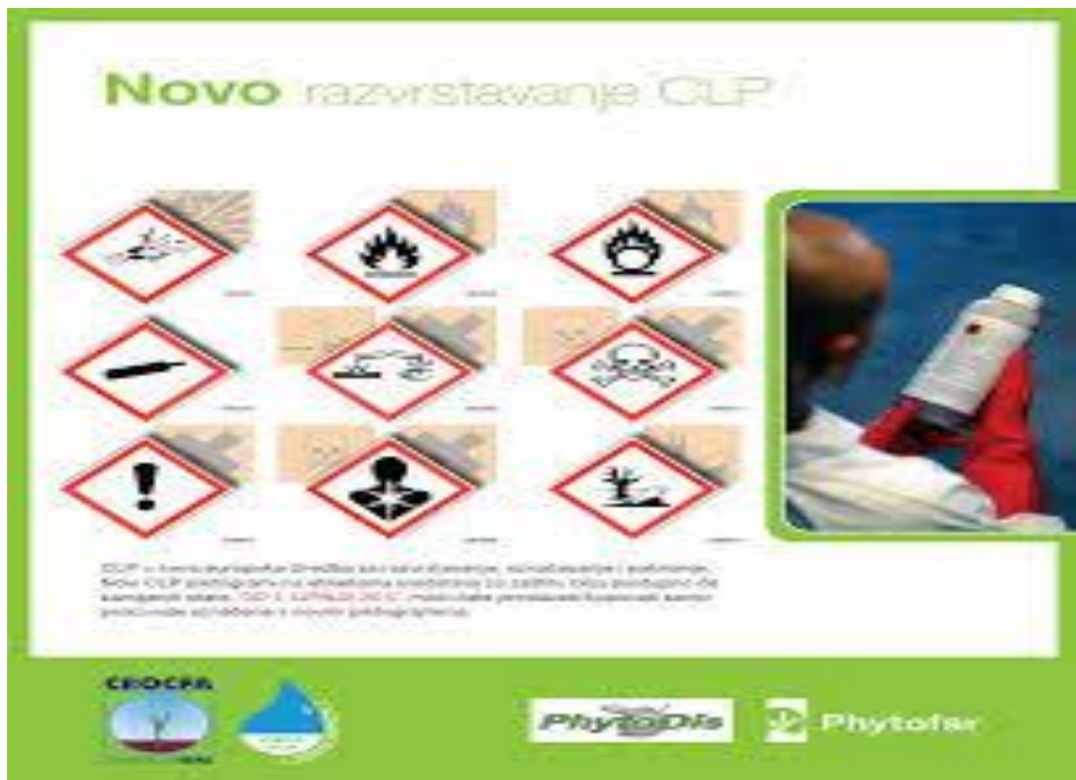
Slika 2 Upute na etiki proizvoda