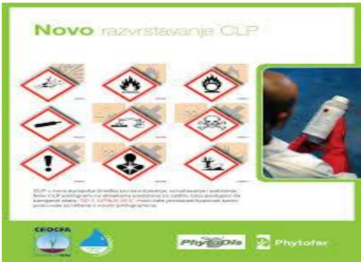
Slika 2 Upute na etiki proizvoda