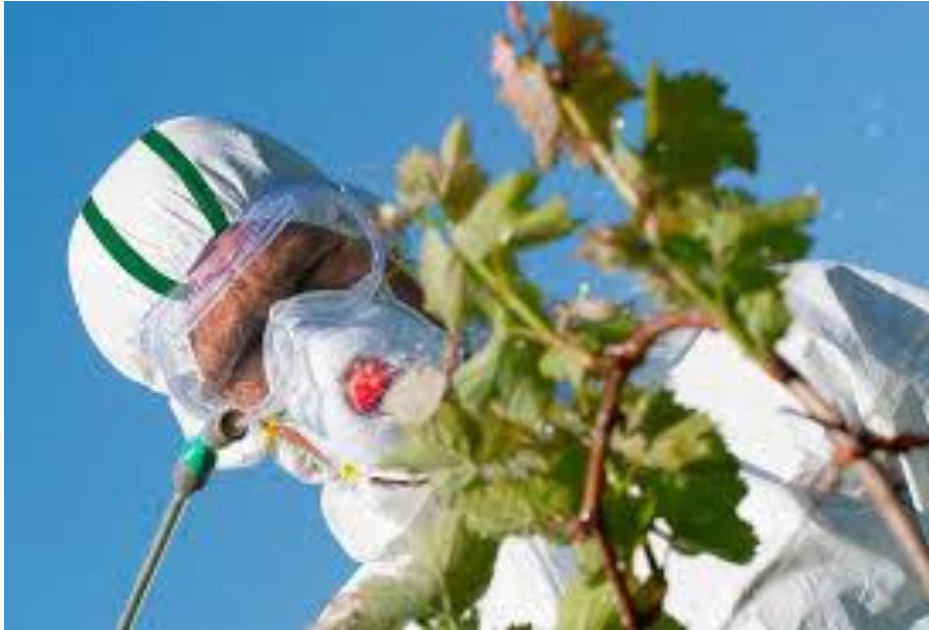
Slika 10 Zaštitne naočale