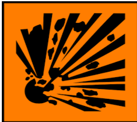
Slika 6 Simbol za eksplozivno

Izvor: [ https://images.app.goo.gl/NYh1KmGZVT AeAHnR9 ]