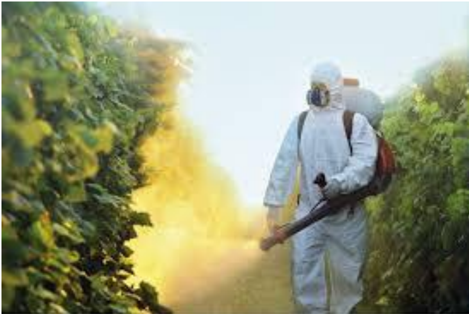
Slika 11 Radno odijelo