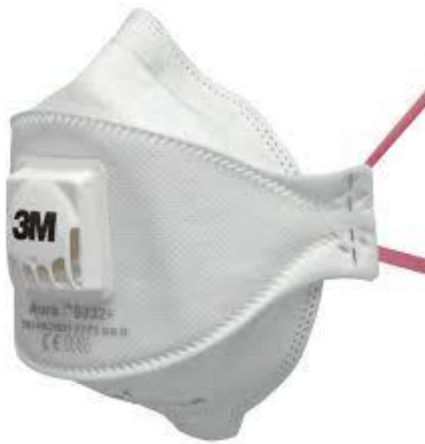
Slika 12 Zaštitna maska za nos i usta