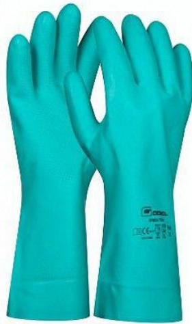
Slika 8 Gumene rukavice