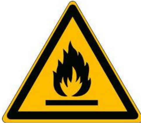
Slika 5 Simbol za lako zapaljivo

Ova vrsta opasnosti javlja se pri radu sa zapaljivim i eksplozivnim tvarima.