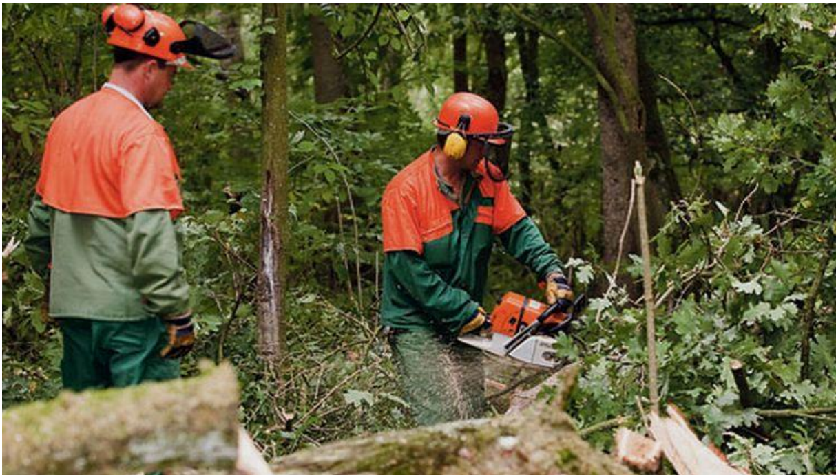
Slika 3 Primjer neodgovarajuće izvedene površine za kretanje

Podrazumijevaju sve vrste opasnosti koje nastaju zbog mehaničkih djelovanja strojeva, uređaja i opreme te neodgovarajuće izvedenih prostora i površina za rad i kretanje