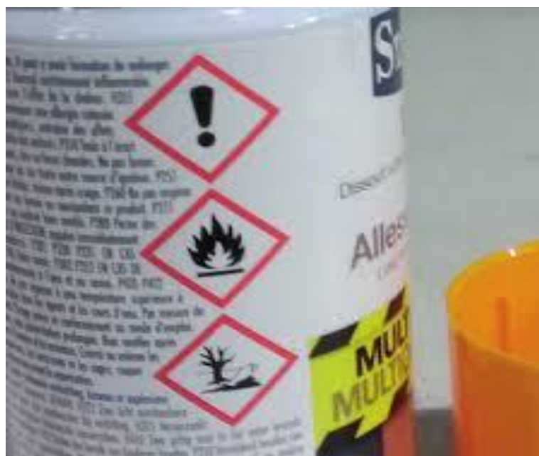
Slika 1 Upute na etiki proizvoda