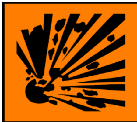
Slika 6 Simbol za eksplozivno