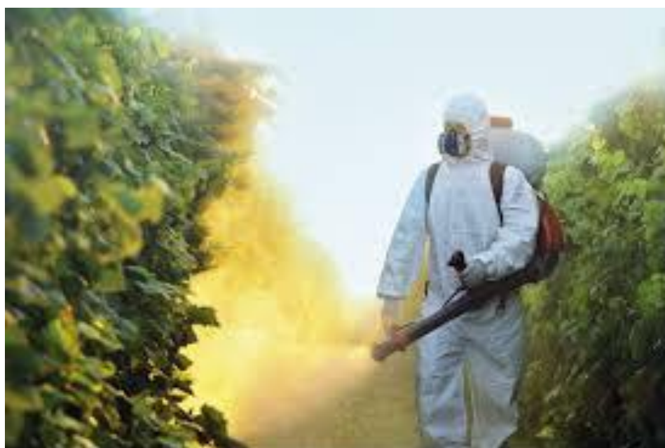
Slika 11 Radno odijelo

Izvor: [ https://images.app.goo.gl/aoTFKWckXtYtN81z6 ]