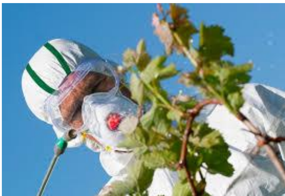
Slika 10 Zaštitne naočale

Izvor: [ https://images.app.goo.gl/aoTFKWckXtYtN81z6 ]