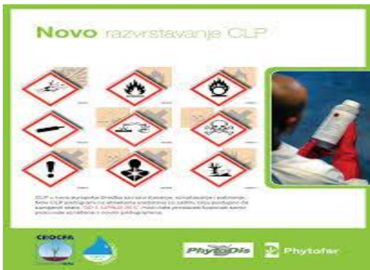
Slika 2 Upute na etiki proizvoda