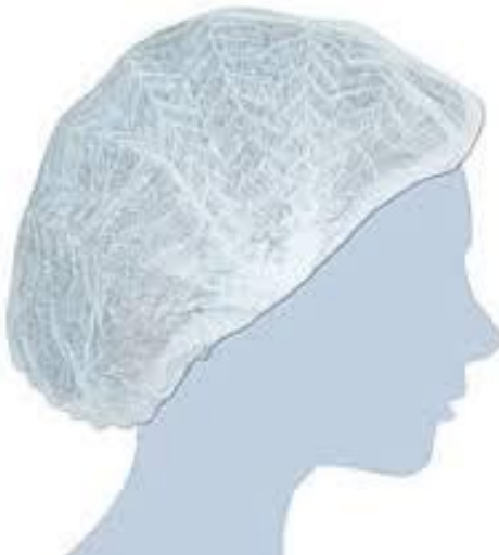
Slika 13 Zaštitna kapa