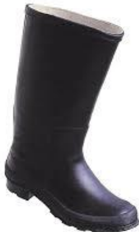
Slika 9 Gumene čizme