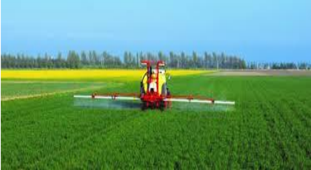
Slika 7 Primjer prskanja traktorskom prikolicom

odgovarajuća osobna zaštitna oprema (zaštitna odjeća, maska, rukavice slika 9.) i za primjenitelja i za radnika.